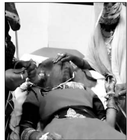
घायल दुल्हन का अस्पताल में उपचार किया।