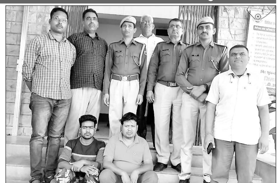
बाड़मेर में कोतवाली पुलिस ने सोना चोरी के मामले में दो आरोपियों को गिरफ्तार किया।