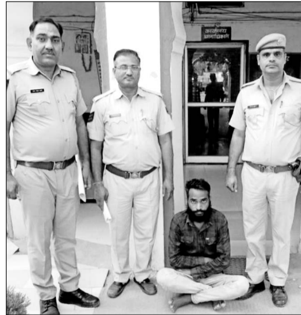
पावटा पुलिस ने चोरी के आरोपी को गिरफ्तार किया।