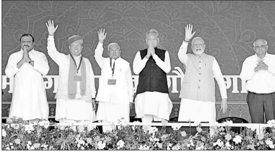
शहीदी मानगढ़ धाम पर जनता का अभिवादन स्वीकार करते पीएम मोदी, सीएम गहलोत, केन्द्रीय मंत्री अर्जुनराम मेघवाल व अन्य नेता।

वहीं मानगढ़ धाम को राष्ट्रीय स्मारक घोषित करने पर उन्होंने कहा कि चार राज्यों राजस्थान, गुजरात, मध्यप्रदेश, महाराष्ट्र के मुख्यमंत्रियों से अपील करता हूँ। इसके लिए एक रोडमैप तैयार करें, इसके लिए वर्ल्ड क्लास विकास के लिए चारों राज्य काम करें। नरेंद्र मोदी ने कहा कि मानगढ़ धाम और गुरु गोविंद सिंह