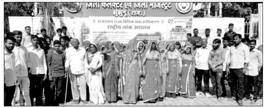
कलेक्टर पर प्रदर्शन के दौरान सहरिया बस्ती की महिलाएं भी मौजूद रहीं।

को ज्ञापन देने पहुंची महिलाओं एवं पुरुषों ने बताया कि कॉलोनी में कुछ लोगों को अनैतिक गतिविधियों की वजह से बाहरी लोगों की आवाजाही रहती है।