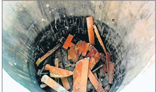
क्षतिग्रस्त हौज में पड़ी हुई पट्टियां।

हुआ है, वहीं अब बच्चों अपने घर से पानी की बोतल लाकर काम चलावा पड़ रहा है तो दूसरी तरफ विद्यालय परिसर में अनेक किस्म के पेड़ पौधों को भी पर्याप्त पानी नहीं मिल पाने से इनके भी मुरझा जाने का खतरा हो गया है। जानकारी के अनुसार इसी विद्यालय में आंगनबाड़ी केंद्र में संचालित है जहां पर नौनिहालों पढाया जाता है। इनकी सुरक्षा के मद्देनजर स्कूल प्रशासन की ओर से संबंधित