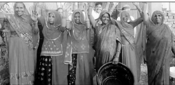
कोटपुतली में पानी की किल्लत को लेकर प्रदर्शन करती महिलायें।