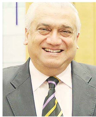
Talmiz Ahmad- Former Indian Diplomat.

The focus of Arab nationalism shifted from "Albion perdue" to Israel after the November 1947 UN partition of Palestine. War broke out almost immediately, but the combined Arab armies were no match for the Western-funded and militarily well-equipped and brilliantly led Jewish army. The Arabs were thus unable to forestall "Al Naqba" (The Catastrophe) that overtook them with the proclamation of the State of Israel on May 14, 1948.