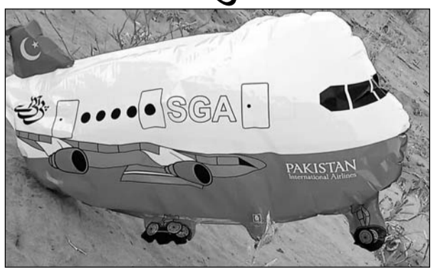
भारत-पाक सीमा पर मिली गुब्बारा जैसी आकृति।