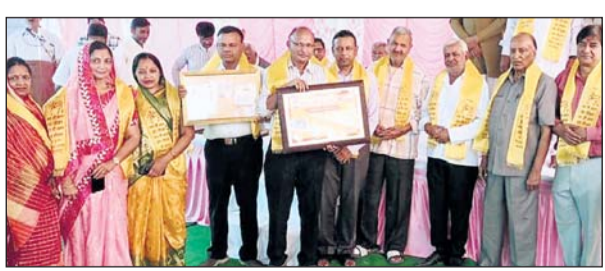
श्री कृष्ण गोशाला में में गौसेवकों का सम्मान किया।