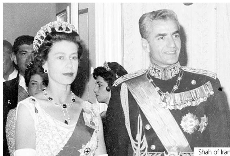
Shah of Iran.

All that changed in the 1990s with Prime Minister P.V. Narasimha Rao extending full diplomatic recognition to Israel, backstopping Yasser Arafat's last throw of the dice at Oslo, and initiating a process that has resulted in a policy of "balance" towards rival forces playing out in the region; in other words, replacing principle and idealism with a transactional relationship with all. This has involved strengthening relations with monarchies who have made their peace with Israel; "de-hyphenating" Israel from Palestine but coming down so heavily on the Israeli side that neither the Palestine Authority nor Hamas are taken in; weakening India's support in the UN and elsewhere for the Palestinian cause; attempting to accommodate Iran without jeopardising relations with Iraq or the US: that is, being all things to all people, none of whom are hoaxed.