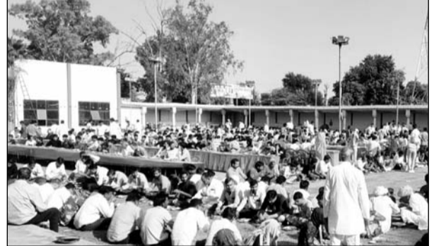
कोटपुतली में पंगत प्रसादी ग्रहण करते श्रद्धालु।

कोटपुतली, (निर्स)। कस्बे के पुतली रोड़ स्थित शरणम पैराडाईज मैरिज गार्डन में श्री श्याम शक्ति मण्डल कोटपुतली ट्रस्ट द्वारा हर वर्ष की पांति इस वर्ष भी मंगलवार को विशाल अन्नकूट प्रसादी महोत्सव का आयोजन किया गया। सर्वप्रथम ट्रस्ट के पदाधिकारियों द्वारा श्याम बाबा का आकर्षक दर्बार सजाकर आरती उतारते हुए भोग लगाया गया। जिसके बाद अन्नकूट प्रसादी का वितरण शुरू हुआ। गौरतलब है कि गोपाष्टमी के अवसर पर विगत तीन