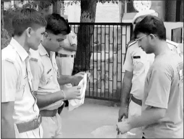
कैंडिडेट्स की जांच कर कड़ी सुरक्षा में एंट्री दी गई।

वहीं, एग्जाम शुरू होने से पहले ही बाबू शोभाराम राजकीय कला महाविद्यालय में महिला लेक्चरर (वीक्षक) की तबीयत बिगड़ गई। जिनको