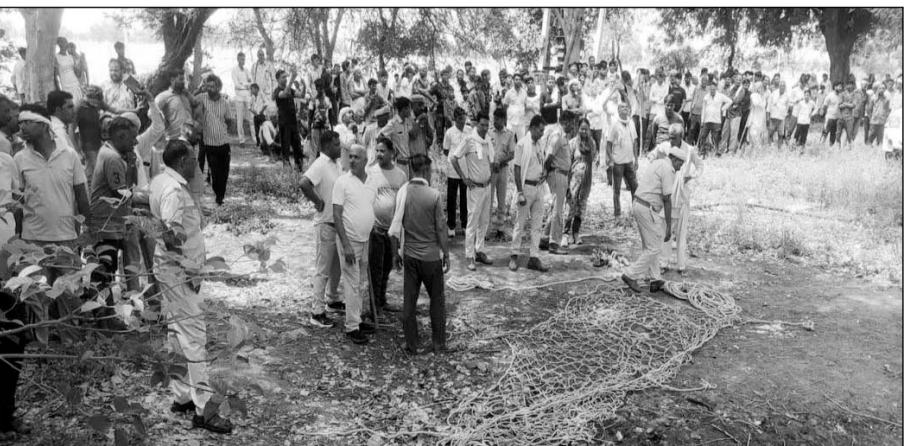
धौलागढ़ थाना पुलिस, वन विभाग के एसोएफ, रेंजर और सरिस्का टाइगर रिजर्व की विशेष रेस्क्यू टीम मौके पर पहुंची और पैथर को पकड़ने के प्रयास शुरू किये।

किसानों पर हमला करने के बाद पैथर भागकर पास ही मौजूद एक ऊंचे पेड़ पर चढ़ गया। वह पिछले कई घंटों से उसी पेड़ पर डेरा जमाए बैठा है। जैसे ही गांव में खबर फैली, पूरे इलाके में बैठसनी फैल गई। देखते ही देखते आसपास के कई गांवों से सैकड़ों ग्रामीण मौके पर जमा हो गए। लोगों के मन में पैथर को लेकर जहां एक तरफ भारी