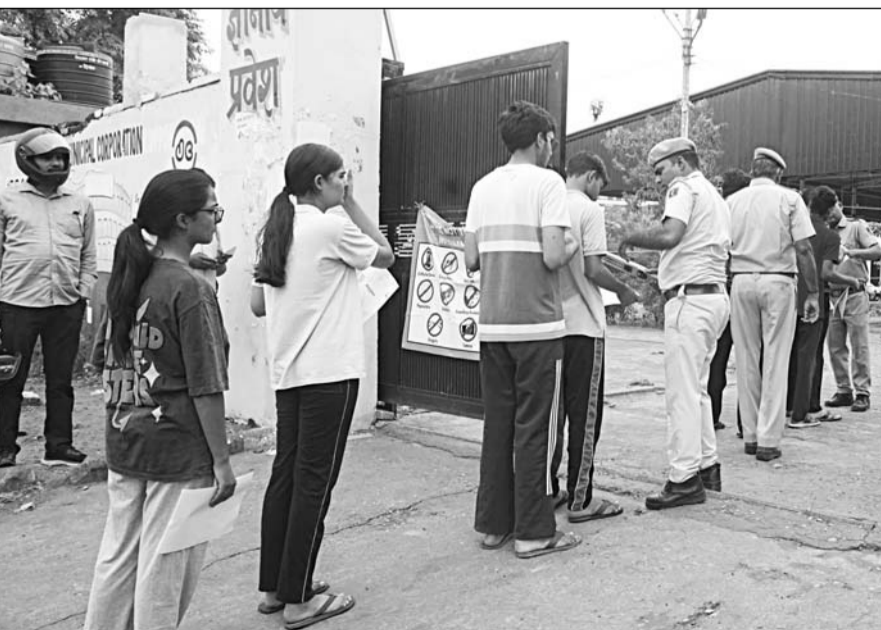
नीट परीक्षा देने पहुंचे अभ्यर्थियों को परीक्षा केंद्र में प्रवेश देने से पूर्व पुलिस ने उनकी गहनता से जांच की। सहायता से अभ्यर्थियों के बालों तक की गहन जांच की। निर्धारित समय के अनुसार दोपहर 1:30 बजे परीक्षा केंद्रों के प्रवेश द्वार बंद कर दिए गए और इसके बाद किसी भी अभ्यर्थी को प्रवेश नहीं दिया गया। गांधी नगर स्थित केंद्रों पर अंतिम समय तक लाउडस्पीकर के माध्यम से अभ्यर्थियों को समय पर पहुंचने के निर्देश दिए जाते रहे।

-कार्यालय संवाददाता- जयपुर। राष्ट्रीय पात्रता सह प्रवेश परीक्षा (नीट-यूजी) की पुनः परीक्षा रविवार को राजधानी जयपुर में कड़े सुरक्षा प्रबंधों और प्रशासनिक निगरानी के बीच शांतिपूर्ण एवं सुव्यवस्थित ढंग से संपन्न हुई। जयपुर जिले के 103 परीक्षा केंद्रों पर आयोजित परीक्षा में 37128 अभ्यर्थी पंजीकृत थे। जिनमें से 34031 अभ्यर्थी उपस्थित रहे, जबकि 3,097 अनुपस्थित रहे। इस प्रकार कुल उपस्थित 91.66 प्रतिशत दर्ज की गई। परीक्षा दोपहर 2 बजे शुरू होकर शाम 5:15 बजे समाप्त हुई। नेशनल टेस्टिंग एजेंसी (एनटीई) ने अभ्यर्थियों को 15 मिनट का अतिरिक्त समय दिया। परीक्षा समाप्त होने के बाद 22 गोदाम सिकिल, परकोटा क्षेत्र के प्रमुख बाजारों तथा शहर के कई व्यस्त मार्गों पर परीक्षाार्थियों और उनके परिजनों की भीड़ उमड़ने से यातायात व्यवस्था प्रभावित नहीं और कई स्थानों पर वाहन रंगते नजर आए। परीक्षा की संवेदनशीलता को देखते हुए इस बार अभूतपूर्व सुरक्षा व्यवस्था की गई थी। अभ्यर्थियों को परीक्षा केंद्र में प्रवेश से पहले श्री-लेयर सिक्वोरिटी जांच से