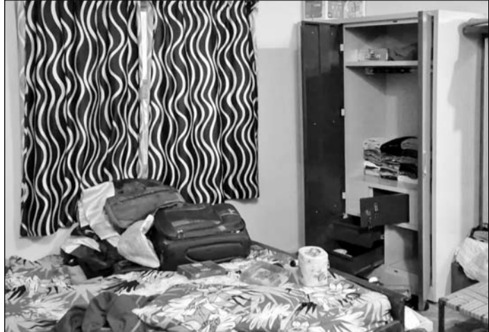
बदमाशों ने लूट करने के लिये अलमारियों में रखा सामान बिखेर दिया।

वारदात को अंजाम देने के बाद आरोपी घर में लगे सीसीटीवी कैमरों का डीवीआर भी अपने साथ ले गए। माना जा रहा है कि पहचान दिया गया ताकि वे किसी को सूचना न दे सकें। परिवार के अनुसार बदमाश कट्टों, रिवाँल्वर और चाकुओं जैसे हथियारों से लैस थे। उन्होंने पूरे