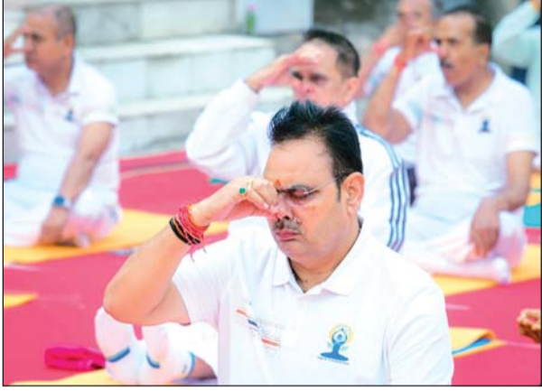
मुख्यमंत्री भजनलाल शर्मा ने अंतर्राष्ट्रीय योग दिवस के अवसर पर सिरोंही जिले के आबू राज में आयोजित राज्यस्तरीय कार्यक्रम में योगाभ्यास किया।

अंतर्राष्ट्रीय योग दिवस की थीम 'स्वस्थ वृद्धावस्था के लिए योग' है। इसका संदेश यह है कि योग केवल युवाओं तक सीमित नहीं, बल्कि यह बढ़ती उम्र के लोगों को भी शारीरिक रूप से सक्रिय, मानसिक रूप से संतुलित और भावनात्मक रूप से मजबूत रखने का सशक्त माध्यम है।