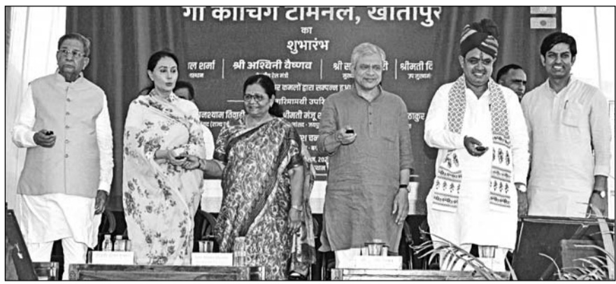
केन्द्रीय रेल मंत्री अश्विनी वैष्णव और मुख्यमंत्री भजनलाल शर्मा ने रविवार को जयपुर के खातीपुरा रेलवे स्टेशन से जयपुर-दरभंगा अमृत भारत एक्सप्रेस रेल सेवा को हरी झंडी दिखाकर रवाना किया। इस मौके पर उपमुख्यमंत्री दीपा कुमारी तथा सांसद घनश्याम तिवारी व सांसद मंजू शर्मा मौजूद थे।

-कार्यालय संवाददाता- जयपुर। केन्द्रीय रेल मंत्री अश्विनी वैष्णव और मुख्यमंत्री भजनलाल शर्मा ने रविवार को जयपुर के खातीपुरा रेलवे स्टेशन से जयपुर-दरभंगा अमृत भारत एक्सप्रेस रेल सेवा को हरी झंडी दिखाकर रवाना किया। इस अवसर पर रेल मंत्री ने सीकर जिले के खादूरग्रामजी क्षेत्र में सुंदरपुरा रेलवे स्टेशन के निर्माण की घोषणा करते हुए कहा कि नया स्टेशन खादूरग्रामजी से लगभग 11 किलोमीटर दूरी पर राष्ट्रीय राजमार्ग के निकट बनाया जाएगा। इसके लिए भूमि का चयन कर लिया गया है तथा अगले 12 महीनों में निर्माण कार्य पूरा करने का लक्ष्य रखा गया है। कार्यक्रम में उपमुख्यमंत्री दीपा कुमारी, राज्यसभा सांसद घनश्याम तिवारी, जयपुर शहर सांसद मंजू शर्मा सहित अनेक जनप्रतिनिधि उपस्थित रहे। वहीं बिहार के मुख्यमंत्री सम्राट चौधरी तथा दरभंगा सांसद गोपाल टाकुर वीडियो कॉन्फ्रेंस के माध्यम से कार्यक्रम से जुड़े।