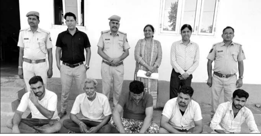
नसीराबाद पुलिस ने टैंकरों से अवैध रूप से गैस रीफिलिंग मामले में पांच जनों को हिरासत में लिया।