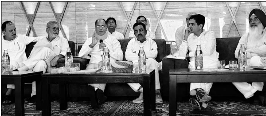
भादरा में जन स्वास्थ्य अभियांत्रिकी एवं भू-जल विभाग मंत्री कन्हैयालाल चौधरी ने विभागीय समीक्षा बैठक को संबोधित किया।

मंत्री कन्हैयालाल चौधरी ने कहा कि जनता मालिक है तथा जनता का ही पैसा है, इसका सदुपयोग बहुत जरूरी है। प्रदेश सरकार भ्रष्टाचार के विरुद्ध जीरो टॉलरेंस की नीति पर कार्य कर रही है। पिलानी में पीएचडी के अधिकारियों की बैठक ली गई। कार्य में कोताही बरतने वाले 2 जेईएन व 1 एईएन को तुरंत निलंबित किया गया था। उन्होंने सख्त लहजे में कहा कि अगर यहां भी अधिकारी कोताही बरतेंगे, तो