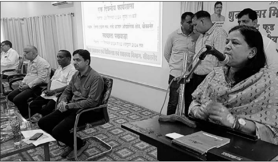
बीकानेर में शहरी क्षेत्र के स्ट्रीट वेंडर्स की एक दिवसीय कार्यशाला को संभागीय आयुक्त वंदना सिंघवी ने संबोधित किया।

संभागीय आयुक्त ने बताया कि प्रशिक्षण के दौरान वेंडर्स को शुद्ध तथा मिलावट हीन सामग्री विक्रय करने, थडियों के आसपास साफ-सफाई रखने, सुख और गीले कचरे के लिए अलग-अलग डस्टबिन रखने एवं इनका उपयोग सुनिश्चित करने, टैफिक व्यवस्था को सुनियोजित रखने, थडियां निर्धारित सीमा में रखने के साथ यातायात व्यवस्था बनाए रखने में उनकी जिम्मेदारी के बारे में बताया गया। इस दौरान संभागीय आयुक्त ने कहा कि स्ट्रीट वेंडर व्यवस्था बनाए