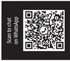
Scan to chat on WhatsApp

VISIT YOUR NEAREST NEXA DEALERSHIP TO GET EXCITING OFFERS UP TO ₹ 37 100*