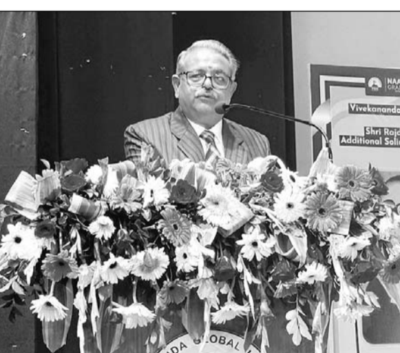
विवेकानन्द ग्लोबल यूनिवर्सिटी, जगतपुरा में राष्ट्रीय वीजीयू आर. के. रस्तोगी मेमोरियल नेशनल नेगोशिएशन प्रतियोगिता के उद्घाटन सत्र में मुख्य अतिथि उच्चतम न्यायालय के न्यायमूर्ति ऑगस्टीन जॉर्ज मसीह ने संबोधित किया।