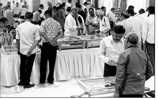
बीकानेर में आसानियों के चौक स्थित सूरज भवन में पुराने सिक्कों की प्रदर्शनी देखने लोग उमड़े।