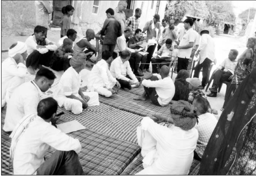
नगर गांव में पहुंची प्रदेश व जिला स्तरीय स्वास्थ्य टीम ने डोर टू डोर सर्वे किया।