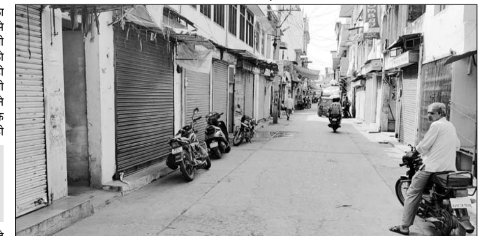
बंद के दौरान केकड़ी के बाजारों में सन्नटा पसरा रहा।

■ बार एसोसिएशन ने रविवार को भी केकड़ी बंद का आह्वान किया