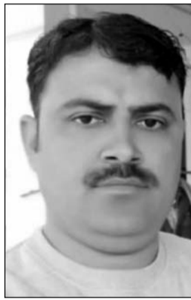
फरार आरोपी कांस्टेबल

सरकारी गाड़ी लेकर मौके से फरार हो गया। घायल कांस्टेबल को तत्काल स्थानीय अस्पताल ले जाया गया, जहां प्राथमिक उपचार के बाद हालत गंभीर होने पर उन्हें सुंभुनू रेफर किया गया। फिलहाल उनकी स्थिति स्थिर बताई जा रही है।