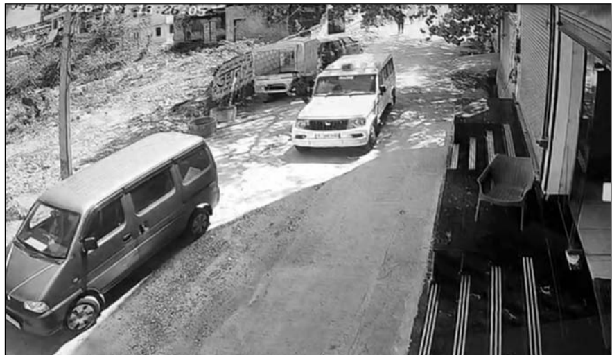
चिड़ावा थाने के कांस्टेबल ने एसीबी टीम पर ही बदमाशों की तरह गाड़ी चढ़ाने का प्रयास किया।

चिड़ावा, (निसं)। थाने में एसीबी की कार्रवाई के दौरान उस वक्त हड़कंप मच गया, जब रिश्त लेते पकड़े जाने के डर से आरोपी पुलिस कांस्टेबल ड्राइवर ने एसीबी टीम पर ही फिल्मी अंदाज में बदमाशों की तरह गाड़ी चढ़ाने का प्रयास किया। वारदात में एक एसीबी का कांस्टेबल गंभीर रूप