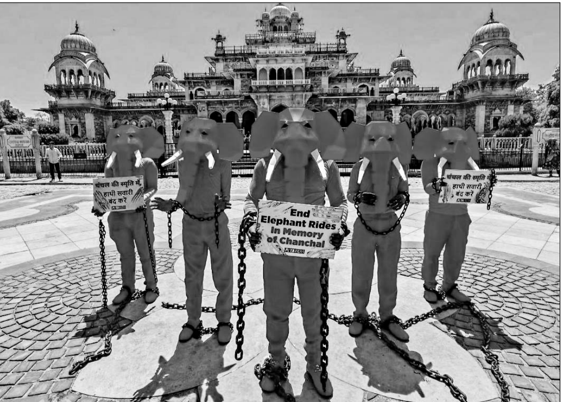
राजधानी जयपुर में हथिनी चंचल को गुलाबी रंगने और उसके बाद विदेशी फोटोग्राफर द्वारा फोटोशूट किये जाने के विरोध में शुक्रवार को घेटा द्वारा अलबर्ट हाल पर प्रदर्शन किया गया। ज्ञात रहे कि यह फोटोशूट करीब 1 साल पहले हुआ था, हथिनी चंचल की मौत भी हो चुकी है। पिछले दिनों जब यह तस्वीरें सोशल मीडिया पर सामने आयी थी, उसके बाद जमकर विवाद उपजा था। फोटो-राष्ट्रदूत