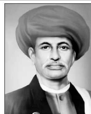
महात्मा ज्योतिबा फुले

हवा। असल में वर्ष 1848 में उनके साथ एक ऐसी घटना घटी जिसने उन्हें झकझोर दिया। वह अपने एक मित्र के विवाह में शामिल होने के लिए गए थे। मित्र उच्च कुल का था और विवाह समारोह में उनके साथ अपमानित व्यवहार हुआ। उन्होंने तभी तय कर लिया जाया कि स्वयं ही इस कुप्रथा को वह जड़ से समाप्त करेंगे। यही बाद में हुआ था। उन्होंने शुरुआत कहीं और से नहीं अपने ही घर से की। दलितों को अपने घर के कुएं को प्रयोग करने की अनुमति दे दी। दलितों और महिलाओं में अंधविश्वास के कारण उत्पन्न हुई आर्थिक और सामाजिक विसंगतियों को दूर करने के लिए भी उन्होंने आंदोलन चलाया। उनका मानना था कि यदि आजादी, समानता, मानवता, आर्थिक न्याय, शोषणरहित मूल्यों और भाईचारे पर आधारित सामाजिक व्यवस्था का निर्माण करना है तो असमान और शोषक समाज को उखाड़ फेंकना होगा। ज्योतिबा फुले युग से आगे की सोच रखते थे, इसीलिए महिला