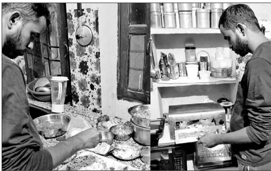
उदयपुर में कई युवा 'नाइट किचन' की शुरुआत कर अपनी आजीविका की स्टार्टअप की है। यह नाइट किचन घर से संचालित होकर लोगों को स्नैक्स आदि पहुंचा रहे हैं।

■ कई युवा इस 'स्टार्टअप' की शुरुआत कर लोगों को पहुंचा रहे स्वादिष्ट रसियायां