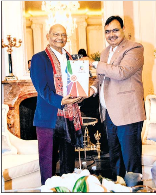
लंदन में मुख्यमंत्री भजनलाल से आज वेदांता समूह के चेयरमैन अनिल अग्रवाल ने मुलाकात की और राजस्थान में एक लाख करोड़ रु. के निवेश के लिए अपनी प्रतिबद्धता दोहराई।

में होगा और इसके अलावा, लघु और मध्यम उद्योगों के लिए गैर-लाभकारी (नॉन प्रॉफिट) आधार पर वेदांता ग्रुप उदयपुर के पास एक औद्योगिक पार्क भी स्थापित करेगा। मुख्यमंत्री और अनिल अग्रवाल के बीच "पुंछरी का लौठा" (गोवर्धन परिक्रमा से संबंधित एक महत्वपूर्ण