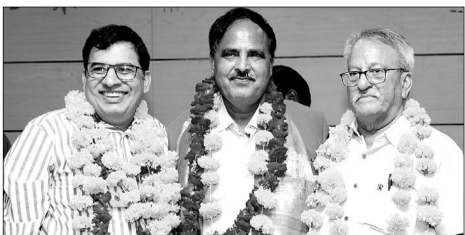
उदयपुर में पेसिफिक विश्वविद्यालय में आयोजित हो रही 75वीं ऑल इंडिया कॉमर्स कांफ्रेंस विकसित भारत 2047 का दूसरा दिन रोचक एवं नयी जानकारीयें से युक्त रहा।