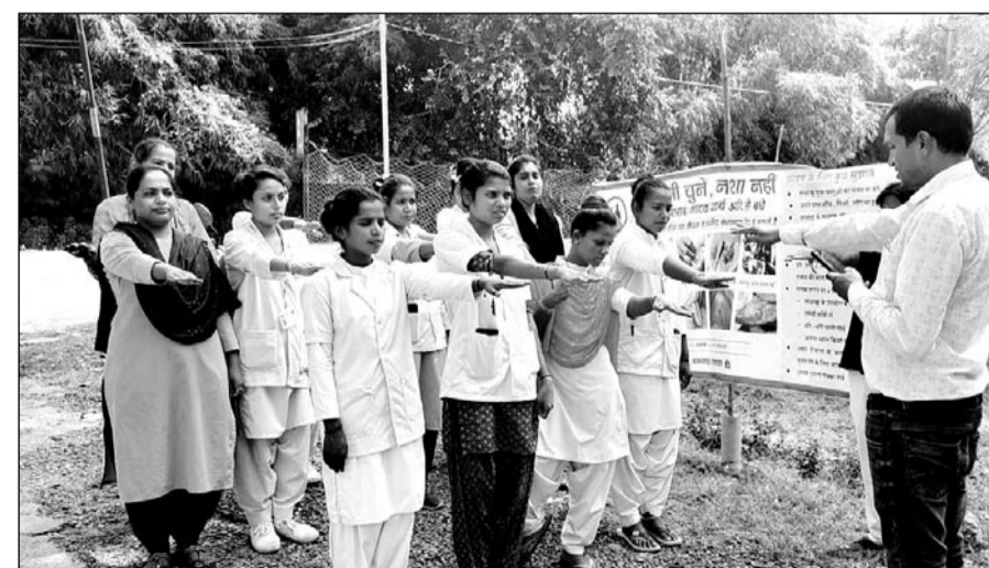
तंबाकू फ्री यूथ कैम्पेन 2.0 के तहत तंबाकू नहीं खाने की शपथ दिलाते चिकित्सा विभाग के कर्मिक।

बांसवाड़ा, (निसं)। तंबाकू फ्री यूथ कैम्पेन 2.0 के तहत शनिवार को चिकित्सा संस्थानों में तंबाकू के हानिकारक प्रभावों को बताने के लिए संकल्प कार्यक्रम चलाते हुए प्राथमिक स्वास्थ्य केंद्र, सामुदायिक स्वास्थ्य केंद्र और हेल्थ एंड वेलेनेस सेंटरों पर आने वाले मरीजों, परिजनों और स्वयं चिकित्सा कर्मिकों ने तंबाकू नहीं खाने और खाने वालों को भी छुड़वाने की शपथ ली।