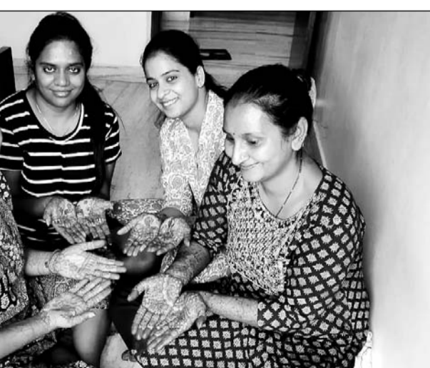
करवा चौथ पर्व को लेकर अपने घरों में हाथों पर मेहन्दी बनाती युवतियां।

करवा चौथ 20 अक्टूबर को आ रही है। करवा चौथ से 1 दिन पहले से सभी सुहागिनें मेहन्दी लगावाती हैं। करवा पूजन सामग्री के साथ ही अपनी शॉपिंग करती हैं। मैने भी अपनी शॉपिंग की है। करवा चौथ की सुबह सगरी लेकर पूरे दिन निराहार व्रत रखकर चांद को अर्घ्य देकर अपना व्रत खोलते हैं। पहले पति से पानी पीकर उसके बाद भोजन करते हैं। हमारी सनातन संस्कृति में करवा चौथ का काफी महत्व और सभी सुहागिन महिलाएं इसे पूरे मन से करती हैं। बाजार में करवा चौथ के लिए शॉपिंग