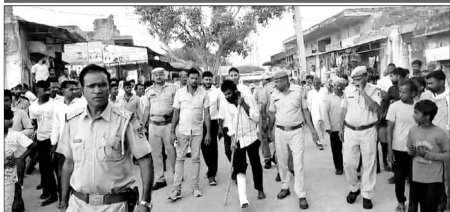
पाटन पुलिस ने पिस्तौल की नोक पर लूटपाट करने वाले अपराधियों को गिरफ्तार कर रायपुर-पाटन गांव में जुलूस निकाला।

पुलिस दोनों आरोपियों को रायपुर-पाटन गांव में ले जाकर जुलूस निकाला