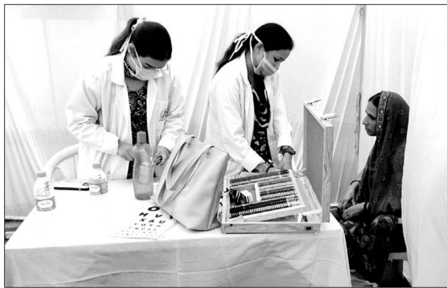
रेडक्रॉस सोसायटी जिला शाखा की ओर से आयोजित शिविर में आए रोगियों को परामर्श देते चिकित्सक।