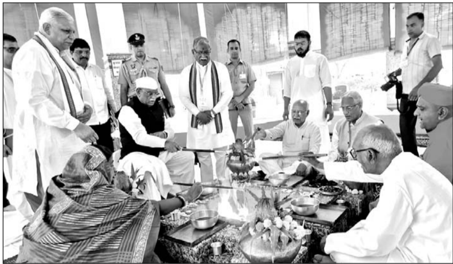
राज्यपाल हरिभाऊ किशनराव बागड़े ने ऋषि मेले में आयोजित यज्ञ में आहुति दी।

समारोह को संबोधित करते हुए राज्यपाल बागड़े ने कहा कि हमारा देश में अनेक धर्म व पंथ हैं और पूजा अर्चना के तरीके भी अलग हैं, लेकिन सभी का लक्ष्य एक ही होना चाहिए। उन्होंने कहा कि सनातन संस्कृति में गुरुकुल परंपरा हजारों साल चली आ रही है, लेकिन वर्तमान में धीरे-धीरे क्षीण होती जा रही है, गुरुकुल परंपरा को पुनः स्थापित कर पर जोर दिया। उन्होंने कहा कि आर्य समाज एक राष्ट्रवादी संस्था है और प्रारंभ से ही उसका लक्ष्य