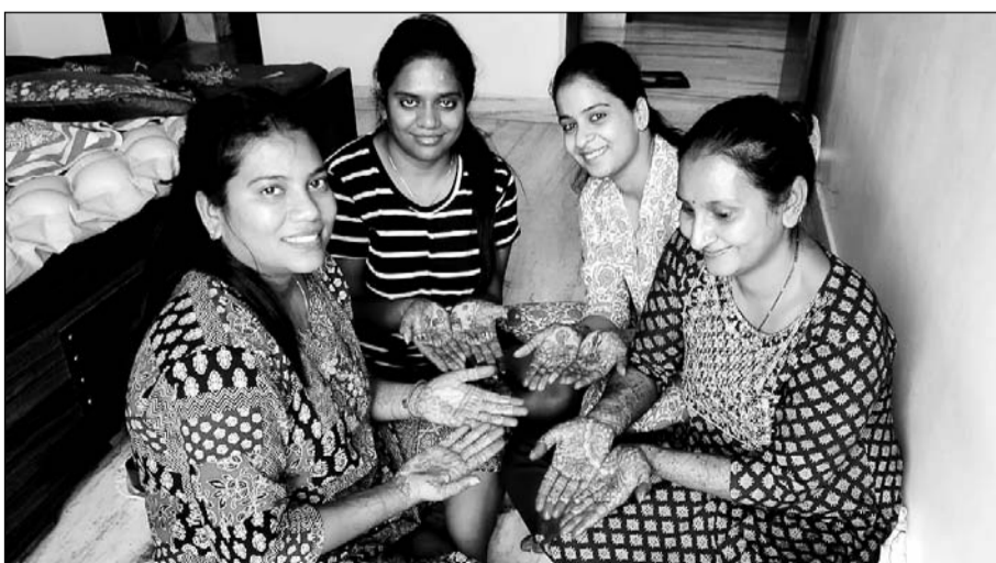
करवा चौथ पर्व को लेकर अपने घरों में हाथों पर मेहन्दी बनाती युवतियां।

करवा चौथ 20 अक्टूबर को आ रही है। करवा चौथ से 1 दिन पहले से सभी सुहागिनें मेहन्दी लगावाती हैं। करवा पूजन सामग्री के साथ ही अपनी शॉपिंग करती हैं। मैने भी अपनी शॉपिंग की है। करवा चौथ की सुबह सगरी लेकर पूरे दिन निराहार व्रत रखकर चांद को अर्घ्य देकर अपना व्रत खोलते हैं। पहले पति से पानी पीकर उसके बाद भोजन करते हैं। हमारी सनातन संस्कृति में करवा चौथ का काफी महत्व और सभी सुहागिन महिलाएं इसे पूरे मन से करती हैं। बाजार में करवा चौथ के लिए शॉपिंग