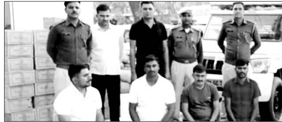
नोखा पुलिस ने अवैध शराब सहित चार जनों को पकड़ा।