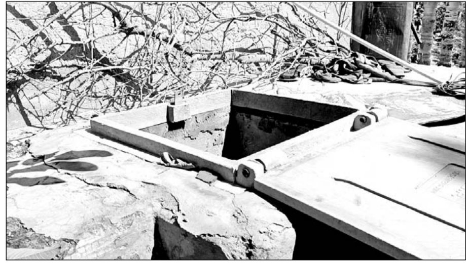
घर में बना हुआ पानी का होद, जिसमें बच्ची का शव मिला।