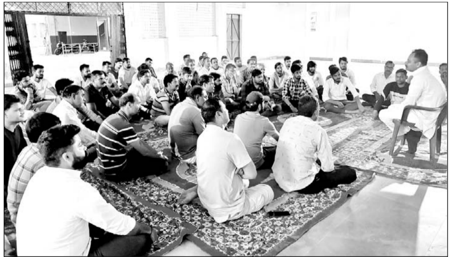
राजसमंद शहर सहित ग्रामीण क्षेत्रों में निरंतर बैठकों का दौर जारी।

राजसमंद, । हिन्दू नववर्ष समारोह समिति राजसमंद की ओर से रविवार 30 मार्च को बालकृष्ण स्टेडियम कांकोली में प्रातः 11 बजे विराट धर्मसभा एवं शोभायात्रा कार्यक्रम का आयोजन होगा। आयोजन में 21. मंगल कलश, पूज्य सन्तो व महंतों का साहित्य, देवी-देवताओं व महापुरुषों की झांकिया, हाथी, ऊंट, घोड़े से सुसज्जित डीजे दल के साथ शोभायात्रा, तीन किलोमीटर लंबी ऑयल पेंट रंगोली, मातृशक्ति का डांडिया रास, युवाशक्ति, सज्जनशक्ति के साथ सम्पूर्ण हिन्दू समाज शोभायात्रा में शामिल होगा। समिति के प्रचार-प्रसार प्रमुख ने बताया कि शरीर क्षेत्र उपनगर धोईदा में तरुणी बैठक आयोजित कर शोभायात्रा में बालिकाओं द्वारा नासिक दियो वादन, योगाभक्त के प्रयोग, शंखनाद ध्वनि, शिव गर्जना व विशेष रूप से भगवा ध्वज वाहिनी बनाने व उसमें अधिक से अधिक बालिकाओं को जोड़ने का निर्णय हुआ। राजनगर सदर बाजार स्थित माहेश्वरी भवन में हिन्दू नववर्ष को लेकर सैकड़ों कार्यकर्ताओं के साथ बैठक आयोजित की गई। जिसमें युवाओं ने धर्मसभा के आयोजन की व्यवस्थाओं पर चर्चा की। साथ ही गृह संपर्क अभियान के तहत