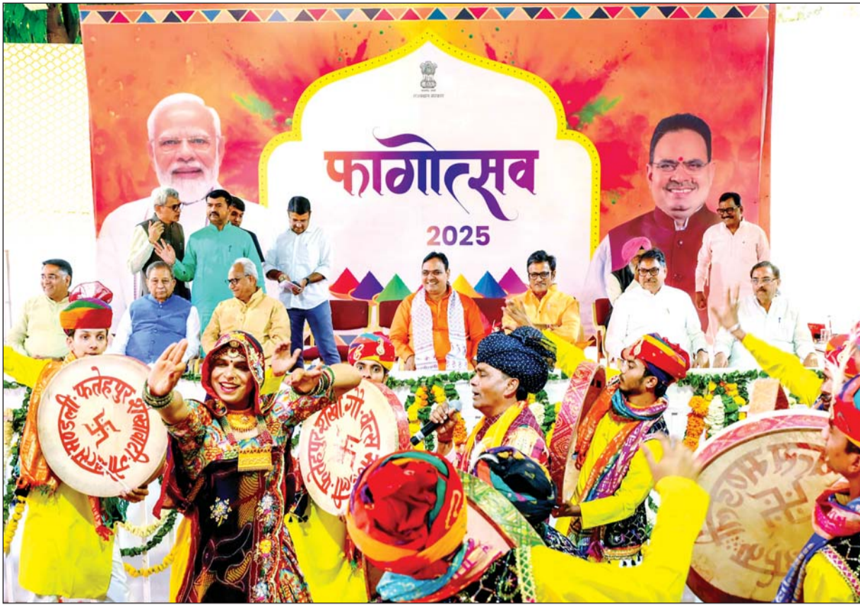
मुख्यमंत्री निवास पर रविवार को फागोत्सव कार्यक्रम में विभिन्न जिलों से आए भाजपा कार्यकर्ताओं और किसानों ने मुख्यमंत्री भजनलाल शर्मा को होली की शुभकामनाएं दीं और बजट घोषणाओं के लिए धन्यवाद दिया। इस अवसर पर ढप एवं चंग के साथ शेखावाटी के कलाकारों की प्रस्तुति ने माहौल को खुशनुमा बना दिया।