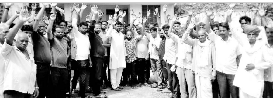
आरोपियों को गिरफ्तार करने की मांग को लेकर प्रदर्शन करते ग्रामीण व परिजन।

सुसाइड नोट में रुपयों के लेन-देन को लेकर कुछ लोगों के नाम लिखे हुए थे। परिवारजनों ने शव का पोस्टमार्टम करने से पूर्व आरोपियों को गिरफ्तार करने व मुआवजा दिलवाने की मांग की। करीब 5 बजे पुलिस ने मामले की जांच कर आरोपियों गिरफ्तार करने का आश्वासन दिया। इसके बाद परिजन पोस्टमार्टम करवाने पर सहमत हो गए। थानाधिकारी के अनुसार उस समय घर पर मृतक व