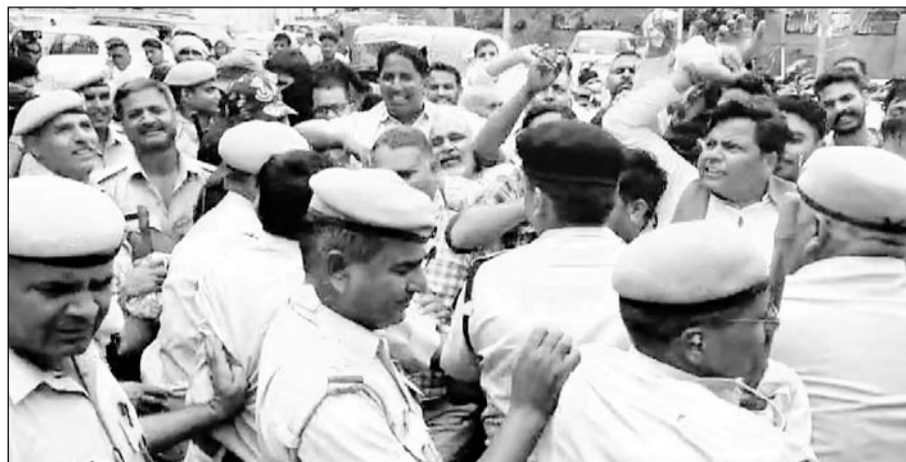
एडीएम को ज्ञापन देने के दौरान भाजपाइयों की पुलिस से धक्कामुक्की हो गई।