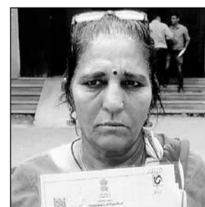
फर्जी मृत्यु प्रमाणपत्र दिखाती बहन।