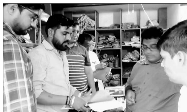
दुकान पर पॉलिथिन बरामदगी की कार्रवाई करते अधिकारी