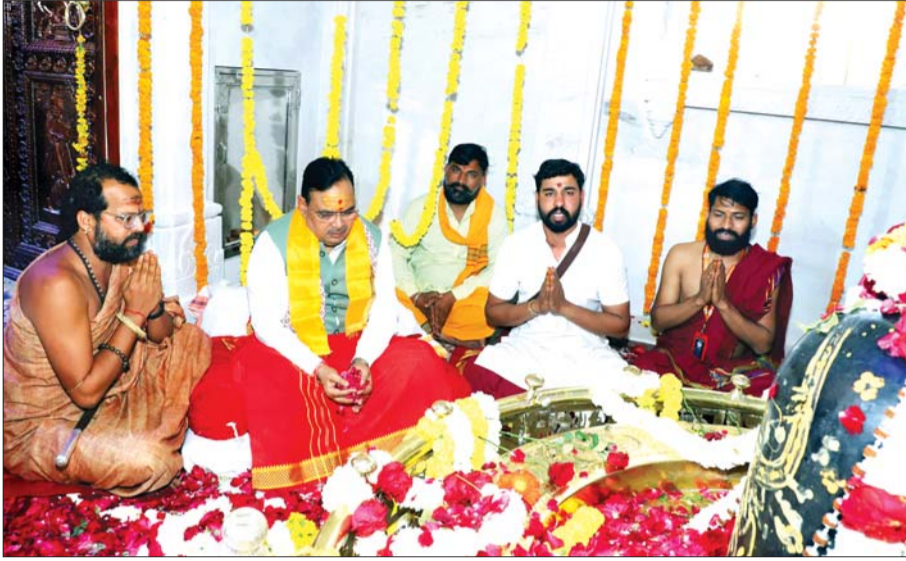
मुख्यमंत्री भजनलाल शर्मा ने चित्तौड़गढ़ के मातृकुंडिया के श्री पशुपतिनाथ महादेव मंदिर मूर्ति प्राण प्रतिष्ठा समारोह को संबोधित किया तथा मंदिर में पूजा-अर्चना की।