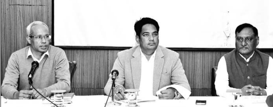
सामाजिक न्याय एवं अधिकारिता मंत्री सामाजिक न्याय एवं अधिकारिता मंत्री अविनाश गहलोत ने विभाग जिलावार समीक्षा बैठक ली।

वजट आवंटित हुआ था, इसमें से 85 प्रतिशत की राशि विभिन्न योजनाओं पर खर्च की जा चुकी है। उन्होंने कहा कि शेष बची राशि को भी आगामी 2 महीने में खर्च कर ली जाएगी। सामाजिक न्याय मंत्री ने कहा कि नशा मुक्तसमाज का निर्माण ही केंद्र और राज्य सरकार की प्राथमिकता है।