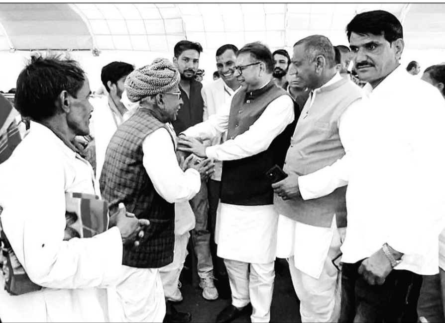
अखिल मेवाड़ क्षेत्र जाट समाज महासभा संस्थान द्वारा चित्तौड़गढ़ के मातृकुण्डिया में नवनिर्मित श्री पशुपतिनाथ महादेवजी मंदिर के प्राण प्रतिष्ठा कार्यक्रम में भाजपा हरियाणा प्रभारी, भाजपा राजस्थान पूर्व प्रदेशाध्यक्ष डॉ. सतीश पूनिया शामिल हुए।

जयपुर। अखिल मेवाड़ क्षेत्र जाट समाज महासभा संस्थान द्वारा चित्तौड़गढ़ के मातृकुण्डिया में नवनिर्मित श्री पशुपतिनाथ महादेवजी मंदिर के प्राण प्रतिष्ठा कार्यक्रम में भाजपा हरियाणा प्रभारी, भाजपा राजस्थान पूर्व