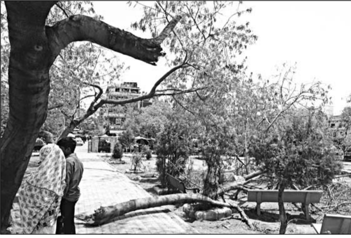
राजधानी जयपुर में शनिवार देर शाम आए तेज अंधड़ के कारण मुख्य सड़कों, पार्कों और विद्युत लाइनों पर पेड़ टूटकर गिर गए। अंधड़ के कारण प्रभावित हुई विद्युत सप्लाय को सुचारु करने के लिए जयपुर डिस्कॉम की टीम रविवार देर शाम तक जुटी रही।