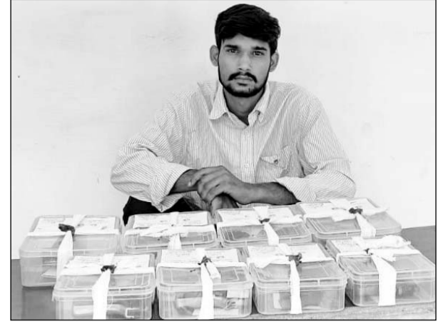
चंदवाजी थाना पुलिस ने अवैध हथियारों के साथ आरोपी को पकड़ा।