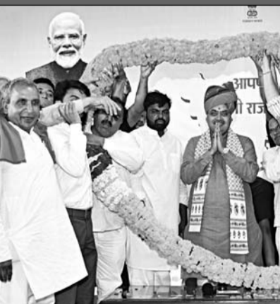
मुख्यमंत्री भजनलाल शर्मा का उनके निवास पर ओड समाज के लोगों ने स्वागत किया।

कार्यक्रम के दौरान मुख्यमंत्री ने पाक विस्थापित ओड समाज के लोगों की हरसंभव सहायता का आश्वासन देते हुए कहा कि राज्य सरकार उनके सामाजिक और शैक्षिक विकास के लिए प्रतिबद्ध है। मुख्यमंत्री ने प्रदेश सरकार द्वारा पेयजल और सिंचाई परियोजनाओं पर किए जा रहे कार्यों का उल्लेख करते हुए कहा कि किसानों