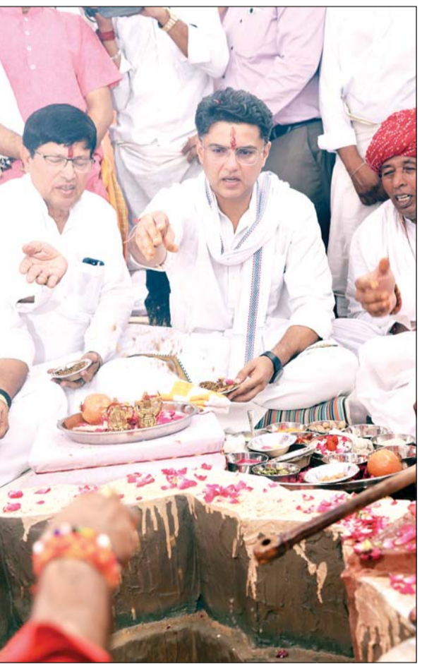
कांग्रेस महासचिव व पूर्व उपमुख्यमंत्री सचिन पायलट ने रविवार को श्री बैकुंठ धाम बरनाघर आसीन्द में आयोजित भगवान देवनारायण के 51 कुंडीय विष्णु महायज्ञ एवं मूर्ति प्राण प्रतिष्ठा महोत्सव में शिरकत की।

पायलट ने कहा कि, जो जनप्रतिनिधि हैं, वो चाहे जीतें या हारें, सत्ता में हों या विपक्ष में हों, उन्हें हमेशा ईमानदारी के साथ जनता के बीच में रहकर, जन-भावनाओं को सुनकर उसके आधार पर काम करना चाहिए। जनता जिनको विधायक-सांसद चुनती है, उन्हें भी पूरे क्षेत्र के 100 प्रतिशत