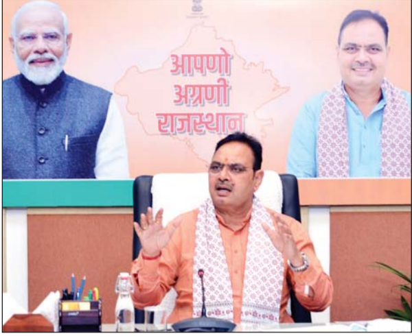
मुख्यमंत्री भजनलाल शर्मा ने रविवार को मुख्यमंत्री निवास पर वन विभाग की बैठक ली।

के साथ-साथ किसानों की आय में वृद्धि के लिए राज्य सरकार किसानों को फलदार पौधे उपलब्ध करवाएगी। ऐसे में वन विभाग फलदार पौधों के वितरण की भी योजना बनाए। उन्होंने पहाड़ी एवं वन क्षेत्रों में ड्रोन सीडिंग एवं अरावली क्षेत्र में सघन वृक्षारोपण के भी निर्देश दिए।