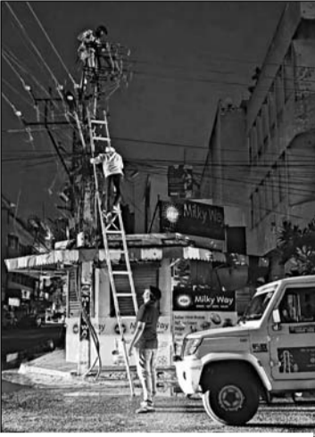
राजधानी जयपुर में शनिवार देर शाम आए तेज अंधड़ के कारण मुख्य सड़कों, पार्कों और विद्युत लाइनों पर पेड़ टूटकर गिर गए। अंधड़ के कारण प्रभावित हुई विद्युत सप्लाय को सुचारु करने के लिए जयपुर डिस्कॉम की टीम रविवार देर शाम तक जुटी रही।

1295 पोल को रविवार दोपहर तक दुरुस्त कर लिया गया था। इसी तरह 11 केवी के 423 फीडरों तथा 33 केवी के 12 फीडरों से विद्युत आपूर्ति में व्यवधान आया, जिनमें से 11 केवी के 396 फीडरों तथा 33 केवी के प्रभावित सभी 12 फीडरों में आपूर्ति बहाल कर दी गई है। तुफान का जयपुर जोन के जयपुर जिला दक्षिण एवं उत्तर सर्किल सहित दौसा, टोंक एवं कोटपुतली सर्किल में भी असर रहा। जयपुर जोन में कुल 433 वितरण ट्रांसफार्मरों को क्षति पहुंची। रविवार दोपहर तक इनमें से 305 ट्रांसफार्मरों को सुचारु कर दिया गया था जोन में 2351 विद्युत पोल क्षतिग्रस्त हुए। इनमें से 1711 विद्युत पोल दुरुस्त कर दिए गए थे। वहीं