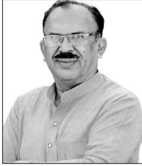
राजस्थान विधानसभा अध्यक्ष वासुदेव देवनानी

सिडनी (ऑस्ट्रेलिया) में आयोजित राष्ट्र मण्डल संसदीय संघ के 67वें सम्मेलन में विधानसभा अध्यक्ष वासुदेव देवनानी ने शिरकत की