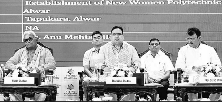
एजुकेशन प्री समिट कार्यक्रम में मुख्यमंत्री भजनलाल शर्मा, उप मुख्यमंत्री प्रेमचंद बैराव, शिक्षा एवं पंचायती राज मंत्री मदन दिलावर, कौशल नियोजन उद्यमिता विभाग, युवा एवं खेल विभाग मंत्री कर्नल राज्यवर्धन सिंह राठौड़ मौजूद रहे।

जयपुरा कभी मरूपी के रूप में पहचान रखने वाला हमारा राजस्थान निरंतर प्रगति, समृद्धि और उन्नति के पथ पर निरंतर आगे बढ़ रहा है। राज्य के सामाजिक-आर्थिक विकास और जनता के हितोत्तरीय राज्जिग राजस्थान जैसा ऐतिहासिक एवं अभूतपूर्व आयोजन आयोजित होने जा रहा है। इसके पूर्व प्रदेश की शिक्षा में नवनिर्माण का मार्ग प्रशस्त करने, सकारात्मक परिवर्तन, राष्ट्रीय शिक्षा नीति के विभिन्न उद्देश्यों को साकार करने और शिक्षा के क्षेत्र में निवेश की दिशा में 6 नवंबर को होटल इंटरकॉन्टिनेंटल, टॉक रोड, जयपुर में एजुकेशन प्री-समिट 2024 का आयोजन किया गया। उच्च शिक्षा, स्कूल शिक्षा, संस्कृत शिक्षा, तकनीकी शिक्षा, कौशल एवं उद्यमिता विभाग तथा खेल एवं युवा मामलात के संयुक्त तत्वावधान में आयोजित यह सम्मेलन न केवल शिक्षा क्षेत्र के भामाशाह, दानदाता, और हितधारकों को एक साथ लाएगा, बल्कि शिक्षा के भविष्य के विकास हेतु रणनीतियों और नवाचारों पर विचार-विमर्श का एक महत्वपूर्ण मंच भी प्रदान करेगा। कार्यक्रम में मुख्यमंत्री भजनलाल शर्मा, उप मुख्यमंत्री प्रेमचंद बैराव, शिक्षा एवं पंचायती राज मंत्री मदन दिलावर, कौशल नियोजन उद्यमिता विभाग, युवा एवं खेल विभाग मंत्री कर्नल राज्यवर्धन सिंह राठौड़ मौजूद रहे।