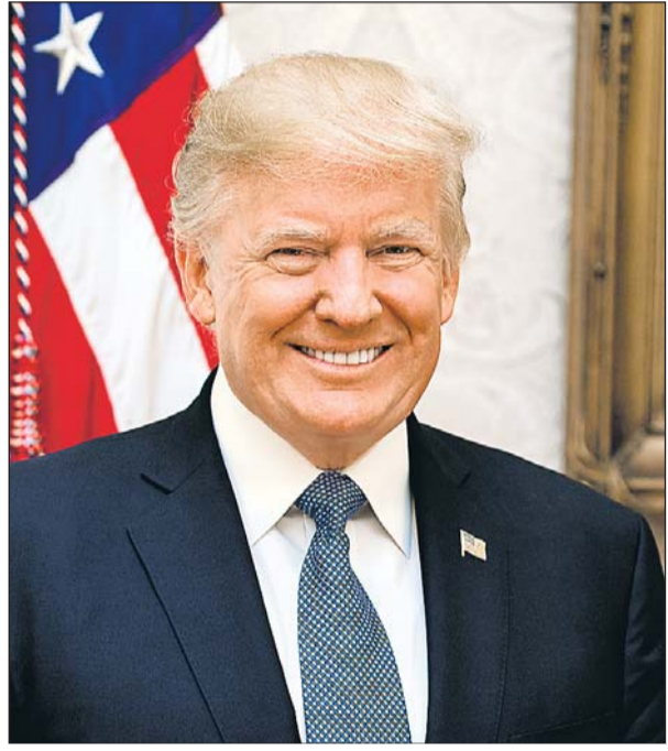
डॉनल्ड ट्रम्प की जीत ने अमेरिका के बुद्धिजीवियों व पत्रकारों को निरुत्तर कर दिया।

अर्थव्यवस्था सबसे अच्छा प्रदर्शन कर रही थी तथा ऊंची ब्याज दरों के बावजूद, जानी-मानी पत्रिका "द इकॉनमिस्ट" ने उसकी प्रशंसा की "ग्रैविटी डिफेंस एक्सपीरिएंस" कहा था। एक बड़ी अर्थव्यवस्था के रूप में वर्षों तक