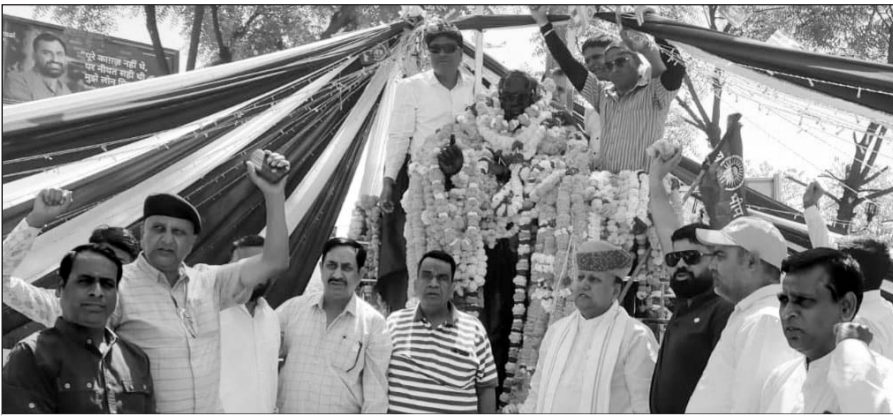
अंबेडकर सँकलित स्थित उनकी प्रतिमा पर माल्यार्पण कर उन्हें श्रद्धांजलि अर्पित की गई तथा उनके महान कार्यों को स्मरण किया गया।

अजमेर, (कास)। पूरे देश में आज भारत रत्न डॉ. भीमराव अंबेडकर की जयंती बड़े ही हर्षोल्लास और श्रद्धा के साथ मनाई जा रही है। इसी कड़ी में अजमेर शहर में भी विभिन्न कार्यक्रम आयोजित किए गए। अंबेडकर सँकलित स्थित उनकी प्रतिमा पर माल्यार्पण कर उन्हें श्रद्धांजलि अर्पित की गई तथा उनके महान कार्यों को स्मरण किया गया। कार्यक्रम के दौरान वासुदेव देवनाणी एवं केंद्रीय मंत्री भागीरथ चौधरी सहित भाजपा के अनेक नेताओं और कार्यकर्ताओं ने अंबेडकर की प्रतिमा पर पुष्प अर्पित कर उन्हें नमन किया।