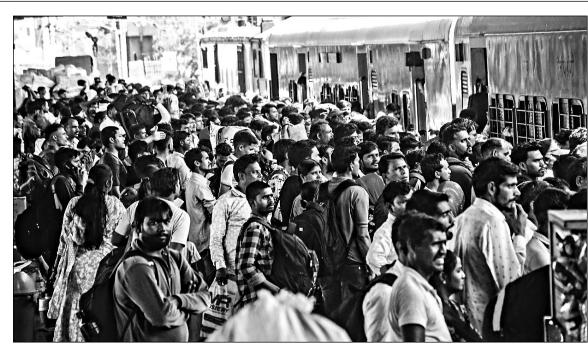
पश्चिमी बंगाल में इसी माह होने वाले चुनाव को देखते हुए जयपुर में रह रहे लोग वापस अपने प्रदेश लौटने लगे हैं। मंगलवार को जयपुर रेलवे स्टेशन पर यात्रियों की भारी भीड़ रही। हालात ऐसे थे कि ट्रेनों में सीटें मिलना तो दूर प्लेटफॉर्म पर खड़े होने की भी जगह नहीं थी।

है, जो हरियाणा और पंजाब के निवासी हैं। पुलिस आरोपियों के कब्जे से 29.850 किलो अवैध डोडा चूरा बरामद किया है। पुलिस ने बताया कि आरोपियों के नेटवर्क और अन्य संभावित साधियों के संबंध में जांच जारी है। साथ ही आमजन से अपील की गई है कि नशे के खिलाफ इस मुहिम में सहयोग करें और अवैध गतिविधियों की सूचना तुरंत पुलिस को दें।