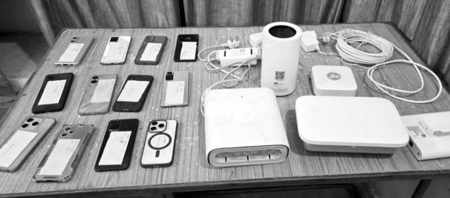
पुलिस ने आरोपियों के कब्जे से 12 मोबाइल फोन और 17 फर्जी सिम कार्ड बरामद किये।

डूंगरपुर, (निर्स)। जिला पुलिस ने सायबर अपराधियों के खिलाफ चलाए जा रहे विशेष अभियान ऑपरेशन सायबर हंट के तहत कार्यवाही करते पुलिस ने 6 सायबर ठगों को गिरफ्तार किया है। आरोपियों के कब्जे से पुलिस ने 12 मोबाइल फोन और 17 फर्जी सिम