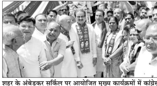
शहर के अंबेडकर सँकलित पर आयोजित मुख्य कार्यक्रमों में कांग्रेस नेताओं और कार्यकर्ताओं ने बाबा साहेब की प्रतिमा पर माल्यार्पण एवं पुष्पांजलि अर्पित कर उन्हें नमन किया।

अजमेर, (कास)। भारत रत्न एवं संविधान निर्माता बाबा साहेब डॉ. भीमराव अंबेडकर की जयंती पर अजमेर में कांग्रेसजनों द्वारा विभिन्न स्थानों पर श्रद्धांजलि कार्यक्रम आयोजित किए गए। शहर के अंबेडकर सँकलित पर आयोजित मुख्य कार्यक्रमों में कांग्रेस नेताओं और कार्यकर्ताओं ने बाबा साहेब की प्रतिमा पर माल्यार्पण एवं पुष्पांजलि अर्पित कर उन्हें नमन किया।