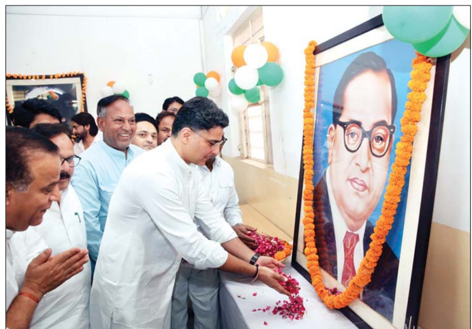
कांग्रेस के राष्ट्रीय महासचिव एवं पूर्व उपमुख्यमंत्री सचिन पायलट मंगलवार को प्रदेश कांग्रेस मुख्यालय में बाबा साहेब की जयंती पर आयोजित पुष्पांजलि कार्यक्रम में शामिल हुए।

और जनगणना जैसे मुद्दों पर पारदर्शिता बनाए रखने के लिए सर्वदलीय बैठक बुलाई जानी चाहिए।