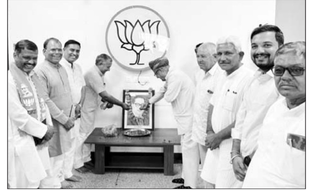
अंबेडकर जयंती पर भाजपा कार्यालय अजमेर में संगोष्ठी का आयोजन हुआ।

अजमेर, (निर्स)। भारतीय जनता पार्टी अजमेर देहात द्वारा समरसता दिवस के अवसर पर बाबा साहेब डॉ. भीमराव अंबेडकर की जयंती पर भाजपा कार्यालय अजमेर में संगोष्ठी का आयोजन किया गया। कार्यक्रम में बाबा साहेब के चित्र पर माल्यार्पण एवं दीप प्रज्वलन कर उन्हें श्रद्धांजलि अर्पित की गई।