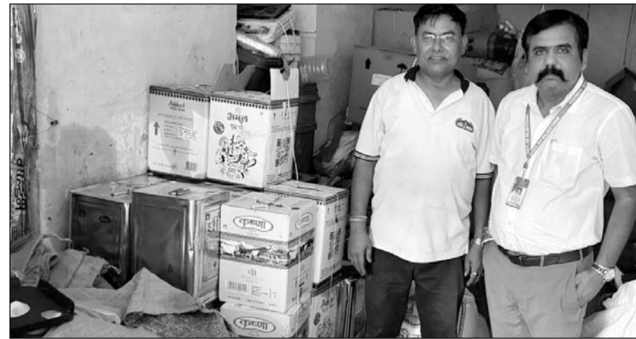
पाली शहर में डेयरी एंड जनरल स्टोर पर घी के नमूने लिये।