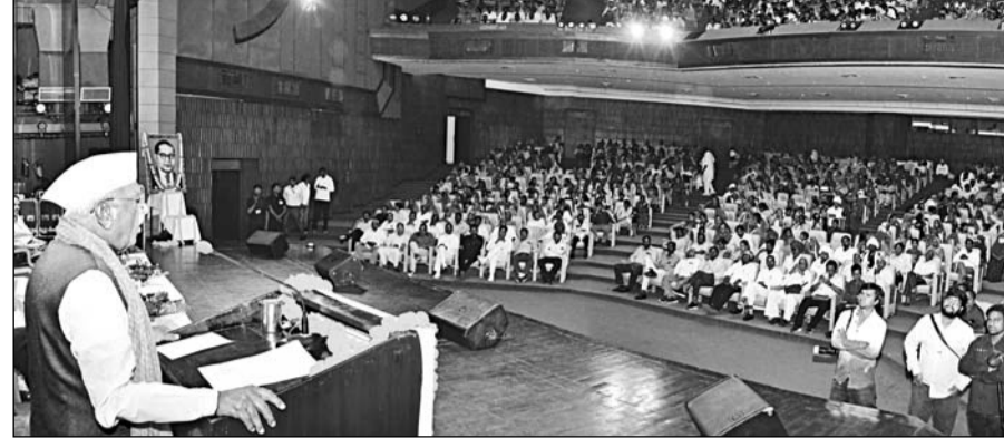
राज्यपाल हरिभाऊ बागडे ने डॉ. भीमराव अम्बेडकर की 135 वीं जयंती पर जयपुर में आयोजित समारोह में संबोधित किया।

डॉ. अम्बेडकर ने देश को सामाजिक समरसता का मंत्र ही नहीं दिया बल्कि राष्ट्र सर्वोच्च है, यह दृष्टि भी दी : हरिभाऊ बागडे