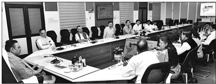
मुख्यमंत्री भजनलाल शर्मा ने मंगलवार को अपने आवास पर ऊर्जा विभाग की बैठक ली।

-कार्यालय संवाददाता- जयपुर । मुख्यमंत्री भजनलाल शर्मा ने कहा कि बेहतर प्रबंधन एवं दूरगामी निर्णयों के फलस्वरूप प्रदेश की विद्युत उत्पादन क्षमता में उल्लेखनीय वृद्धि दर्ज होने के साथ ही छीजत में कमी आई है। उन्होंने प्रदेश को ऊर्जा के क्षेत्र में आत्मनिर्भर बनाते हुए कृषि एवं घरेलू उपभोक्ताओं तथा उद्योगों को निर्बाध एवं पर्याप्त बिजली सुनिश्चित करने के निर्देश दिए। शर्मा मंगलवार को मुख्यमंत्री निवास पर आयोजित ऊर्जा विभाग की बैठक की अध्यक्षता कर रहे थे।