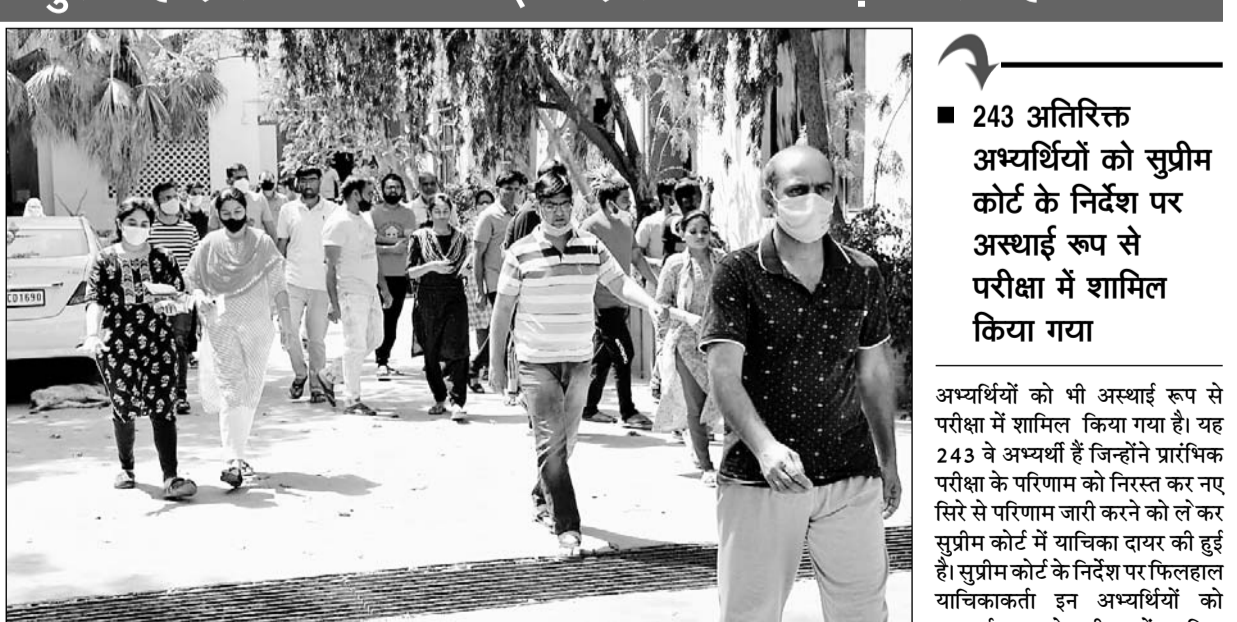
अजमेर के एक परीक्षा केन्द्र से परीक्षा देकर लौटते अभ्यर्थी।

अजमेर, (कास)। राजस्थान लोक सेवा आयोग द्वारा राजस्थान राज्य एवं अधीनस्थ सेवाएं संयुक्त प्रतियोगी (मुख्य) परीक्षा, 2021 रविवार को 9 बजे से दोपहर 12 बजे तक एवं दोपहर 2 बजे से सांय 5 बजे तक दो सत्रों में राज्य के समस्त संभागीय जिला मुख्यालयों पर शांतिपूर्ण आयोजित की गई। जिला कन्ट्रोल रूम से दूरभाष पर प्राप्त सूचना अनुसार सामान्य अध्ययन-प्रथम में अजमेर में 2450, भरतपुर 1784, बीकानेर 2086, जयपुर 6494, जोधपुर 3616, कोटा 621, उदयपुर 1083 एवं सामान्य अध्ययन-द्वितीय में अजमेर में 2435, भरतपुर 1773, बीकानेर 2075, जयपुर 6419, जोधपुर 3585, कोटा 621, उदयपुर 1076 अभ्यर्थी उपस्थित हुये। सामान्य अध्ययन-प्रथम में उपस्थित 89.01 प्रतिशत एवं सामान्य अध्ययन-द्वितीय में प्रतिशत 88.28 प्रतिशत रही। परीक्षा देकर लोटे अभ्यर्थियों ने बताया कि सिलेबस के अनुसार ही प्रश्न पत्र आया कोई भी प्रश्न