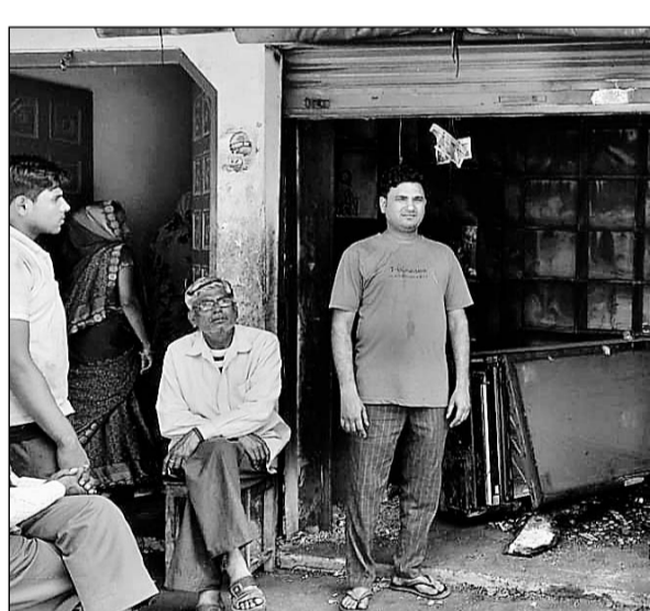
ग्राम बहादुरपुर कस्बे की दुकान में जला पड़ा सामान।

संदर्भ में पुलिस थाना सदर में रिपोर्ट भी दर्ज कराई गई है और प्रशासन को भी सूचित किया गया है। ग्राम