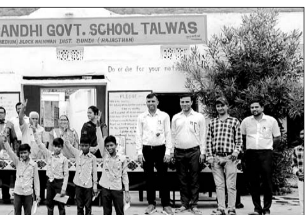
68वीं जिला स्तरीय तैराकी प्रतियोगिता में उत्कृष्ट प्रदर्शन करने वाले महात्मा गांधी राजकीय विद्यालय तलवास के छात्रों को प्रोत्साहन राशि प्रदान कर सम्मानित किया गया।

व्यक्तियों द्वारा बच्चों की हैसला-अफेजई से नवीन ऊर्जा का संचार हुआ है। इन्होंने कहा कि विद्यालय की खेल प्रतिभाएं निश्चित ही राज्य स्तर पर भी इसी तरह अपने परिवार और गांव का नाम रोशन करेंगी।