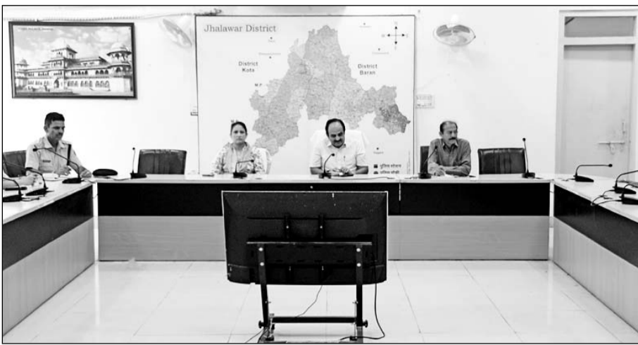
जिला कलेक्टर ने आगामी त्यौहारों पर शांति एवं कानून व्यवस्था के संबंध में बैठक ली।

बैठक में जिला कलेक्टर ने कहा कि आगामी दिनों में बारावकात, जलझूलनी एकादशी एवं अनन्त चतुदशी जैसे बड़े त्यौहार मनाए जाएंगे जिन पर बड़ी संख्या में आमजन द्वारा एकत्रित होकर जुलूस निकाला जाता है। उन्होंने कहा कि शांति समिति के सभी सदस्य जिला एवं पुलिस प्रशासन की महत्वपूर्ण कड़ी हैं। उक्त समिति के माध्यम से जिला एवं पुलिस प्रशासन को सम्बल एवं आत्मविश्वास के साथ किसी भी अनैतिक घटना का निस्तारण करने में सहयोग मिलता है। उन्होंने सभी सदस्यों से कहा कि जिले में किसी भी क्षेत्र में होने वाली अग्रिम घटना जिससे जिले में सामाजिक सौहार्द बिगड़ने की स्थिति हो ऐसी घटना की सूचना जिला एवं पुलिस प्रशासन को अविलम्ब दें। उन्होंने कहा कि सभी समिति के सदस्य जिस भी व्हेटिंग पत्र पर हस्ताक्षर करते हैं, उनमें ज्यादा