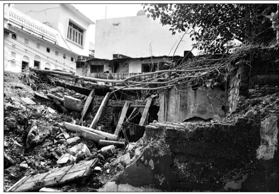
देवली शहर के बीचों-बीच जर्जर अवस्था में खड़े भवन हादसे को न्यौता दे रहे हैं।