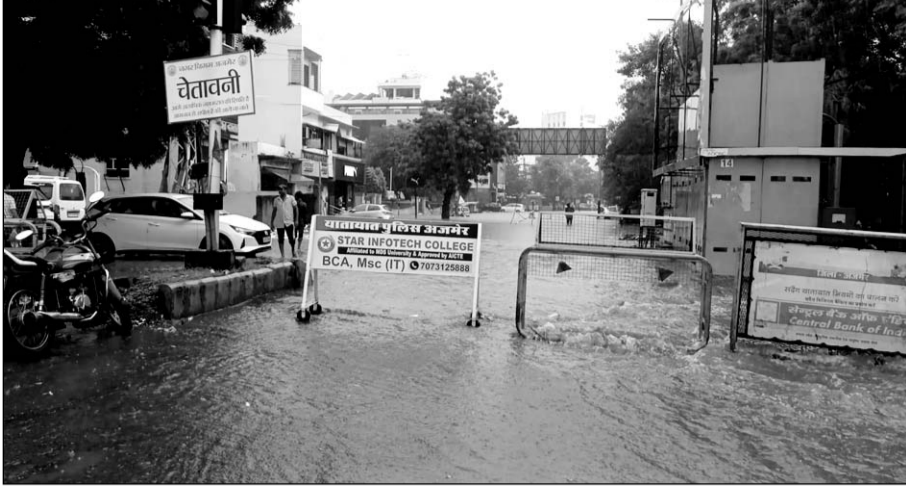
अजमेर में फिर से हुई बरसात से कई जगहों पर जलभराव हो गया।

अजमेर, (कांस)। अजमेर शहर में तीन दिन बाद मंगलवार को फिर से हुई तेज बारिश के बाद स्मार्ट सिटी अजमेर की जानमाल की सुरक्षा का पूरा जिम्मा अब रेत से भरे कट्टों पर आ गया है, लेकिन बरसात इतनी तेज थी कि हाथीभाटा पावर हाउस वाली रोड पर लगाए गए रेत के कट्टे भी बरसाती पानी को नहीं रोक पाए और पानी कट्टों के ऊपर से होता हुआ निकल गया, जिसके कारण हाथीभाटा पावर हाउस में कमर तक पानी भर गया तो वही आनासागर स्कूप चैनल से चल रही चादर से बेकाबू हो रहे पानी को थामे रखने के लिए केसरबाग पुलिस चौकी से महावीर सिकल तक के रास्ते पर आवागमन रोक दिया गया।