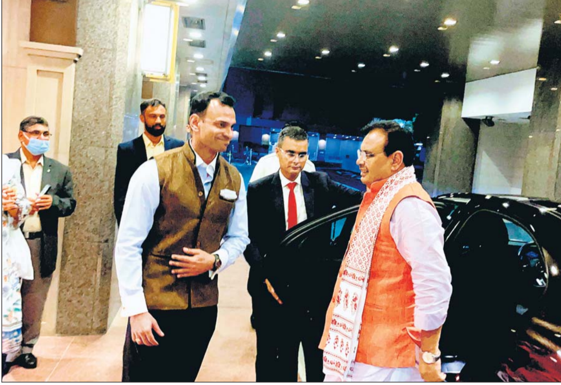
मुख्यमंत्री भजनलाल शर्मा के नेतृत्व में प्रदेश सरकार का प्रतिनिधिमंडल मंगलवार को सियोल (कोरिया) पहुँचा। सियोल में कोरियन स्टोन एसोसिएशन के प्रतिनिधियों ने मुख्यमंत्री का स्वागत किया। मुख्यमंत्री की कोरियन स्टोन एसोसिएशन के व्यापारियों एवं प्रतिनिधियों के साथ राज्घट टैबल वार्ता हुई।