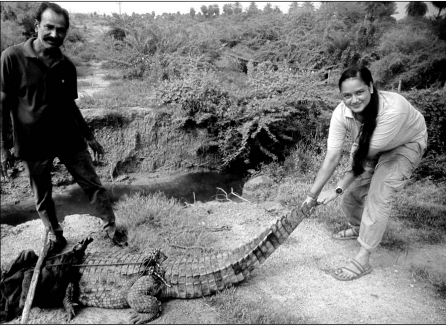
कोटा के कई इलाकों से वन विभाग की टीम मगरमच्छों को रेस्क्यू करके सुरक्षित स्थान पर छोड़ रही है।

इसके अलावा कोटा शहर के बोरखेड़ा में पुलिस थाने के नजदीक खाली प्लांट में भी एक 6 फीट लंबा