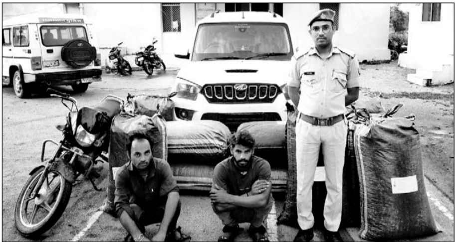
पारसोली थाना पुलिस ने अवैध अफीम एवं डोडा-चूरा जब्त कर दो जनों को गिरफ्त में लिया।

रावतभाटा, (निसं)। पारसोली थाना पुलिस ने कार्यवाही करते हुए करीब 10 लाख रुपए मूल्य से अधिक का 229 किलो 680 ग्राम अवैध अफीम डोडाचूरा जब्त किया है। एस्कॉर्टिंग करते दो आरोपी गिरफ्तार तथा एक कार एवं एक मोटरसाइकिल भी जब्त की गई है।