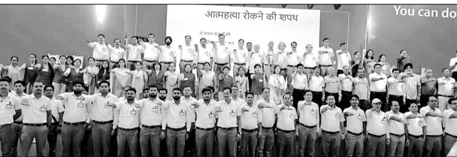
कोटा में आत्महत्या रोकने के लिए प्रयास करने की शपथ दिलाई गई।

कोटा, (निसं)। अफिनिटी हॉस्पिटल की ओर से जन जागृति अभियान के दौरान लोगों को मानसिक रोग के प्रति लगातार जागरूक किया जा रहा है। मंगलवार को अफिनिटी हॉस्पिटल, तलवंडी चौराहा द्वारा अंतरराष्ट्रीय आत्महत्या रोकथाम दिवस मनाया गया और साथ ही आत्महत्या के रोकथाम के विषय पर एक वर्कशॉप का आयोजन किया गया।