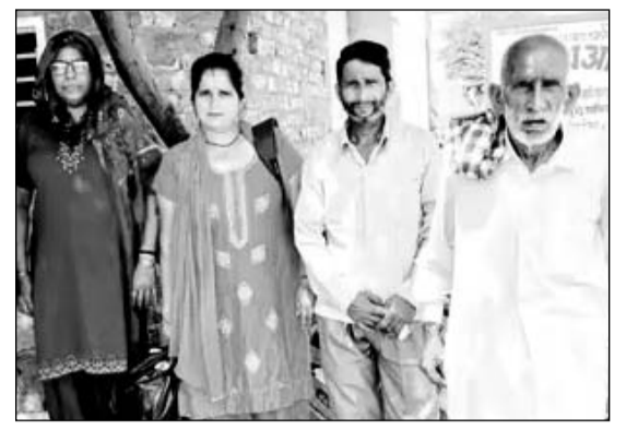
वीडियो फेसबुक पर डाली तो बुजुर्ग व्यक्ति को लेने उनका बेटा, बेटी और बहू ऋषिकेश से पहुंचे।