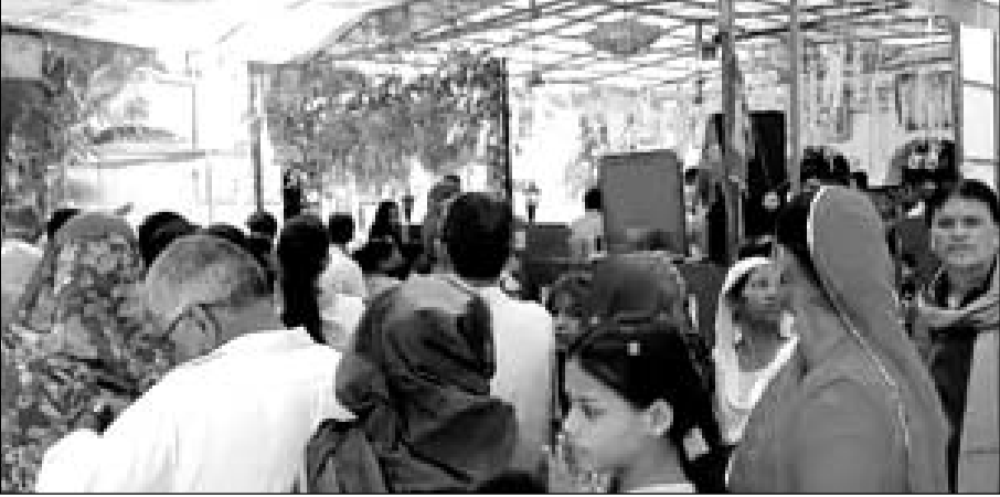
श्रीगंगानगर में सूरतगढ़ रोड स्थित लोक देवता बाबा रामदेव के मेले में श्रद्धालुओं की भीड़ उमड़ी।

मंदिर कैम्पस में चितलांगिया ट्रस्ट की ओर से लंगर लगाया गया। इसमें बड़ी संख्या में ग्रामीण अंचल से आए लोगों ने प्रसाद ग्रहण किया। वहीं मंदिर के बाहर