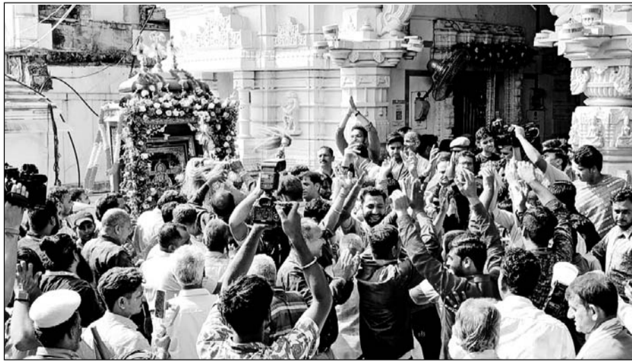
मंडफिया में बैवाण यात्रा की भक्तजननों ने अगवानी की।

शोभायात्रा में सजे-धजे घोड़े, ऊंट व हाथी श्रद्धालुओं के लिए आकर्षण का केंद्र रहे। इन पर केसरिया पोशाकों में बैठे पुजारी द्वारा चारों ओर गुलाल उड़ते हुए चल रहे थे। शोभायात्रा में विभिन्न बैंड बाजे, डीजे, ढोल, मांडल एवं हारमोनियम की मधुर धुनों में भक्त नाचते गाते भगवान सांवलिया सेठ के जयकांठे लगाते हुए चल रहे थे। इस मौके पर सर्वत्र वातावरण कृष्ण भक्ति में ओत-प्रोत हो गया। इस शोभायात्रा में कस्बे के विभिन्न विद्यालयों की देव रूपी