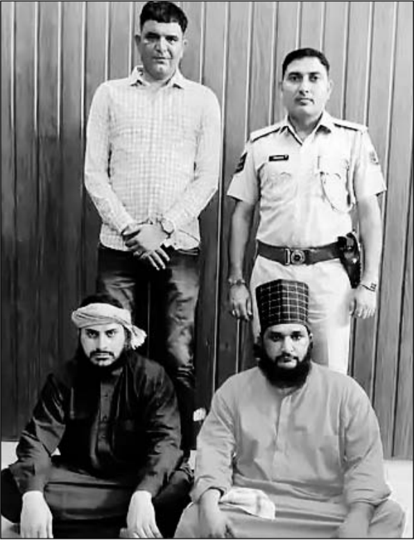
ठगी के आरोप में दो मौलवियों को गिरफ्तार किया।