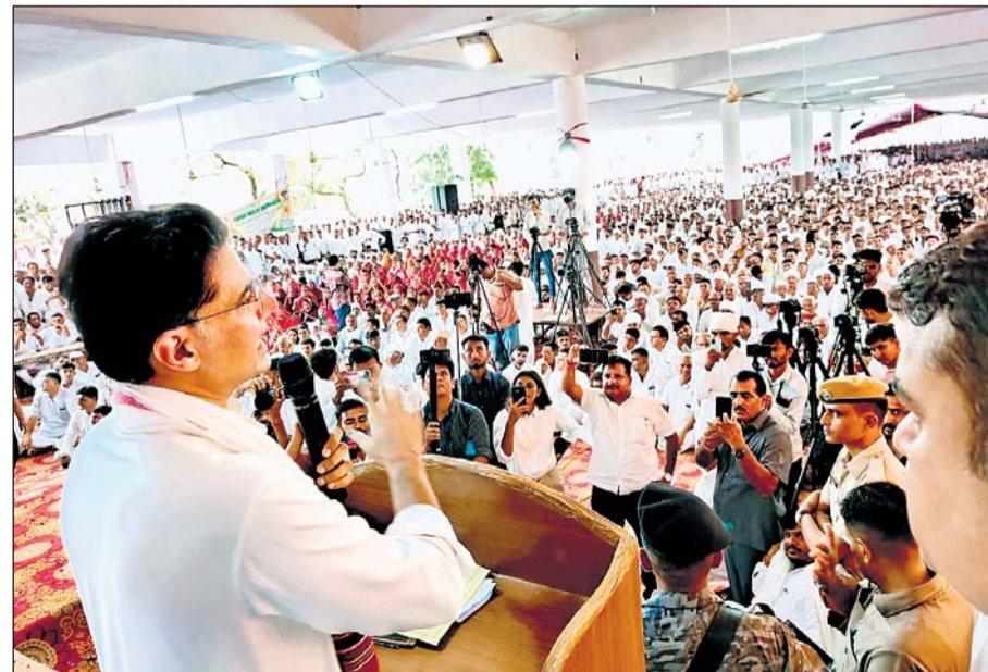
जोधपुर में खेजड़ली मेले में शामिल हुये कांग्रेस के राष्ट्रीय महासचिव सचिन पायलट का विश्वनोई समाज ने अपने परम्परागत अंदाज़ में स्वागत किया। पायलट ने मेले में सम्मिलित हजारों लोगों की भीड़ को संबोधित करते हुये कहा, हमें समाज और पर्यावरण की रक्षा करनी होगी, नई पीढ़ी को अपने सिद्धांतों और उसूलों की शिक्षा देनी होगी। उन्होंने कहा कि अपने घरवालों और मातृभूमि के लिए हर कोई शहादत देने के लिए तैयार रहता है लेकिन पर्यावरण, जंगल-जानवर के लिए अपनी जान हथेली पर रखकर कोई चला है तो वह विश्वनोई समाज ही है।

कांग्रेस महासचिव ने कहा कि समाज के विरुद्ध और हित में षडयंत्र और साजिश भी रची जाती हैं, उससे हमें सावधान रहना पड़ेगा। पायलट ने कहा कि मैं आपको विश्वास दिलाता हूँ, कुर्बानी देने वाले इस काश्तकार और (शेष अंतिम पृष्ठ पर)