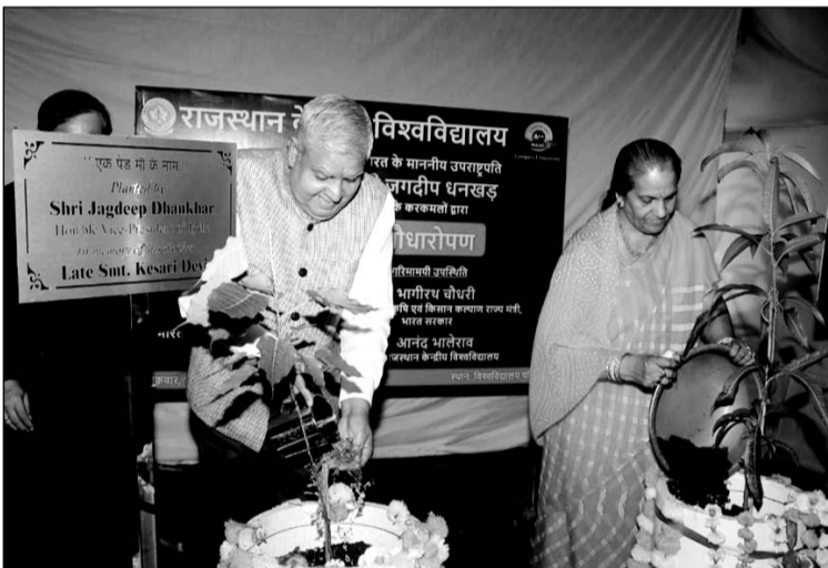
किशनगढ़ स्थित केंद्रीय विश्वविद्यालय में उपराष्ट्रपति जगदीप धनखड़ ने सपत्नीक अपनी मां के नाम पौधारोपण किया।