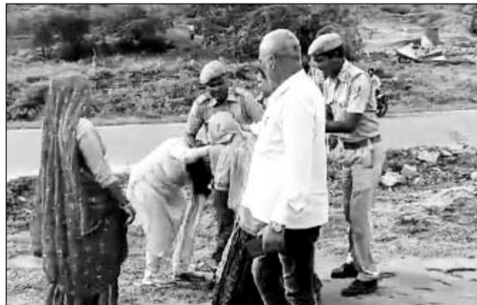
महिला उप जिला कलेक्टर के बाल पकड़कर उलझती एक ग्रामीण महिला।

अतिक्रमण हटाने की कार्यवाही के दौरान ही प्रशासन और मौके पर मौजूद लोगों को नखीरों किता तो आपस में कहासुनी हो गई। इस बात को तूल नहीं दिया जाए वहीं दूसरे पक्ष का कहना है कि प्रशासन जिसे अतिक्रमण बतारक कार्यवाही करने पहुंचा है वह खातेदारी की जमीन है। जो वीडियो