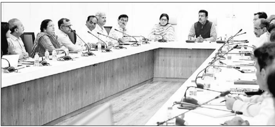
सूचना प्रौद्योगिकी एवं संचार मंत्री कर्नल राज्यवर्धन राठौड़ ने भामाशाह डेटा सेंटर में विभाग के वरिष्ठ अधिकारियों के साथ एक महत्वपूर्ण समीक्षा बैठक ली।

जयपुरा सूचना प्रौद्योगिकी एवं संचार मंत्री कर्नल राज्यवर्धन राठौड़ ने भामाशाह डेटा सेंटर में विभाग के वरिष्ठ अधिकारियों के साथ एक महत्वपूर्ण समीक्षा बैठक ली। इस बैठक में कैबिनेट मंत्री ने अधिकारियों को निर्दिष्ट किया कि वे आधुनिकतम तकनीक को अपनाकर प्रदेश के नागरिकों के लिए उच्च गुणवत्ता की सेवाएं तैयार करें, जिससे राजस्थान सूचना प्रौद्योगिकी के क्षेत्र में देश का अग्रणी राज्य बन सके। कर्नल राठौड़ ने सूचना प्रौद्योगिकी एवं संचार विभाग द्वारा संचालित विभिन्न परियोजनाओं की समीक्षा करते हुए अधिकारियों को संबोधित किया। उन्होंने निदेश दिया कि परिवर्तित बजट 2024-25 के तहत विभाग से संबंधित घोषणाओं का समर्थन और त्वरित निष्पादन सुनिश्चित किया जाए।