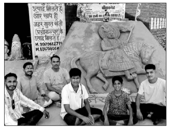
नंद आर्ट्स ग्रुप के तत्वावधान में बाबा रामदेव की घोड़े पर सवार प्रतिमा मिट्टी में उकेरी।