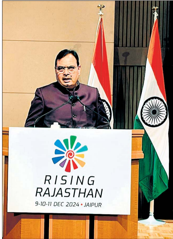
तीन दिवसीय यात्रा के अंतिम दिन मुख्यमंत्री भजनलाल शर्मा ने ओसाका (जापान) में आयोजित इन्वेस्टर्स मीट को संबोधित किया। मुख्यमंत्री के नेतृत्व वाले प्रतिनिधिमंडल ने जापान की विभिन्न कंपनियों से मुलाकात की और राजस्थान सरकार के प्रतिनिधिमंडल से (शेष अंतिम पृष्ठ पर)

दिया कि कंपनी की दीर्घकालिक योजनाओं में राजस्थान भी शामिल है। इसके अलावा, ओसाका में अनिवासी राजस्थानी समुदाय (एनआरआर) के लोगों ने भी राजस्थान सरकार के प्रतिनिधिमंडल से (शेष अंतिम पृष्ठ पर)