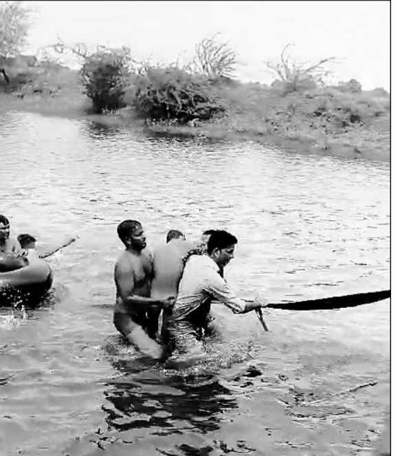
एएसडीएम और थाना प्रभारी ने मौके पहुंच रेस्क्यू टीम के साथ तीनों बच्चों के शव को बाहर निकाला।