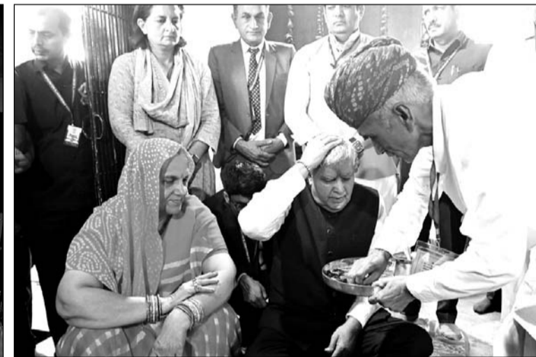
उपराष्ट्रपति जगदीप धनखड़ ने सपत्नीक खरनाल तेजाजी के मंदिर में वीर तेजाजी महाराज की पूजा-अर्चना की।