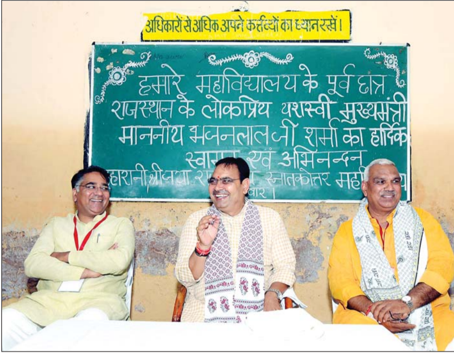
मुख्यमंत्री भजनलाल शर्मा गुरुवार को भरतपुर गए, वहां उन्होंने अन्त्योदय कल्याण समारोह को संबोधित किया। भरतपुर प्रवास के दौरान एम.एस.जे. महाविद्यालय, जहां के वे पूर्व छात्र हैं, में उनका भव्य स्वागत किया।

भरतपुर, 27 मार्च (निस)। गुरुवार को भरतपुर में राजस्थान दिवस कार्यक्रम के तहत आयोजित अन्त्योदय कल्याण समारोह को संबोधित करते हुए मुख्यमंत्री भजनलाल शर्मा ने कहा कि संभावनाओं और सामर्थ्य से भरा राजस्थान विकास की नई ऊंचाइयों छू रहा है तथा इस प्रगति का लाभ प्रदेश में गरीब व्यक्ति को मिल रहा है। अब अंतिम पायदान पर खड़ा व्यक्ति सशक्त होने के साथ ही मुख्यधारा में आ रहा है। उन्होंने कहा, राजस्थान दिवस उत्सव की श्रृंखला में आयोजित इस कार्यक्रम के माध्यम से अन्त्योदय का विचार ब्रज की भूमि से देश-प्रदेश तक पहुंचेगा। कांग्रेस तथा पूर्व मुख्यमंत्री अशोक गहलोत पर तीखा हमला बोलते हुए मुख्यमंत्री ने कहा कि कांग्रेस की सरकार टूटने के बाद ही, जबकि हम जमीन पर काम कर रहे हैं। उन्होंने कहा कि गहलोत सरकार के कार्यकाल में पेपर लीक घोटाले चरम पर थे, लेकिन उस वक्त मुख्यमंत्री के ओहदे पर बैठे गहलोत होटलों में बैठकर सत्ता बचाने की राजनीति कर रहे थे। उन्होंने पेपर लीक को लेकर कहा कि कांग्रेस सरकार में पेपर लीक हुए, हमारे कार्यकाल में एक भी पेपर लीक नहीं हुआ है। मुख्यमंत्री ने डीबीटी के माध्यम से 92 हजार से अधिक निर्माण श्रमिकों को 100 करोड़ रुपये की राशि का