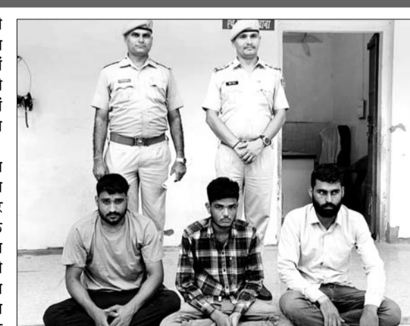
पुलिस ने हनीट्रेप मामले में तीन आरोपियों को गिरफ्तार किया।