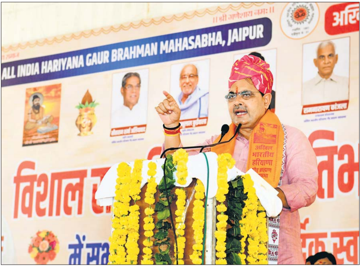
मुख्यमंत्री भजनलाल शर्मा ने अखिल भारतीय हरियाणा गौर ब्राह्मण महासभा के समारोह में भाग लिया। इस अवसर पर उन्होंने कहा कि ऐसे आयोजकों से प्रतिभाओं को प्रोत्साहन मिलता है।