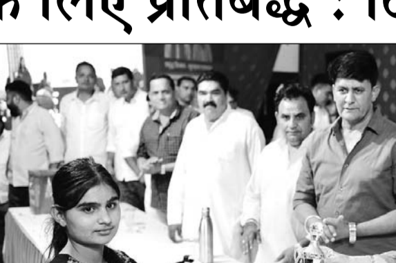
उपमुख्यमंत्री दिया कुमारी ने चौमू में ग्राम रथ अभियान के तहत संस्था चौपाल में मेधावी विद्यार्थियों को पुरस्कार देकर सम्मानित किया।

■ 'ग्राम-2026' जयपुर में 23 से 25 मई को होगा'