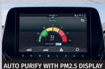
AUTO PURIFY WITH PM2.5 DISPLAY