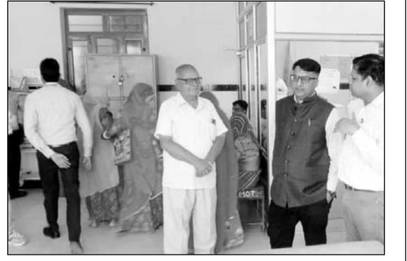
जिला कलेक्टर निशांत जैन ने जिला अस्पताल का औचक निरीक्षण किया।

बीकानेर, (कासं)। जिला कलेक्टर निशांत जैन ने सोमवार को एसडीएम राजकीय जिला चिकित्सालय का औचक निरीक्षण किया। जिला कलेक्टर ने अस्पताल के आपातकालीन वार्ड को देखा तथा यहां हीट वेव/हीट स्ट्रोक से निपटने के लिए एंटी टैथरियो का जायजा लिया। अस्पताल के आउटडोर की जानकारी ली तथा पंजीयन कार्डर के पास मरीजों और उनके परिजनों के बैठने के लिए अतिरिक्त बेंचेंज लगाने के लिए निर्देश दिए। उन्होंने कहा कि अस्पताल परिसर में साफ-सफाई व्यवस्था पर अतिरिक्त ध्यान दिया जाए। उन्होंने नेत्र और ईएनटी ओपीडी का अवलोकन भी किया और यहां की व्यवस्थाओं की समीक्षा की। जिला कलेक्टर ने प्रसूति वार्ड और संस्थागत प्रसव की जानकारी ली। इमरजेंसी वार्ड से जुड़े रिपोर्ट का फीडबैक लिया। दवा वितरण केन्द्र का अवलोकन करते हुए दवाओं की उपलब्धता के बारे में जाना। निःशुल्क जांचों की स्थिति की भी समीक्षा की। जिला कलेक्टर ने अस्पताल के विभिन्न वार्डों का निरीक्षण किया और मरीजों से व्यवस्था संबंधी फीडबैक लिया। उन्होंने हीट वेव वार्ड भी देखा और यहां सभी आवश्यक दवाईयों की उपलब्धता सुनिश्चित करने के निर्देश दिए। जिला कलेक्टर ने कहा कि भीषण गर्मी के मद्देनजर अस्पताल परिसर में शुद्ध पेयजल की व्यवस्था सुनिश्चित हो। इस दौरान जिला कलेक्टर ने अस्पताल में नगर निगम द्वारा संचालित श्री अन्नपूर्णा रसोई का निरीक्षण किया। यहां प्रतिदिन बनने वाले भोजन के बारे में जानकारी ली। उन्होंने भोजन की गुणवत्ता बरकरार रखने के साथ परिसर की साफ-सफाई और बैठने की व्यवस्था को सुदृढ़ करने के निर्देश दिए। इस दौरान जिला अस्पताल अधीक्षक डॉ. सुनील हर्ष ने अस्पताल से जुड़ी विभिन्न व्यवस्थाओं के बारे में बताया।