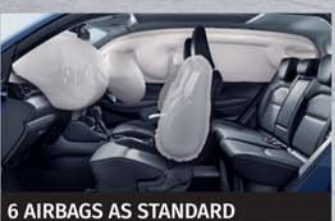
6 AIRBAGS AS STANDARD