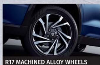
R17 MACHINED ALLOY WHEELS