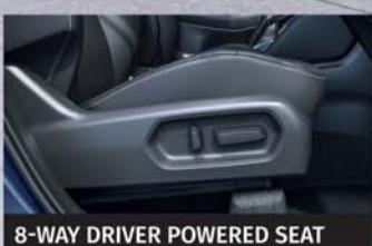
8-WAY DRIVER POWERED SEAT