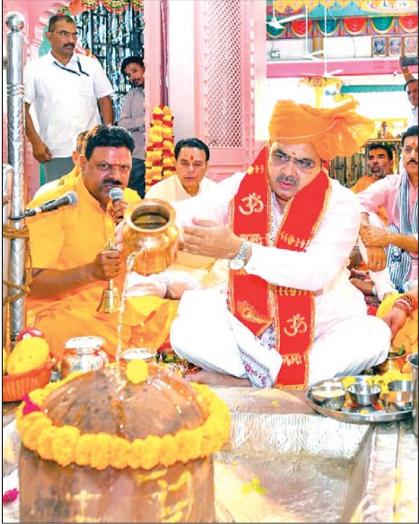
मुख्यमंत्री भजनलाल शर्मा ने सोमवार को झारखंड महादेव मंदिर में भगवान शिव का जलाभिषेक, पंचामृत अभिषेक एवं पूजा-अर्चना की।

मुख्यमंत्री भजनलाल शर्मा ने झारखंड महादेव मंदिर में वैदिक मंत्रोच्चारण एवं विधि-विधान के साथ भगवान शिव का जलाभिषेक, पंचामृत अभिषेक एवं पूजा-अर्चना की। उन्होंने देश-प्रदेश की सुख-समृद्धि एवं कल्याण के लिए कामना की।