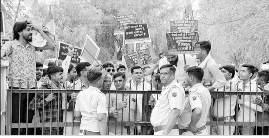
खाजूवाला में पेयजल, बिजली कटौती व सिंचाई और बढ़ते नशे के खिलाफ कांग्रेसजनों ने विरोध-प्रदर्शन किया।

ज्ञापन में बताया गया कि क्षेत्र में पीने के पानी की भारी किल्लत बनी हुई है तथा पेयजल डिगियों की हालत अत्यंत खराब है। किसानों को पर्याप्त बिजली नहीं मिल रही है और बार-बार