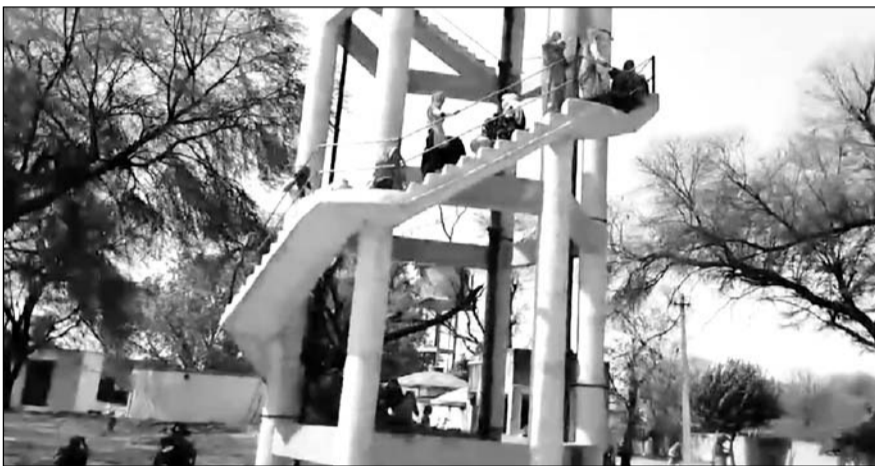
चिड़ावा के निकट अरड़ावता में पानी को लेकर महिलाएं मटके लेकर टंकी पर चढ़ गईं।