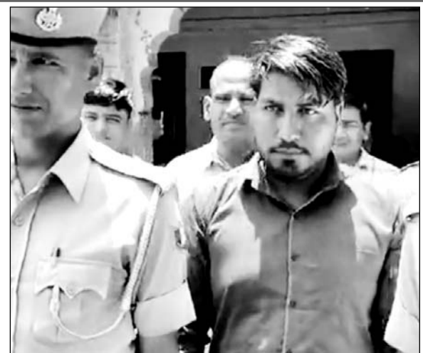
पुलिस ने हत्या के आरोपी को गिरफ्तार किया।