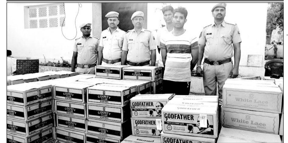
पुलिस ने शराब सहित तस्कर को गिरफ्तार किया।

लकड़ियों की आड़ में गुजरात ले जाई जा रही थी शराब