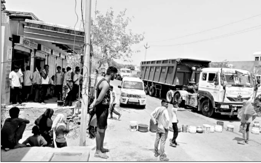
ग्राम मोहनपुर खरखड़ा की महिलाओं ने पानी को लेकर रामपुरा-पाटन सड़क पर खाली बर्तन रख कर जाम लगा दिया।