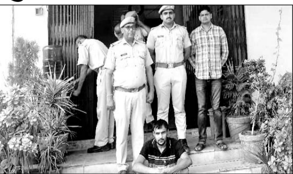
सिंधाना पुलिस ने युवक को गिरफ्तार कर गांजा बरामद किया।

■ पूछताछ में सामने आया कि आरोपी छत्तीसगढ़ से गांजा लेकर आया था