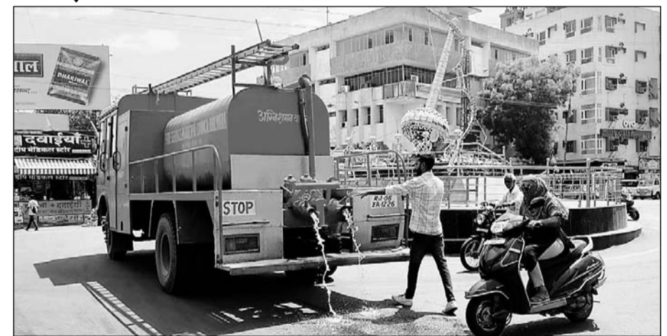
भीलवाड़ा में प्रशासन द्वारा शहर की सड़कों को टंडा रखने के लिए सड़कों पर फायर ब्रिगेड की मदद से पानी का छिड़काव करवाया जा रहा है।

नगर व्यास ने पंचांग के आधार पर बताया कि इस बार देशभर में अच्छी बारिश होगी। राजस्थान में मंडूकछाप नदी कहीं अधिक हो रही है। भीलवाड़ा में औसत बारिश होगी। फिलहाल औद्योगिक नगरी में पड़ रही भीषण गर्मी ने शहर की सड़कों को सूना कर दिया है। आमजन रोजमर्रा के कामों