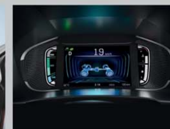
DIGITAL MULTI-INFORMATION DISPLAY