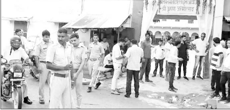
कोटपूतली में रामभवन के पास पुनः नाप जोख कर निशान लगाते परिषद् के अधिकारी।

उल्लेखनीय है कि प्रशासन ने इस कार्रवाई को अंजाम तब दिया जब ज्यादातर लोग नगरपरिषद् को चुनौती देने के लिए न्यायालय पालिका में याचिका दायर नहीं कर पाये, क्योंकि उस दौरान न्यायालय की छुट्टियां