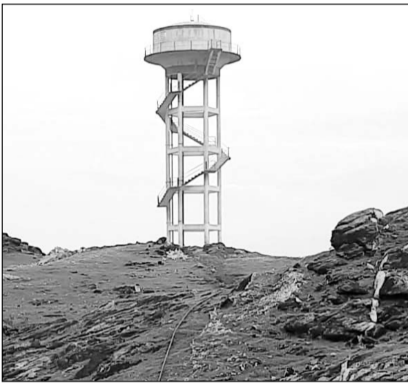
डूंगरखेड़ा ग्राम पंचायत के भरतवा गांव में निर्मित पानी की टंकी एवं कुआँ लेकिन ग्रामीणों को जल आपूर्ति नहीं हो रही है।

जानकारी के अनुसार राजसमंद जिला मुख्यालय से करीब डेढ़ सौ और भीम उपखंड मुख्यालय से पचास किमी. दूर स्थित भरतवा गांव के विकास में राजनीतिक खींचतान भारी पड़ रही है। इस गांव में सड़क, पानी व नाली की प्राथमिक सुविधाएँ भी शासन प्रशासन और जिम्मेदार महकमे उपलब्ध नहीं करवा पाया। खास बात यह है कि पक्की सड़क के लिए दो साल पहले स्वीकृत जारी हो गई, लेकिन कार्य अभी तक शुरू नहीं हो पाया। दूसरी तरफ जन स्वास्थ्य अभियांत्रिकी विभाग द्वारा घर-घर नल पहुंचाने की योजना के तहत दो कुएँ खोद दिए, टंकी बना दी और गांव में ऐसे ही प्लास्टिक का