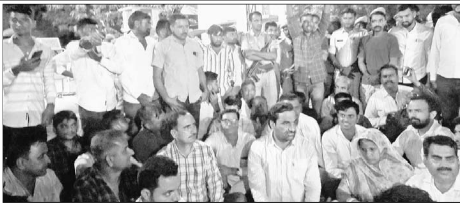
जालोर में आरएलपी के सुप्रीमो हनुमान बेनीवाल सुराणा प्रकरण को लेकर धरने पर बैठ गए।

आरएलपी सुप्रीमो व सांसद हनुमान बेनीवाल ने कहा कि जालोर में सुराणा की घटना को लेकर भाजपा का कोई नेता इस मुद्दे को लेकर नहीं बोल रहा है। भाजपा को इस प्रकार की चुपची अपराधियों को बचाना चाहती है। वहीं मुख्यमंत्री अशोक गहलोत स्वयं को जालोर जाकर पीड़ित परिवार से मिलना चाहिए, लेकिन उन्हें पीड़ित परिवार से मिलने का समय नहीं है। सुराणा प्रकरण में भाजपा व कांग्रेस दोनों मिली होने से पीड़ित परिवार को न्याय नहीं मिल रहा है। आरएलपी हमेशा बिना किसी राजनीति के पीड़ित परिवार को न्याय दिलाने आया है। उन्होंने कहा कि दलितों पर कोई अत्याचार करे, उसे आरएलपी पार्टी बर्दास्त नहीं करेगी। सुराणा में एक दलित छात्र की मौत को लेकर भाजपा