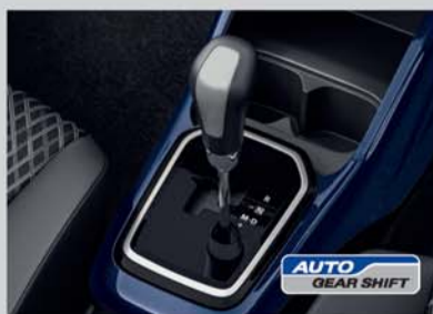
Auto Gear Shift