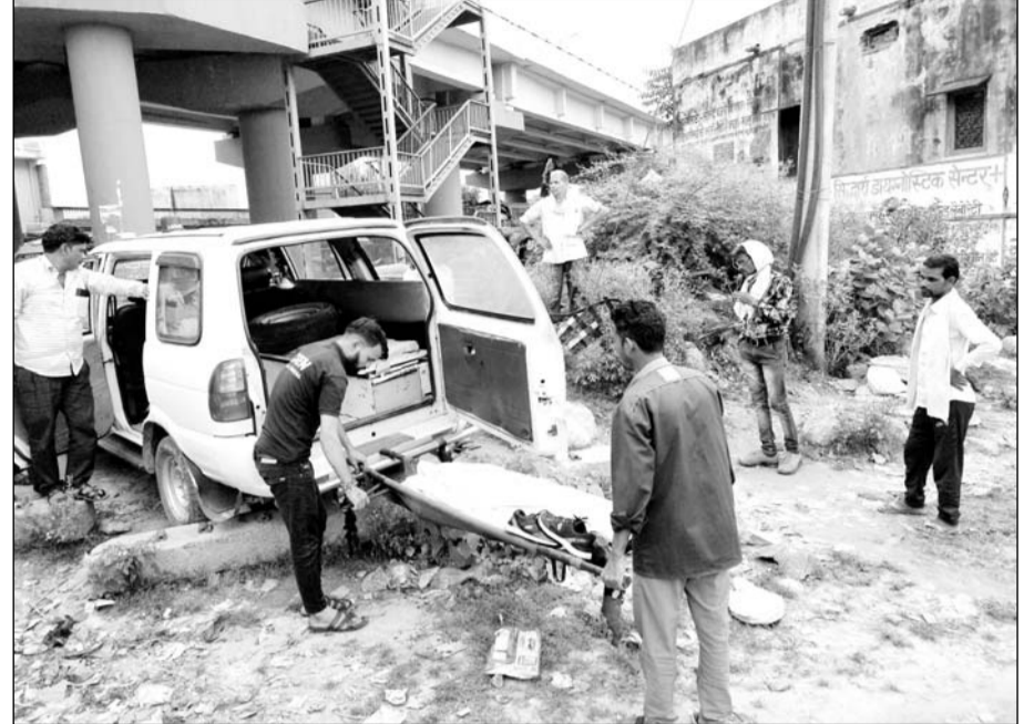
ट्रेन से गिरने के बाद मृतक युवक के शव को एम्बुलेंस में ले जाते साथी।

हिंगडौन सिटी, (कास)। शहर के महवा रोड स्थित रेलवे ओवरब्रिज के नीचे शनिवार दोपहर आगरा से चलकर अहमदाबाद जा रही अजीमाबाद सुपरफास्ट ट्रेन से गिरकर एक युवक की मौत हो गई।