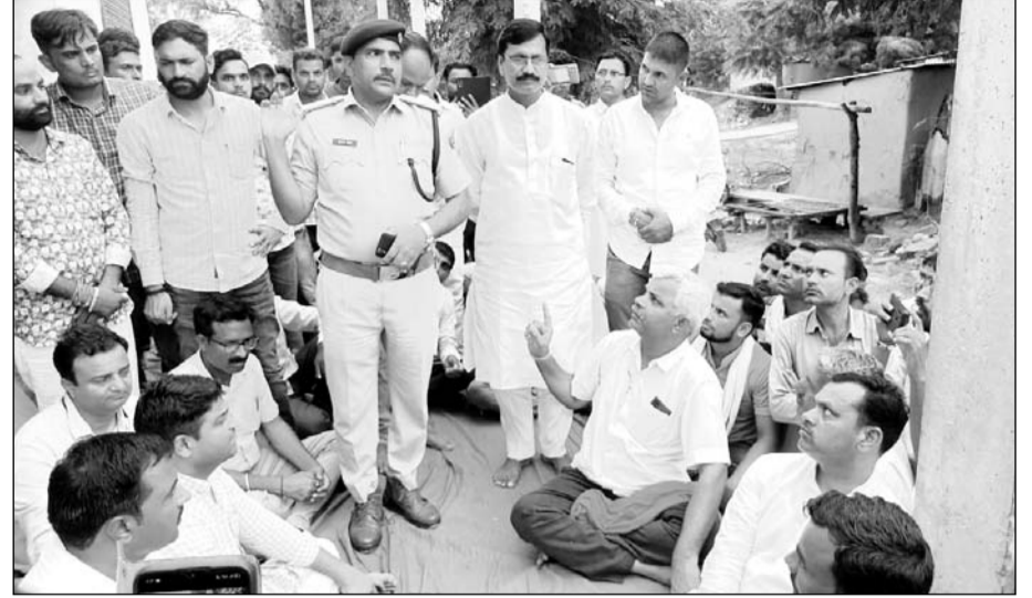
गांव ललवाड़ी की घासी की ढाणी में तनाव को देखते हुए तैनात पुलिस बल।

शुक्रवार को गाय के अवशेष मिलने से पैदा हुआ तनाव