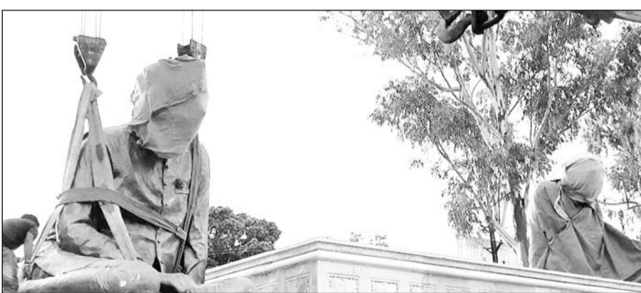
कोटा में महापुरुषों की विशाल प्रतिमाएं पहुंच गई हैं।

नगरीय विकास एवं स्वायत्त शासन मंत्री शांति धारीवाल की पहल पर कोटा में लगातार विकास एवं सौन्दर्यकरण के अभूतपूर्व कार्य प्रगतिशील है इसी कड़ी में कोटा नगर विकास न्यास द्वारा यूडीएच मंत्री शांति धारीवाल के निर्देशों में अंदाधर से आकाशवाणी तक सौन्दर्यकरण कार्य के तहत पूरे क्षेत्र में केमिकल वाश के साथ आकर्षक लाइटिंग के कार्यों के साथ 15 टन वजनी, आकर्षक, तीनों महापुरुषों की