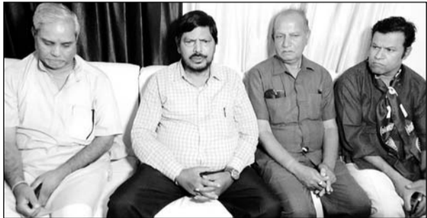
जालोर में केन्द्रीय सामाजिक न्याय एवं अधिकारिता राज्य मंत्री रामदास अठावले सुराणा प्रकरण को लेकर प्रेस से रूबरू हुए।

उन्होंने कहा कि एक मासूम विद्यार्थी के साथ हुई यह घटना निरनियंत्रित है। उन्होंने उक्त घटना की रिपोर्ट केन्द्र सरकार को भेजने की बात कही। उन्होंने कहा कि एक दलित छात्र द्वारा टीचर की मटकी के हाथ लगाने से ऐसी पिटाई की कि उसकी मौत हो गई। राजस्थान सरकार से मांग करता हूँ कि यदि राजस्थान सरकार दलितों को सुरक्षा नहीं दे सकती है, तो गहलोत को सत्ता में नहीं रहने के साथ राष्ट्रपति शासन लागू करना चाहिए। इस घटना के बाद मुख्यमंत्री पर प्रश्न चिन्ह खड़ा करता है। दलितों पर अत्याचार नहीं होना चाहिए। यदि दलितों पर अत्याचार रोकने में कोई सरकार विफल होती है तो उन्हें सत्ता में रहने का अधिकार नहीं है। आरपीआई की तरफ से तीन लाख रुपये की सहायता राशि पीड़ित परिवार को दी जायेगी। उन्होंने सीएम को आगाह किया कि ऐसी घटना की पुनरावृत्ति नहीं हो इसके लिए पुख्ता प्रबंध करें। उन्होंने कहा कि दोषी को फांसी की सजा मिलनी चाहिए। उन्होंने कहा कि दो पहलुओं की पूर्ण व निष्पक्ष जांच होनी चाहिए। उन्होंने कहा कि उन्हें घटना की पूरी जानकारी नहीं है। पीड़ित परिवार से मिलने के बाद