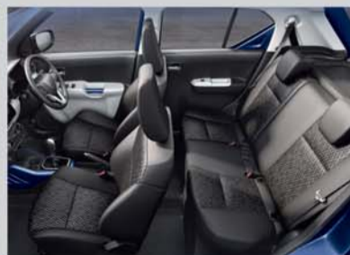
Spacious and Comfortable Interiors