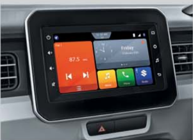
17.78 cm Smartplay Studio (Available from Zeta variant onwards)