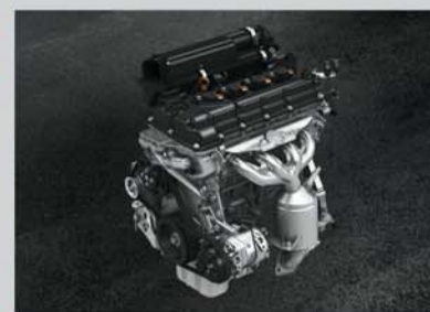
1.2L VVT Petrol Engine