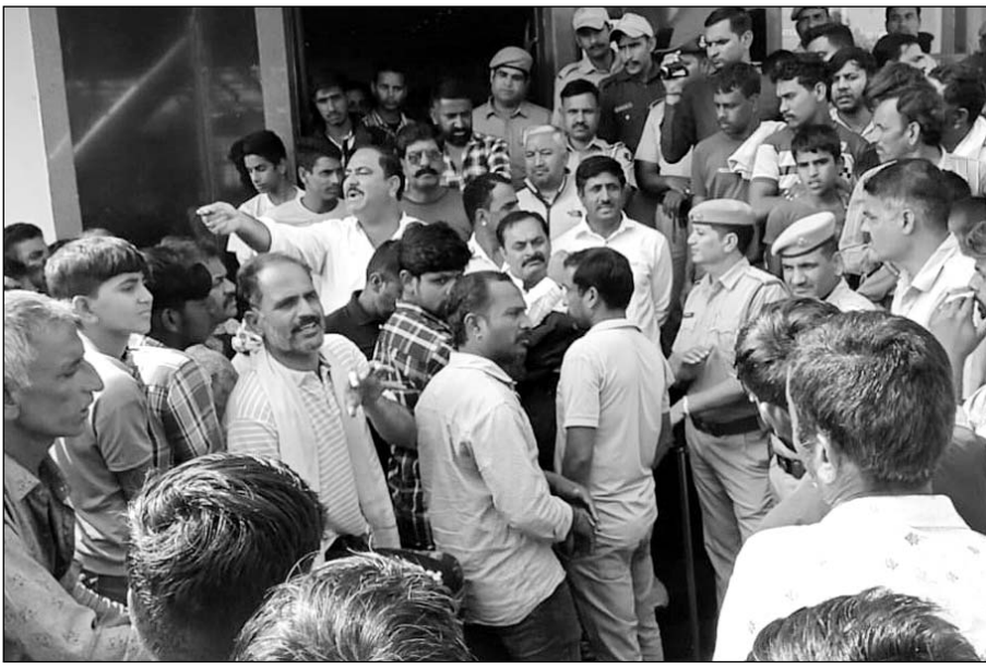
राजसमंद के मांडावाडा टोल प्लाजा पर सुरक्षाकर्मी की मौत पर ग्रामीणों ने प्रदर्शन किया।