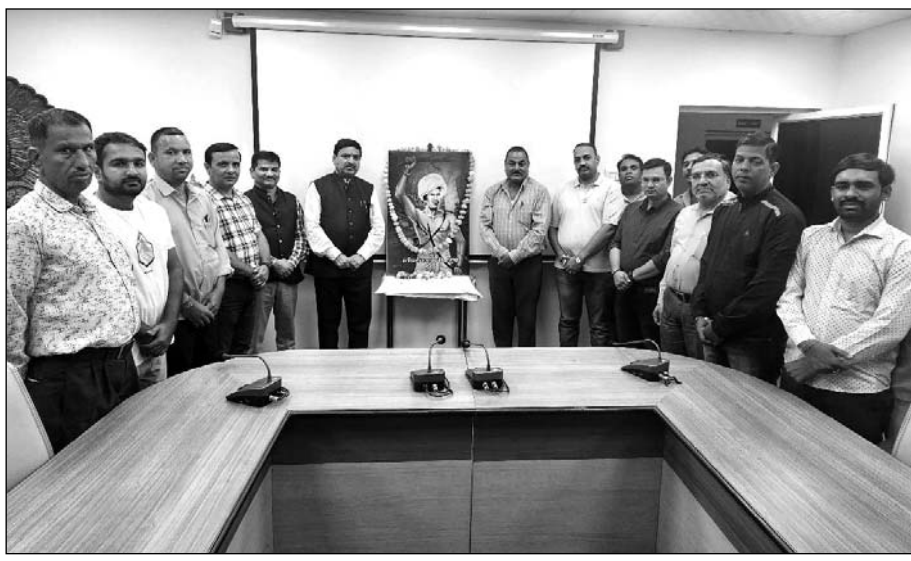
भगवान बिरसा मुण्डा की जयंती राजस्थान विद्यापीठ डीम्ड टू बी विवि के कुलपति सभागार में मनाई।