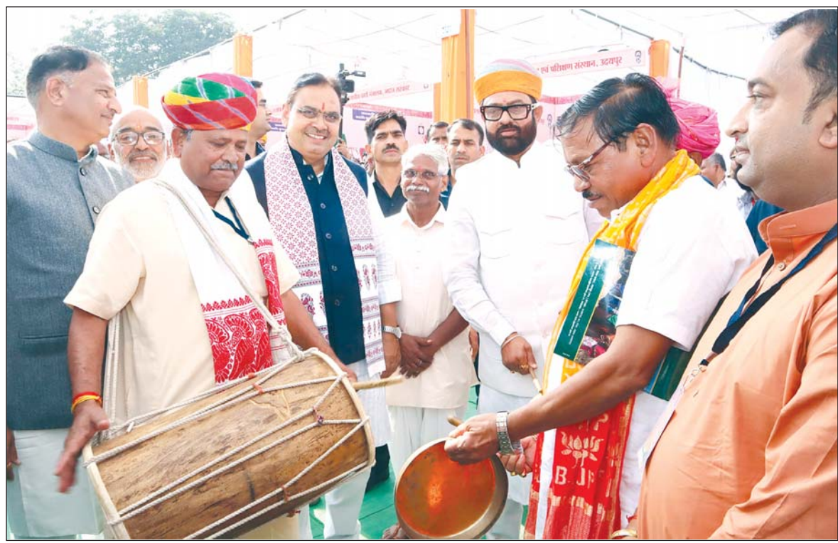
बांसवाड़ा में जनजातीय गौरव दिवस समारोह में मुख्यमंत्री भजनलाल शर्मा ने पारम्परिक वाद्ययंत्रों तथा उनके संगीत को देखा।