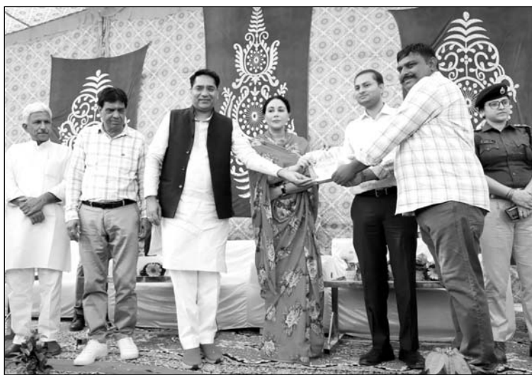
उपमुख्यमंत्री एवं जिले की प्रभारी मंत्री दिया कुमारी ने अन्तर्राष्ट्रीय पुष्कर मेला-2024 के समापन समारोह में पुरस्कार दिये।

अन्तर्राष्ट्रीय पुष्कर मेला-2024 के समापन कार्यक्रम में उपमुख्यमंत्री एवं जिले की प्रभारी मंत्री दिया कुमारी ने शिरकत की