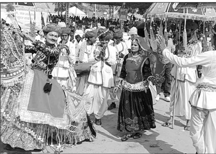
पुष्कर मेला समापन समारोह के दौरान रस्सा कस्सी, मटका दौड़, चम्मच रेस सहित कई रंगारंग कार्यक्रम आयोजित हुये।

अजमेर, (कासं)। उपमुख्यमंत्री एवं जिले की प्रभारी मंत्री दिया कुमारी ने कहा कि तीर्थराज पुष्कर को अयोध्या और काशी की तर्ज पर विकसित किया जाएगा। अन्तर्राष्ट्रीय श्री पुष्कर पशु मेला प्रतिवर्ष पूर्ण भव्यता के साथ आयोजित होगा, केन्द्र व राज्य सरकार के समन्वित प्रयासों से राजस्थान अन्तर्राष्ट्रीय पर्यटन मानचित्र पर अग्रणी होगा। उप मुख्यमंत्री दिया कुमारी ने शुक्रवार को अन्तर्राष्ट्रीय पुष्कर मेला-2024 के समापन समारोह को मुख्य अतिथि के रूप में सम्बोधित किया।