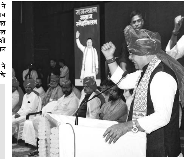
मुख्यमंत्री भजनलाल शर्मा ने शुक्रवार को महाराष्ट्र विधानसभा चुनाव के तहत पुणे के भोसरी में आयोजित राजस्थानी समाज सम्मेलन को संबोधित किया।

सहयोगी सिर्फ झूठ व लूट की बात करते हैं तथा महाअघाड़ी गठबंधन नहीं, बल्कि ठगबंधन है, जिसने जनता को ठगा है। महाराष्ट्र को ऐसे ठगबंधन की जरूरत नहीं है, जो जनता को थोपे के सिवा कुछ न दे सके। चुनाव के समय अफवाहों को सहारा देने वाली कांग्रेस प्रत्याभार को जननी है, लेकिन महाराष्ट्र की जनता इन भ्रष्टाचारियों को वोट की चोट से सबक सिखाएगी। उन्होंने कहा कि प्रधानमंत्री नरेन्द्र मोदी दुनिया के सबसे मजबूत लीडर हैं, जिनके नेतृत्व में भारत का पूरी दुनिया में डंका बज रहा है। वर्ष 2014 के बाद आये परिवर्तन को सभी ने देखा है। गरीब कल्याण की योजनाएं, सीमाओं की सुरक्षा, आतंकवाद का खान्ता और दुनिया में बढ़ता हुआ गौरव इसका प्रमाण है। शर्मा ने कहा कि हर राजस्थानी राष्ट्र