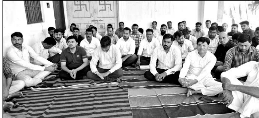
अजमेर के उबरा का देवरा में गुर्जर समाज के पंच पटेलों की बैठक हुई।