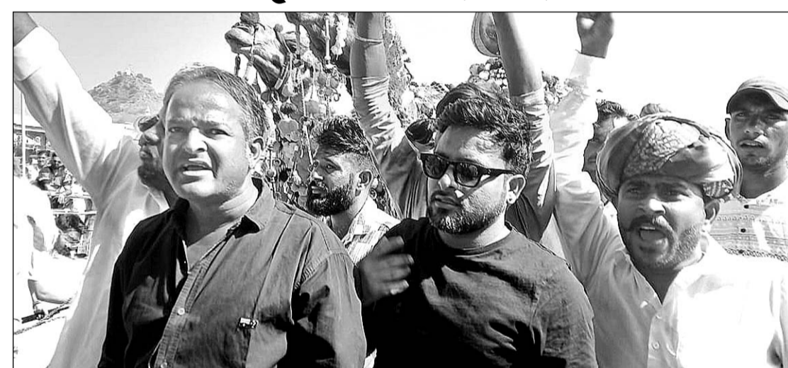
पुष्कर मेले में काफी संख्या में देशी व विदेशी पर्यटकों का आना जारी है।

पुष्कर 10 नवंबर। पुष्कर के सालाना मेले में राजस्थान सहित देश के विभिन्न राज्यों से श्रद्धालु पहुंच रहे हैं वहीं सात समुन्द्र पार से विदेशी मेहमानों के आने से ब्रह्मजी की पावन नगरी पूर्व पश्चिम संस्कृति की स्थली में तब्दील हो गई है। सैलानियों को मेले में आ रहे ठामाँग महिला पुरुष श्रद्धालुओं के साथ उठ व घोड़े चोड़ियों करतब लुभा रहे हैं। पशुओं की मंडी में पशुपालक खरीद फरोख्त में मशगूल है।