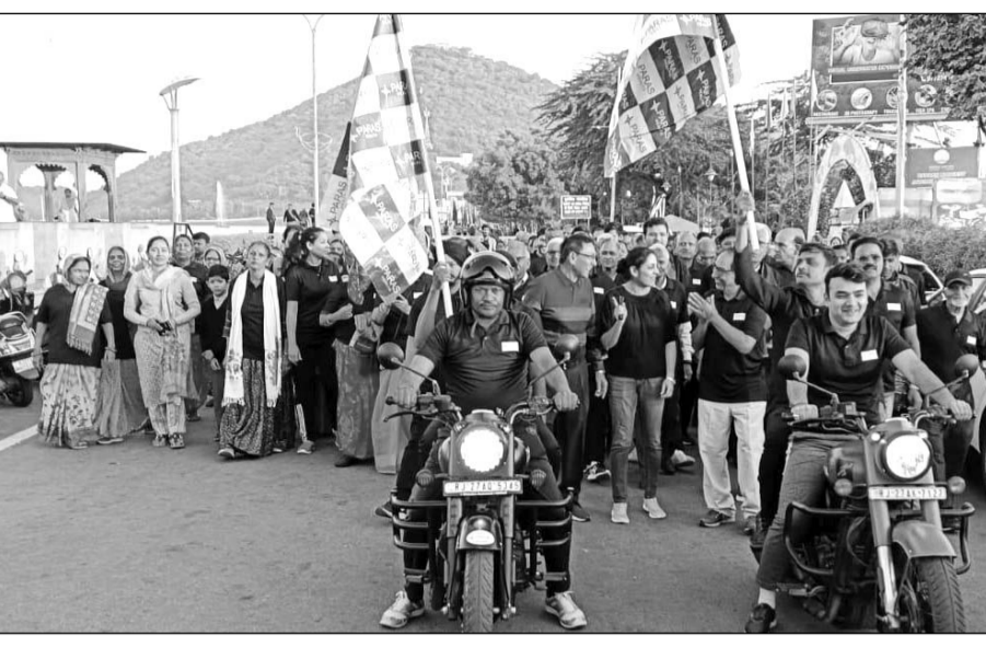
फतहसागर पाल पर वाँकार्थॉन का आयोजन किया गया।

उदयपुर, (कासं)। आधुनिक युग में लोगो की बदलती जीवन शैली के चलते डायबिटीज और लकवा जैसी बीमारी के मरीज दिनोंदिन बढ़ रहे हैं और इसी उद्देश्य से पैसिफिक मेडिकल कॉलेज एंड हॉस्पिटल की ओर से विश्व मधुमेह दिवस पर फतह सागर पर इंडियन स्ट्रोक एसोसिएशन, वर्ल्ड स्ट्रोक ऑर्गेनाइजेशन एवं स्ट्रोक सपोर्ट टाउप उदयपुर के संयुक्त तत्वावधान में रन फॉर डायबिटीज एवं मिशन फॉर ब्रेन अटैक के तहत लकवा जागरूकता कैम्प का आयोजन किया गया। कार्यक्रम के माध्यम से आम आदमी को मधुमेह एवं लकवा से बचाव का संदेश दिया गया।