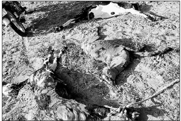
रविवार को दो-तीन बकरियों की फिर से मौत हुई है।