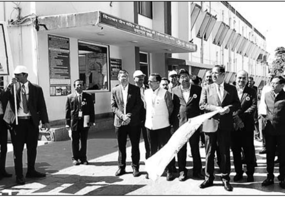
राज्यपाल हरिभाऊ बागड़े ने संरक्षण क्षमता 'सक्षम' 2025 के उद्घाटन समारोह में संबोधित किया।