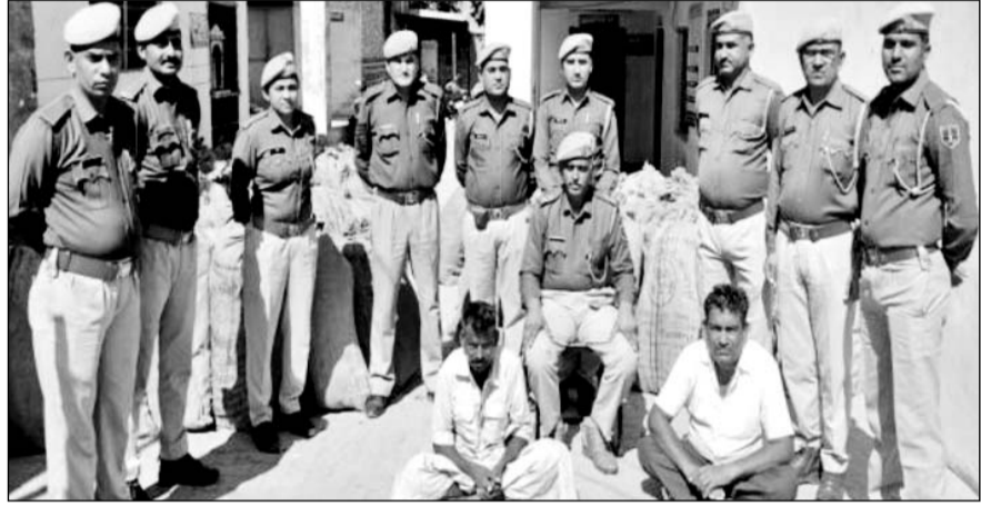
बिशनगढ़ पुलिस ने अफीम के पौधे जब्त कर दो आरोपियों को गिरफ्तार किया।