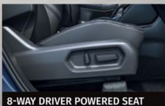
8-WAY DRIVER POWERED SEAT