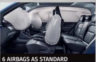
6 AIRBAGS AS STANDARD