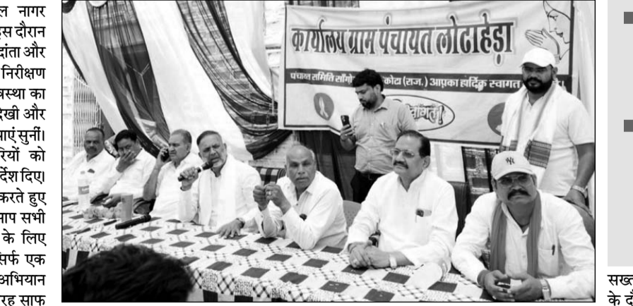
ऊर्जा मंत्री हीरालाल नागर ने कनवास क्षेत्र के लोढ़ादेड़ा में जनसुनवाई की।

कोटा, (निर्स)। ऊर्जा मंत्री हीरालाल नागर रविवार को कनवास क्षेत्र के दौर पर रहे। इस दौरान उन्होंने क्षेत्र के मामोरे, लोढ़ादेड़ा, धूलेट, दांता और बांय्याहेड़ी सहित कई गांवों का दौरा कर निरीक्षण किया। मंत्री नागर ने गांवों में सफाई व्यवस्था का जायजा लिया, ग्रामीण रास्तों की स्थिति देखी और ग्रामीणों के बीच बैठकर उनको जन समस्याएं सुनीं। उन्होंने मौके पर ही मौजूद अधिकारियों को समस्याओं के त्वरित निस्तारण के कड़े निर्देश दिए। ग्रामीणों को स्वच्छता के प्रति जागरूक करते हुए ऊर्जा मंत्री हीरालाल नागर ने कहा कि आप सभी केवल 8 दिन अपने गांव की सफाई के लिए समर्पित कर दें। इसके बाद महीने में सिर्फ एक दिन हम सभी मिलकर एक बड़ा सफाई अभियान चलाएंगे। ऐसा करने से हमारे गांव पूरी तरह साफ हो जाएंगे और कचरे का नामोनिशान मिट जाएगा। यह काम अकेले सरकार का नहीं, बल्कि जनसहभागिता से ही संभव है।