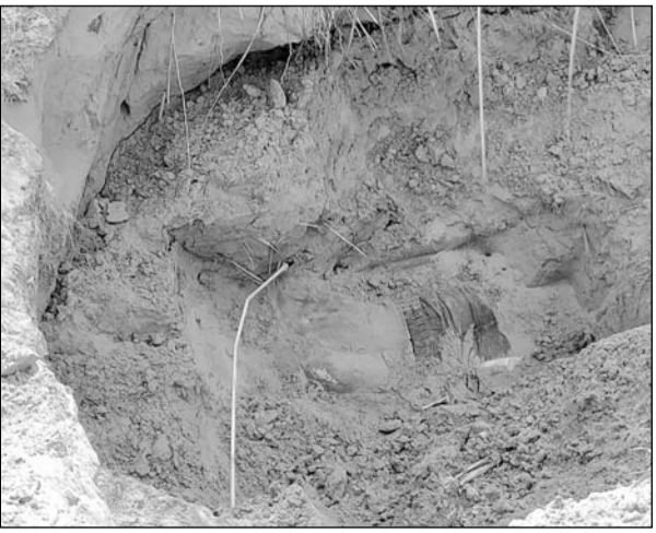
चंदवाजी के पास कंवरपुरा गांव में नदी के पास मिट्टी में युवक का शव दबा हुआ मिला

जानकारी के अनुसार रविवार सुबह कुछ ग्रामीणों को नदी के पास मिट्टी में दबा शव दिखाई दिया और पास ही खून भी बिखरा हुआ था। हत्यारों ने युवक की हत्या करने के बाद जल्दीवाजी में शव के ऊपर ठीक से मिट्टी डालना भूल गए। सूचना पर चंदवाजी थाना पुलिस मौके पर पहुंची। मृतक की पहचान हरचंदपुरा