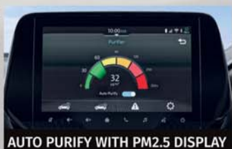
AUTO PURIFY WITH PM2.5 DISPLAY