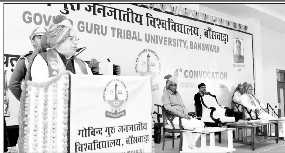
बांसवाड़ा में गोविंद गुरु जनजातीय विश्वविद्यालय के दीक्षांत समारोह को राज्यपाल ने संबोधित किया।

उन्होंने दीक्षांत समारोह में उपाधि प्राप्त करने वाले छात्रों की अपेक्षा छात्राओं की संख्या अधिक होने पर हर्ष व्यक्त करते हुए कहा कि यह बालिका शिक्षा के क्षेत्र में एक सुखद एवं सहायनी पहल है। राज्यपाल कलराज मिश्र ने समारोह में तीस टॉपर को गोल्ड मेडल व 11 शोधार्थियों को पीएच.डी की उपाधि प्रदान की। उन्होंने विश्वविद्यालय द्वारा नई शिक्षा नीति के आलोक में ऐसे पाठ्यक्रम बनाए जाने की भी आवश्यकता जताई जिससे