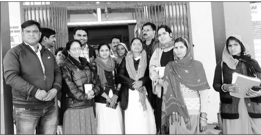
नर्सैज ने अपनी मांगों को लेकर काली पट्टी बांधकर विरोध प्रदर्शन किया।