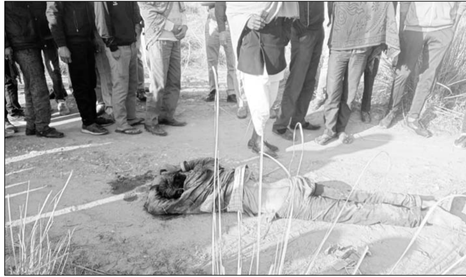
युवक की लाश मिलने के बाद मौके पर ग्रामीणों की भीड़ लग गई।