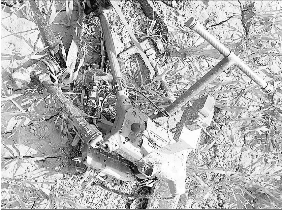
सुरक्षाबलों ने फायरिंग करके शुक्रवार देर रात श्रीगंगानगर में एक पाकिस्तानी ड्रोन को मार गिराया। बाद में सुरक्षाबलों ने जब ड्रोन की तलाशी ली तो उसमें से करीब छः किलो हेरोइन बरामद हुई।

श्रीगंगानगर, 4 फरवरी (का.सं.) श्रीगंगानगर जिले के केसरीसिंहपुर इलाके में गत देर रात बीएसएफ और पुलिस ने संयुक्त कार्रवाई में पाकिस्तानी ड्रोन को फायरिंग कर गिरा दिया। ड्रोन के बारे में सीआईडी जौन श्रीगंगानगर