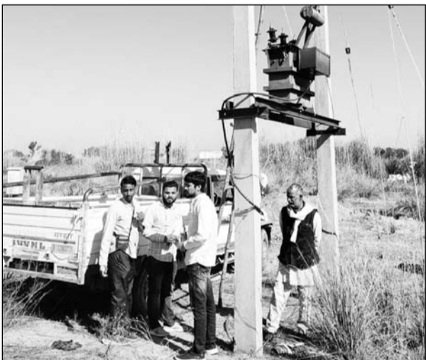
कोटपुतली में जल जीवन मिशन के नलकूपों का बिजली विभाग की टीम ने कनेक्शन काटा।