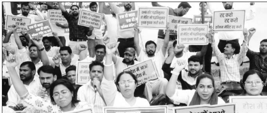
होम्योपैथी और यूनानी डॉक्टरों ने जयपुर के शहीद स्मारक पर धरना-प्रदर्शन किया।

धरने में शामिल अभ्यर्थियों का कहना था कि भर्ती प्रक्रिया शुरू होने से पहले राजस्थान कर्मचारी चयन बोर्ड ने विभाग को कई बार अत्याचार काया था कि अलग-अलग पद्धतियों के प्रश्नपत्रों