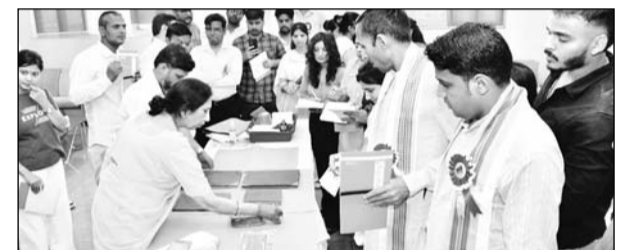
'पांडुलिपियों का निवारण एवं संरक्षण' विषय पर पांच दिवसीय कार्यशाला का आयोजन हुआ।

हरिद्वार में किया जा रहा है। इस मिशन का उद्देश्य भारत की विशाल एवं अप्रमूल्य पांडुलिपि विरासत का संरक्षण, दस्तावेजोपकरण तथा डिजिटलीकरण करना है, ताकि यह प्राचीन ज्ञान-संपदा भावी पीढ़ियों के लिए सुरक्षित रह सके। कार्यशाला का आयोजन पांडुलिपि संरक्षण के प्रति जागरूकता उत्पन्न करने तथा संरक्षण एवं भंडारण