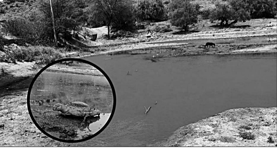
अलवर के ग्राम चौमू में स्थित घाटा एनीकट में कुछ दिनों से पानी रंग बललता दिख रहा है।