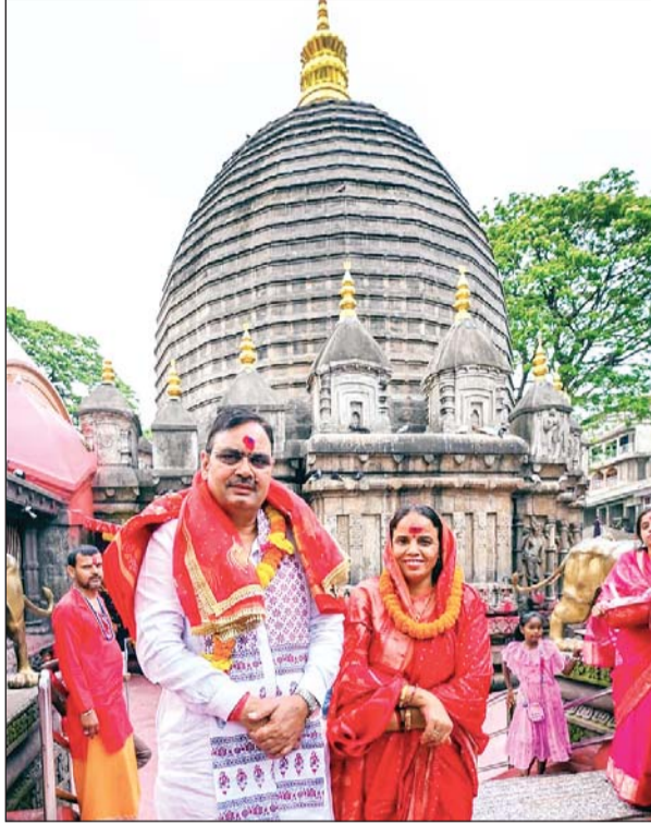
मुख्यमंत्री भजनलाल शर्मा ने मंगलवार को असम के गुवाहाटी में माँ कामाख्या मंदिर में सपत्नीक दर्शन किए।

इस अवसर पर केन्द्रीय गृह मंत्री अमित शाह, केन्द्रीय रक्षा मंत्री राजनाथ सिंह, केन्द्रीय मंत्रिमण्डल के सदस्यों सहित, विभिन्न राज्यों के मुख्यमंत्री, उपमुख्यमंत्री, मंत्रांगण एवं अन्य जनप्रतिनिधिगण उपस्थित रहे।