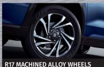
R17 MACHINED ALLOY WHEELS