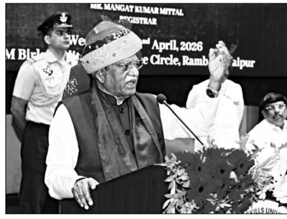
राज्यपाल हरिभाऊ बागडे ने बुधवार को विश्वकर्मा कौशल विश्वविद्यालय के द्वितीय दीक्षांत समारोह को संबोधित किया।

-कार्यालय संवाददाता- जयपुर। राज्यपाल हरिभाऊ बागडे ने कहा कि कौशल शिक्षा का उपयोग राष्ट्र के सर्वांगीण विकास के लिए होना चाहिए। उन्होंने कहा कि जिसके पास अच्छा कौशल है, उसे सभी स्थानों पर काम मिलता है, वह कभी भूखा नहीं रहता। उन्होंने कौशल शिक्षा के साथ विश्वविद्यालयों में नैतिक शिक्षा को बढ़ावा दिए जाने पर जोर दिया। उन्होंने कहा कि नैतिक मूल्यों की शिक्षा से भौतिक विकास की गुणवत्ता में वृद्धि होती है। राज्यपाल बागडे बुधवार को विश्वकर्मा कौशल विश्वविद्यालय के द्वितीय दीक्षांत समारोह में संबोधित कर रहे थे।