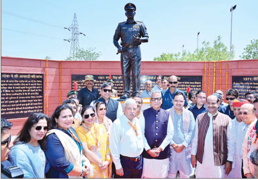
मुख्यमंत्री भजनलाल शर्मा बुधवार को चूरु में आयोजित लेफ्टिनेंट जनरल सगत सिंह राठौड़ के मूर्ति अनावरण कार्यक्रम में शामिल हुए। इस अवसर पर लोकसभा अध्यक्ष ओम बिड़ला, सिविकम के राज्यपाल ओम माथुर, पूर्व नेता प्रतिपक्ष राजेन्द्र राठौड़ मौजूद थे।

शर्मा बुधवार को चूरु में आयोजित लेफ्टिनेंट जनरल सगत सिंह राठौड़ के मूर्ति अनावरण एवं 'शौर्य के साथ संकल्प दिवस' कार्यक्रम को संबोधित कर रहे थे। उन्होंने कहा कि लेफ्टिनेंट जनरल सगत सिंह ने 19 साल की उम्र में बीकानेर रियासत की सेना में सैन्य जीवन से शुरुआत की। उन्होंने कहा कि हमारी सरकार ने पद्म भूषण और परम विशिष्ट सेवा मेडल से सम्मानित लेफ्टिनेंट जनरल सगत सिंह राठौड़ के सम्मान में चूरु स्टेडियम का नाम सगत सिंह राठौड़ स्टेडियम किया है। मुख्यमंत्री ने कहा कि हमारी सरकार सैनिक कल्याण के लिए सजग होकर निरन्तर कार्य कर रही है। डीडवाना-कुचामन में राजस्थान के पहले एकीकृत सैनिक कल्याण परिसर की स्थापना की तथा नवीन जिला सैनिक कल्याण