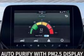
AUTO PURIFY WITH PM2.5 DISPLAY