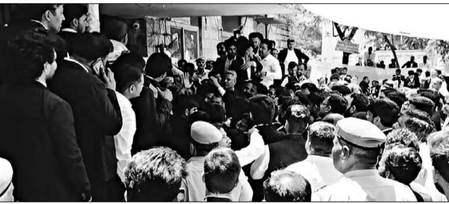
बार कौंसिल के चुनाव में बुधवार को अव्यवस्था के बाद अधिवक्ताओं ने हंगामा कर दिया।

-कार्यालय संवाददाता- जयपुर। प्रदेश के अधिवक्ताओं की नियामक संस्था बार कौंसिल ऑफ राजस्थान के 23 सदस्यों के चुनाव बुधवार को प्रदेशभर में आयोजित हुए। हालांकि इस दौरान जयपुर में हाईकोर्ट और सेशन कोर्ट में पोलिंग बूथ पर हुई अव्यवस्था और पारदर्शिता के अभाव के चलते मतदान प्रक्रिया को रद्द कर दिया गया है। यहां जल्दी ही नई चुनाव तिथि घोषित की जाएगी।