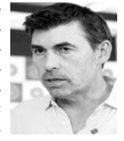
चेन्नई, 29 मार्च। आईपीएल इतिहास की सबसे सफल टीम चेन्नई सुपर किंग्स की आईपीएल के 18वें सीजन में जीत के साथ शुरुआत हुई। लेकिन टीम इस विजेयी रथ को जारी नहीं रख पाई और उसे दूसरे मैच में आरसीबी के खिलाफ 50 रनों से हार झेलनी पड़ी। साल 2008 के बाद अब जाकर आरसीबी ने सीएसके को उनके घरेलू मैदान पर हराया। इस सीजन में एक तरफ जहां अन्य टीमों में शुरु से ही धमाकेदार शुरुआत करती है तो वहीं सीएसके पुराने धरं पर ही चल रह है और ये टीम बाद में गति पकड़ने पर विश्वास कर रही है। चेन्नई की रणनीति मुंबई इंडियंस के खिलाफ 156 रनों के लक्ष्य का पीछा करते हुए कारगर साबित हुई, लेकिन आरसीबी ने 196 रन बनाए और फिर ये टीम रन रेट को बनाए रखने में विफल रही। चेन्नई ने आरसीबी के खिलाफ शुरुआत विकेट जल्दी गंवा दिए और इसके कारण से बैकफुट पर आ गए।