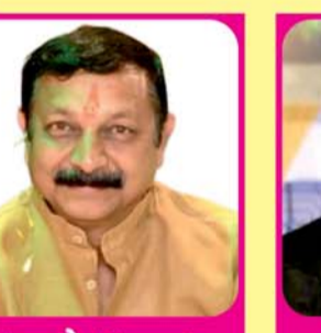
रणछोर अग्रवाल गोयनका प्रोपर्टीज