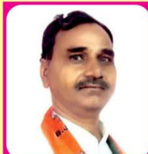
नेता स्वपडेलवाल उपाध्यक्ष भाजपा कोटा महानगर