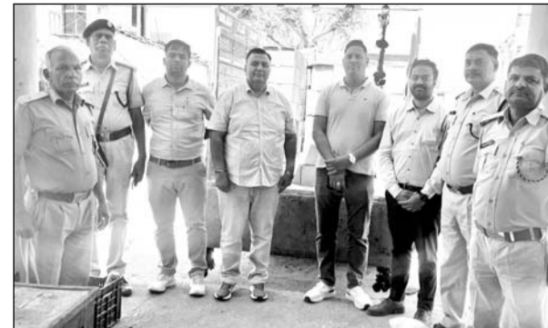
आबकारी निरोधक दल ने कार्बाई कर अवैध शराब बरामद की।