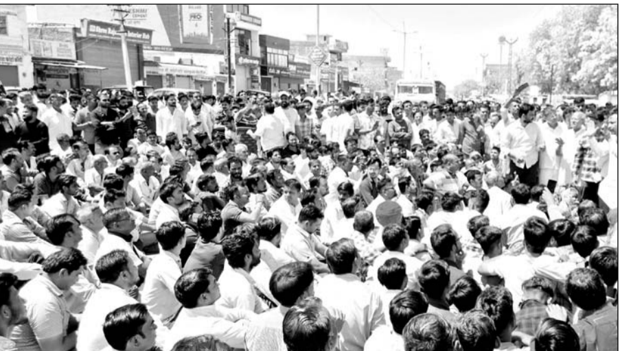
किशोरी के आत्महत्या प्रकरण को लेकर आहोर के लोगों ने बाजार बंद कर विरोध-प्रदर्शन किया।

प्राप्त जानकारी के अनुसार एक नाबालिग लड़की ने पिछले दिनों फांसी का फंदा लगाकर आत्महत्या कर ली थी। सूचना पर आहोर पुलिस मौके पर पहुंची और मौका मुआयना के बाद परिजनों की रिपोर्ट पर मामला मार्ग में दर्ज कर अनुसंधान की कार्बाई शुरू कर दी। इस बीच परिजनों व समाज के लोगों को किशोरी की आत्महत्या के पीछे किन्हीं लोगों का हाथ होने की भनक लगने पर आरोपियों की गिरफ्तारी को लेकर बड़े स्तर पर विरोध प्रदर्शन करने का निर्णय लिया गया। आहोर व्यापार संघ ने आहोर बंद कराने का एलान कर दिया था। शनिवार को आत्महत्या के विरोध में माधोपुरा स्थित सातलाजी भगवान मंदिर में हजारों की संख्या में प्रदर्शनकारी शामिल हुए और विरोध जताया। सभा के बाद सभी लोग सड़कों पर उतर आए और माधोपुरा से