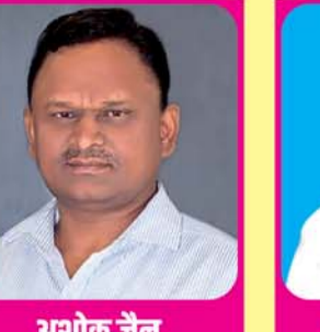
अशोक जैन भाजपा मंत्री, कोटा महानगर