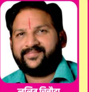
ललित चितौडा वरिष्ठ भाजपा नेता