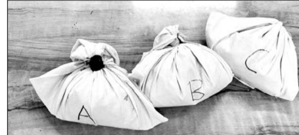
चित्तौड़गढ़-भीलवाड़ा रोड पर बाइक सवार से जब्त अफीम।