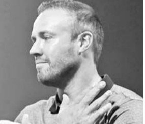
थायह आईपीएल टीमों और विकल्पों में अच्छे संतुलन को लेकर था।" डिविलियर्स ने कहा, "मैंने भुवनेश्वर कुमार को देखा तो मुझे लगा कि वह नहीं खेल रहा है और फिर दूसरे मैच में वह टीम में था। आपको यही तो चाहिये। पहले मैच में (केकेआर के खिलाफ) वह टीम में नहीं था और दूसरे मैच में वह किसी और की जगह टीम में था। यही वह संतुलन और गहराई है जो टीम को चाहिये होती है।"

नई दिल्ली, 29 मार्च। आईपीएल में रॉयल चैलेंजर्स बंगलुरु की शानदार शुरुआत को देखते हुए दक्षिण अफ्रीका के महान बल्लेबाज एबी डिविलियर्स का मानना है कि इस बार टीम पिछले सत्रों की तुलना में दस गुना बेहतर लग रही है और उम्दा शुरुआत से आगे उसका काम आसान हो जायेगा। रजत पाटीदार की कप्तानी में आरसीबी ने शुक्रवार को चेन्नई सुपर किंग्स को चेरांक पर सत्रह साल बाद हराकर लगातार दूसरी जीत दर्ज की। आरसीबी के लिये खेल चुके डिविलियर्स ने अपने पॉडकास्ट 'एबी डिविलियर्स 360' में कहा, "इस बार आरसीबी टीम का संतुलन पिछले सत्रों से दस गुना बेहतर है।" उन्होंने कहा, "पिछले साल आईपीएल नीलामी के समय मैंने कहा था कि आरसीबी को संतुलन की जरूरत है। यह गेंदबाजों, बल्लेबाजों या क्षेत्ररक्षकों को लेकर नहीं