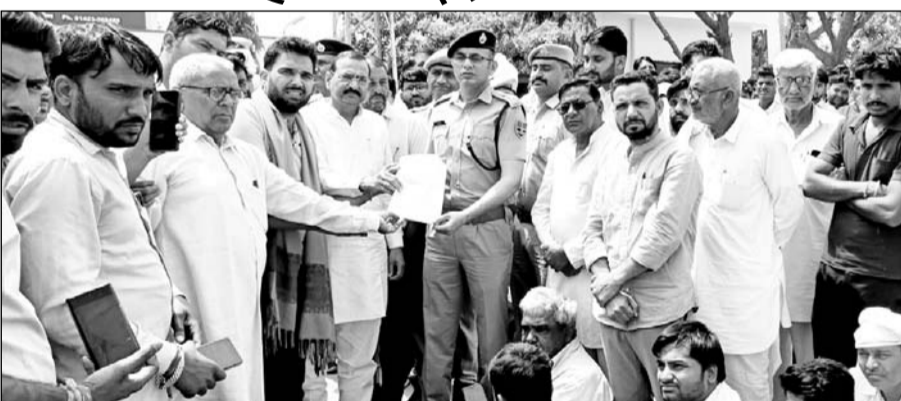
पुलिस अधिकारियों ने मौके पर समझाइश वार्ता की।