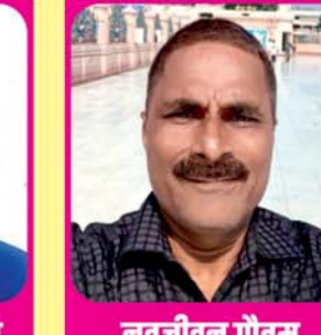
नवजीवन गौतम वरिष्ठ भाजपा नेता