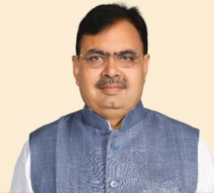
भजनलाल शर्मा मुख्यमंत्री, राजस्थान