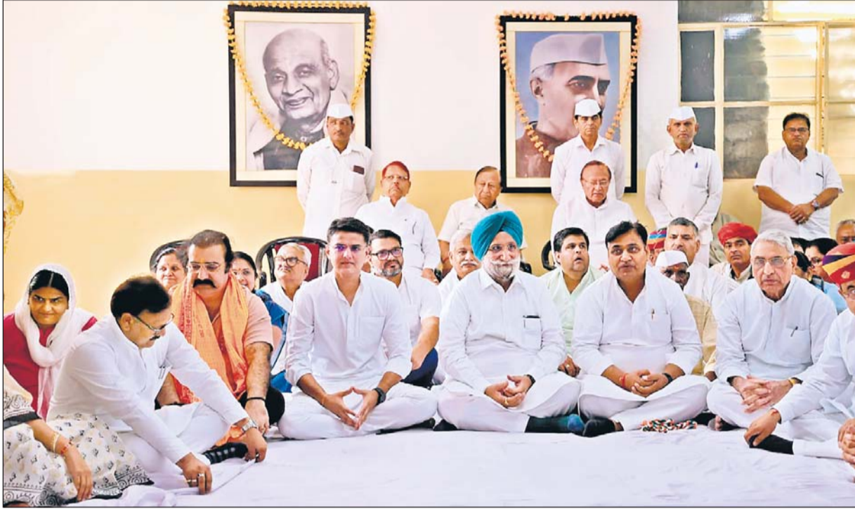
महात्मा गांधी और लालबहादुर शास्त्री की जयंती पर प्रदेश कांग्रेस मुख्यालय में आयोजित कार्यक्रम में सचिन पायलट शामिल हुए।