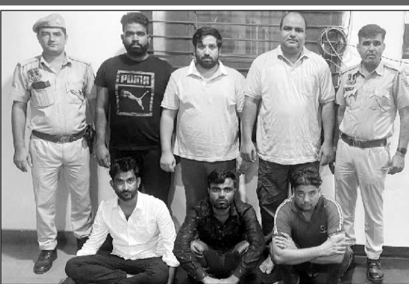
जयपुर पुलिस कमिश्नरीट की स्पेशल टीम ने जवाहर सर्किल इलाके में कार्रवाई करते हुए मेजबान तस्करी करने वालों को गिरफ्तार किया।

जयपुर। जयपुर पुलिस कमिश्नरीट की स्पेशल टीम (सीएसटी) ने जवाहर सर्किल थाना इलाके में सोने की तस्करी करने वालों के खिलाफ कार्रवाई करते हुए छह तस्करो को गिरफ्तार किया गया है। जिनके पास से 12 किलो 467 ग्राम सोना एवं 2 लत्रजी वाहन जब्त किया गया। पुलिस की प्रारंभिक पूछताछ में सामने आया कि यह सोना दुबई से लाया गया था। साथ ही जब्त किए गए सोने की बाजार कीमत 7 करोड़ 50 लाख रुपए आंकी गई है। फिलहाल आरोपियों से पूछताछ की जा रही है।