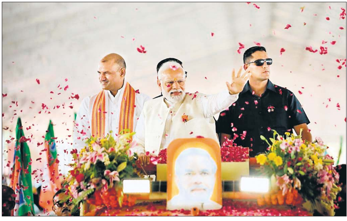
सांवलिया जी में प्रधानमंत्री नरेन्द्र मोदी का शानदार स्वागत हुआ। प्रधानमंत्री ने विशाल जनसभा को संबोधित किया।