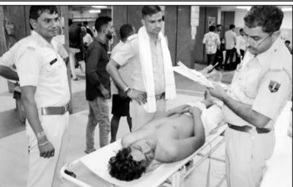
पुलिस ने अस्पताल में घायल युवक के बयान लिये।

अजमेर, (कास)। रामगंज थाना क्षेत्र के खानपुरा में रहने वाले एक युवक का वैन और बाइक पर सवार होकर आए बदमाशों ने अपहरण कर मारपीट की और जौहरगंज क्षेत्र में अधमरा सड़क किनारे पटकर फरार होने का मामला सामने आया है। परिजन ने मामले की शिकायत थाने में दर्ज कराई है। पुलिस ने युवक को अस्पताल पहुंचाया, जहां उपचार जारी है। युवक दो माह पहले जेल से छूट कर बाहर आया था। पुलिस ने मामला दर्ज कर जांच शुरू कर दी है।