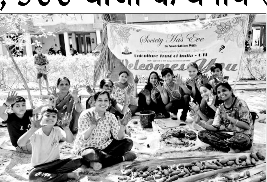
'तुम मुझे बीज दो मैं तुम्हें हरियाली दूँगा' अभियान के तहत बीजों के सीड बम बनाये।