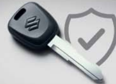
सुपर सुरक्षित, इंजन इमोबिलाइजर के साथ और 18+ सुरक्षा विशेषताएं