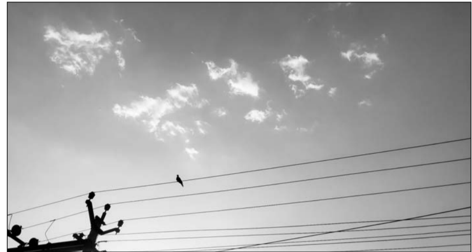
चूरू में शाम ढलने के बाद आसमान में हल्के बादलों की आवाजाही शुरू हुई।

प्री-मानसून ने नहीं दी दस्तक, गर्मी के कारण दिन में बाजारों में पसरा सन्नाटा