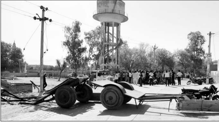
बिजली व पानी की समस्याओं को लेकर सिद्धमुख में ग्रामीण धरने पर बैठे।

सिद्धमुख के ग्रामीणों ने बताया कि भीषण गर्मी में कस्बे के लोगों को बिजली व पानी की किल्लत का सामना करना पड़ रहा है। कहीं बिजली की लाइनों में फाल्ट आ रहा है, तो कहीं वोल्टेज कम आने की समस्या बनी है, तो कहीं पर रात और दिन में कई-कई घंटे तक लगातार बिजली आपूर्ति बाधित रह रही है। इसे लेकर लोगों का गर्मी में बुरा हाल बना है। लोगों को पेयजल की किल्लत से भी जुझना पड़ रहा है। लोग पानी की बूंद-बूंद को तरसने को मजबूर हैं। ग्रामीणों ने कहा कि भीषण गर्मी के प्रभाव से क्षेत्र में तापमान बढ़ता जा रहा है और ऐसे में कस्बे के लोग बिजली-पानी की समस्या से जुझ रहे हैं। गर्मी में लोगों को बिजली और पानी की जरूरत सबसे ज्यादा होती है, लेकिन विद्युत निगम बिजली आपूर्ति देने और