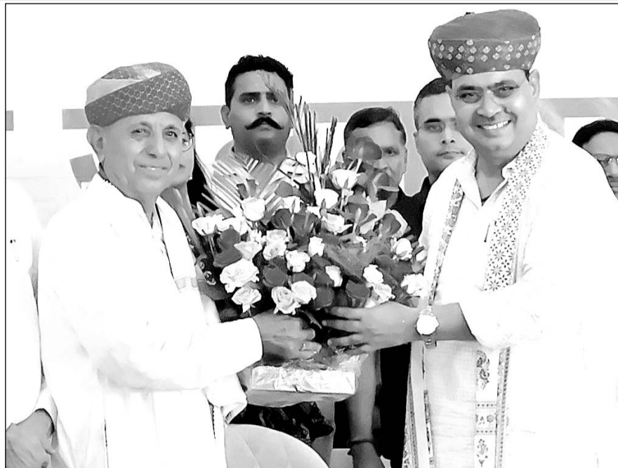
सीएम भजनलाल शर्मा ने केंद्रीय मंत्री भागीरथ चौधरी को जन्मदिन की शुभकामनाएं दी।

समारोह को संबोधित करते हुये उन्होंने कहा कि किसानों के पानी की समस्या को लेकर उदयपुर से बीसलपुर बांध में पानी लाने के लिये विशेष योजना का काम शुरू हो गया है। उन्होंने अजमेर लोकसभा क्षेत्र से भाजपा की जीत के लिये आभार व्यक्त किया। केंद्रीय कृषि राज्य मंत्री भागीरथ चौधरी व आर के मार्बल ग्रुप चेयरमैन अशोक