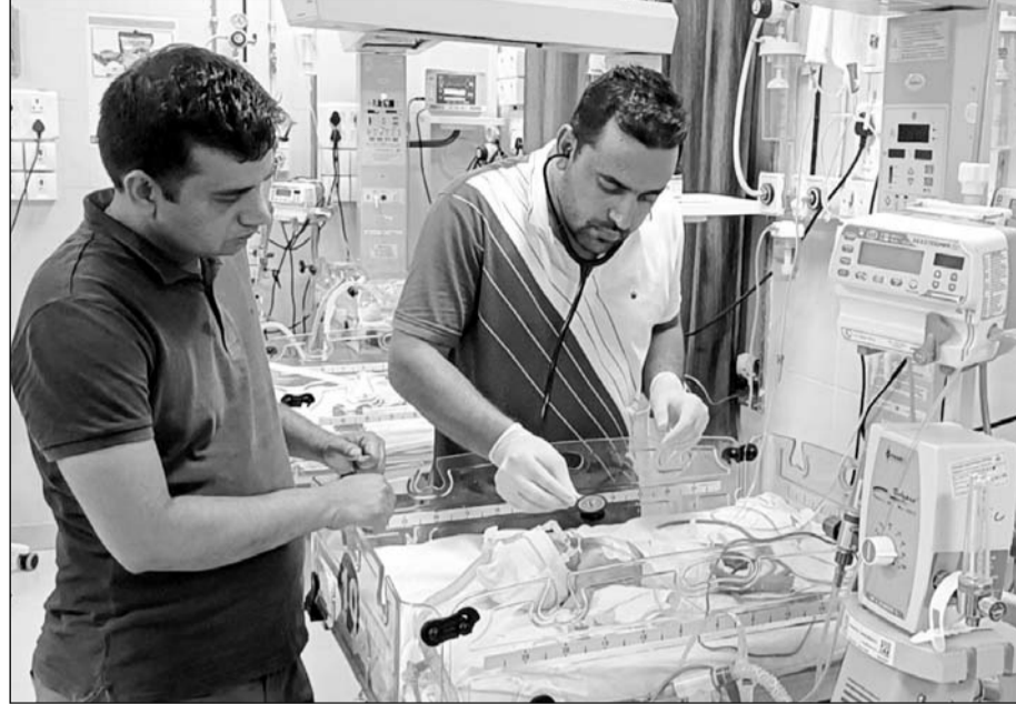
बीडीके अस्पताल के चिकित्सकों ने नवजात बच्चे को बचाने की कोशिश की।

जयपुर ले जाते समय नवजात ने रास्ते में दम तोड़ा