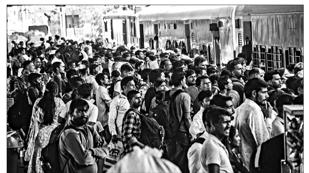
पश्चिमी बंगाल में इसी माह होने वाले चुनाव को देखते हुए जयपुर में रह रहे लोग वापस अपने प्रदेश लौटने लगे हैं। मंगलवार को जयपुर रेलवे स्टेशन पर यात्रियों की भारी भीड़ रही। हालात ऐसे थे कि ट्रेनों में सीटें मिलना तो दूर प्लेटफॉर्म पर खड़े होने की भी जगह नहीं थी।

है, जो हरियाणा और पंजाब के निवासी हैं। पुलिस आरोपियों के कब्जे से 29.850 किलो अवैध डोडा चूरा बरामद किया है। पुलिस ने बताया कि आरोपियों के नेटवर्क और अन्य संभावित साधियों के संबंध में जांच जारी है। साथ ही आमजन से अपील की गई है कि नशे के खिलाफ इस मुहिम में सहयोग करें और अवैध गतिविधियों की सूचना तुरंत पुलिस को दें।