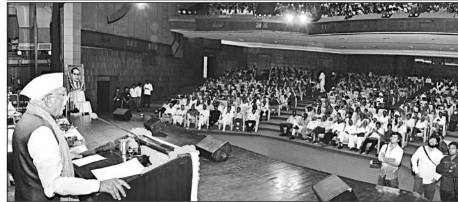
राज्यपाल हरिभाऊ बागडे ने डॉ. भीमराव अम्बेडकर की 135 वीं जयंती पर जयपुर में आयोजित समारोह में संबोधित किया।

डॉ. अम्बेडकर ने देश को सामाजिक समरसता का मंत्र ही नहीं दिया बल्कि राष्ट्र सर्वोच्च है, यह दृष्टि भी दी : हरिभाऊ बागडे