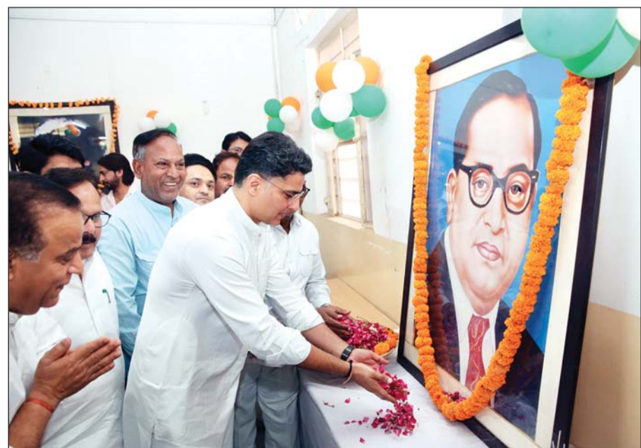
कांग्रेस के राष्ट्रीय महासचिव एवं पूर्व उपमुख्यमंत्री सचिन पायलट ने मंगलवार को प्रदेश कांग्रेस मुख्यालय पर बाबा साहेब की जयंती पर आयोजित पुष्पांजलि कार्यक्रम में शामिल हुए।

और जनगणना जैसे मुद्दों पर पारदर्शिता बनाए रखने के लिए सर्वदलीय बैठक बुलाई जानी चाहिए।