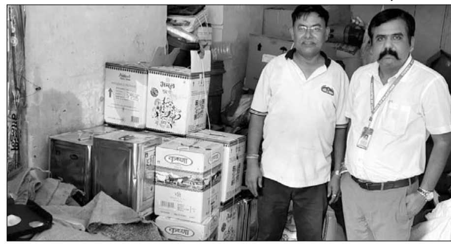
पाली शहर में डेयरी एंड जनरल स्टोर पर घी के नमूने लिये।