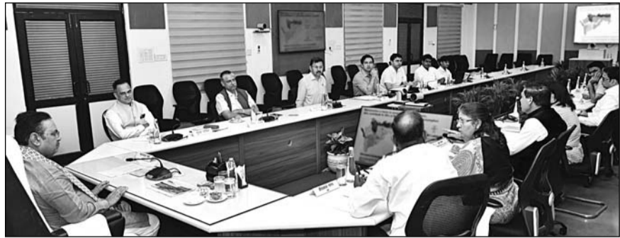
मुख्यमंत्री भजनलाल शर्मा ने मंगलवार को अपने आवास पर ऊर्जा विभाग की बैठक ली।

जयपुर । मुख्यमंत्री भजनलाल शर्मा ने कहा कि बेहतर प्रबंधन एवं दूरगामी निर्णयों के फलस्वरूप प्रदेश की विद्युत उत्पादन क्षमता में उल्लेखनीय वृद्धि दर्ज होने के साथ ही छीजत में कमी आई है। उन्होंने प्रदेश को ऊर्जा के क्षेत्र में आत्मनिर्भर बनाते हुए कृषि एवं घरेलू उपभोक्ताओं तथा उद्योगों को निर्बाध एवं पर्याप्त बिजली सुनिश्चित करने के निर्देश दिए। शर्मा मंगलवार को मुख्यमंत्री निवास पर आयोजित ऊर्जा विभाग की बैठक की अध्यक्षता कर रहे थे।