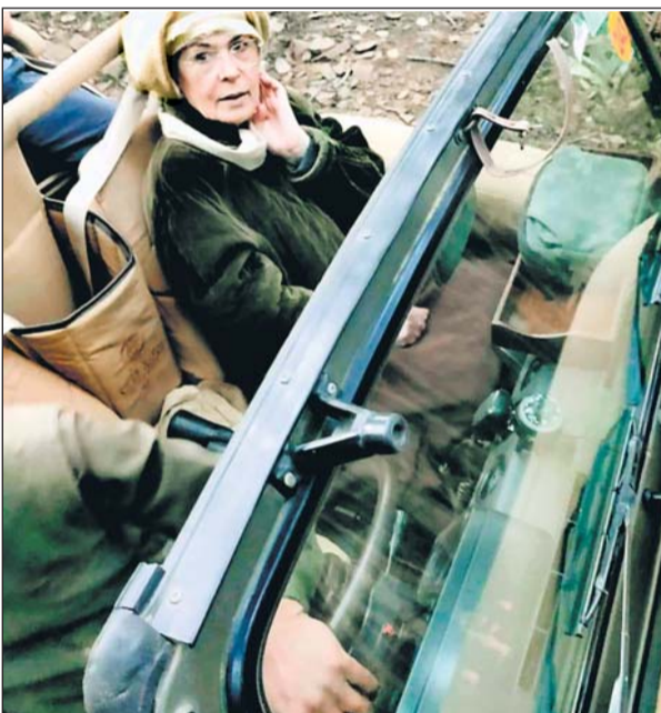
सोनिया गांधी अपना 76वां जन्म दिन मनाते 37 साल बाद अपने बच्चों प्रियंका गांधी और राहुल गांधी के साथ रणथम्भौर आई हैं। सोनिया गांधी 1985 में अपने पति राजीव गांधी के साथ रणथम्भौर घूमने आई थीं।

सवाईमाधोपुर, 9 दिसम्बर (निस)। कांग्रेस की पूर्व राष्ट्रीय अध्यक्ष सोनिया गांधी ने 76वां जन्मदिन अपने परिवार के साथ रणथम्भौर में मनाया। रणथम्भौर में सोनिया गांधी का जन्मदिन सेलिब्रेट करने गत दिवस गांधी परिवार सवाई माधोपुर पहुंचा था। सोनिया गांधी करीब 37 साल बाद रणथम्भौर आई हैं। गौरतलब है कि आज से करीब 37 साल पहले सोनिया गांधी अपने पति पूर्व प्रधानमंत्री राजीव