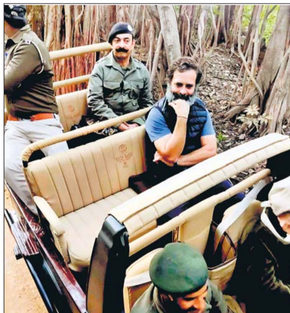
सोनिया गांधी अपना 76वां जन्म दिन मनाते 37 साल बाद अपने बच्चों प्रियंका गांधी और राहुल गांधी के साथ रणथम्भौर आई हैं। सोनिया गांधी 1985 में अपने पति राजीव गांधी के साथ रणथम्भौर घूमने आई थीं।

आई थीं। जोगी महल से राहुल गांधी और सोनिया गांधी वापस होटल लौट आए। शाम को गांधी परिवार ने रणथम्भौर सफारी की और बाघों की अठखेलियां देखी। सोनिया गांधी के जन्मदिन को लेकर रणथम्भौर स्थित पांच सितारा होटल शेर बाग में व्यापक स्तर पर तैयारियां की गई थीं। मुख्यमंत्री अशोक गहलोत, सचिन पायलट, वेणुगोपाल सहित कांग्रेस के बड़े नेताओं ने सोनिया गांधी को जन्मदिन पर शुभकामनाएं दीं। बताया जाता है कि इसके बाद सोनिया गांधी और प्रियंका गांधी दोनों संभवतया राहुल गांधी की भारत जोड़ो यात्रा में शामिल होंगी। गांधी परिवार की सुरक्षा को लेकर होटल शेरबाग में भारी सुरक्षा व्यवस्था की गई थी। समूचे क्षेत्र को छावनी में तब्दील कर दिया गया और चप्पे चप्पे पर पुलिस बल तैनात किया गया। मोडिया को भी करीब दो किलोमीटर दूर ही रोक दिया गया। बिना इजाजत किसी को आगे जाने की अनुमति नहीं है।