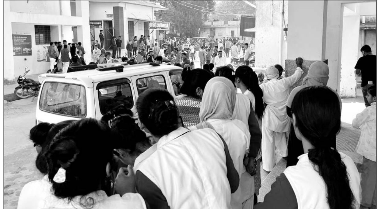
परिजनों द्वारा चिकित्साकर्मों से मारपीट करने के बाद अस्पताल में प्रदर्शन करते चिकित्साकर्मियों।

सूचना पर पहुंचे कोतवाली थानाधिकारी ने भी दोनों पक्षों से बात