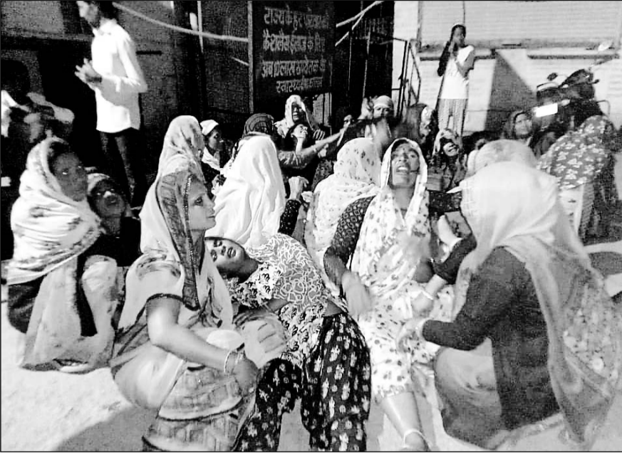
हादसे के सूचना मिलने पर परिवारजन बिलख पड़े और महिलाओं में कोहराम मच गया।