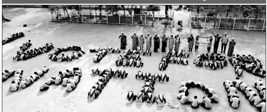
राजकीय उच्च माध्यमिक विद्यालय, सुभाष नगर में बालक बालिकाओं द्वारा श्रृंखला बनाकर “वोट फॉर नेशन” का संदेश दिया गया।

एक हजार छात्र-छात्राओं ने मैदान में छात्र श्रृंखला बनाई