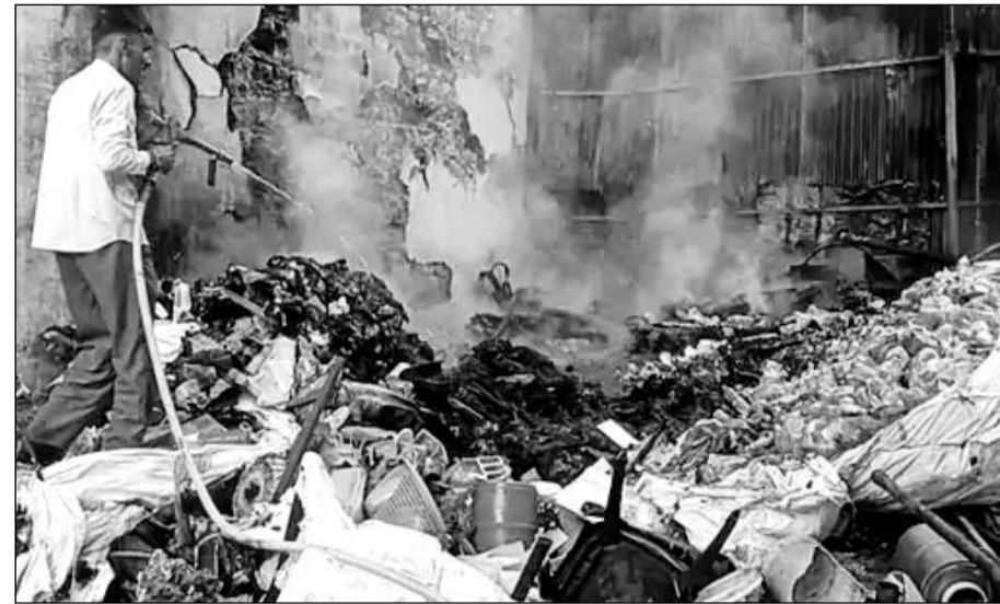
गंगापुर सिटी में कबाड़ के गोदाम में लगी आग दमकलकर्मियों ने बुझाई।