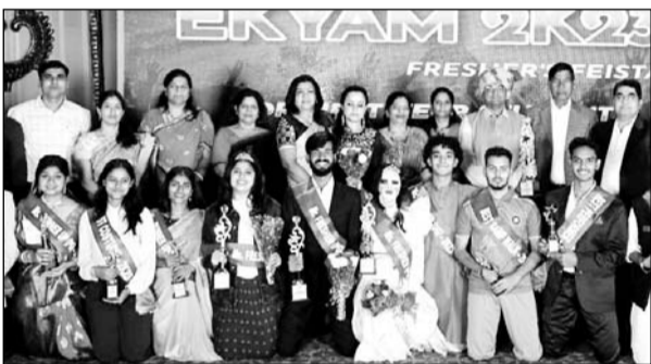
गिट्स में फ्रेशर पार्टी आयोजित हुई।

उदयपुर, (कासं)। गीतांजली इन्स्टिट्यूट ऑफ टेक्निकल स्टडीज डबोकउदयपुर में बोटिंग ए बी सी ए एम सी ए एवं एट्क ए बी ए प्रथम वर्ष सत्र 2023-24 के विद्यार्थियों की फ्रेशर पार्टी का आयोजन द्वितीय वर्ष के विद्यार्थियों द्वारा किया गया। जिसमें सभी विभाग के विद्यार्थियों ने उत्साहपूर्वक भाग लेकर कार्यक्रम का आनन्द उठाया।