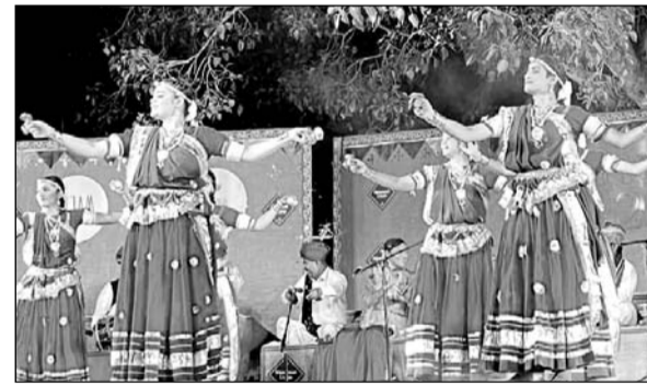
बीकानेर के मोमासर कस्बे में आयोजित “मोमासर उत्सव” में कलाकारों ने एक से बढ़कर एक प्रस्तुति दी।

उत्सव अनूठा इसलिए भी है क्योंकि इसका आयोजन गांव की हवेलियों में, खुले रेगिस्तानी मैदान में, गांव के जोड़ड़ जैसी सहज और सुंदर