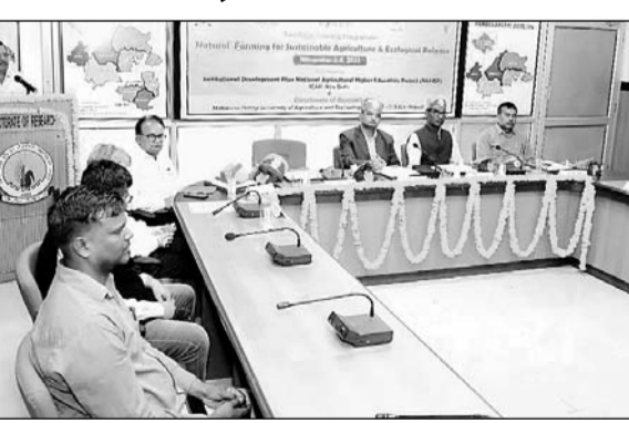
प्राकृतिक खेती पर दो दिवसीय प्रशिक्षण आयोजित हुआ।