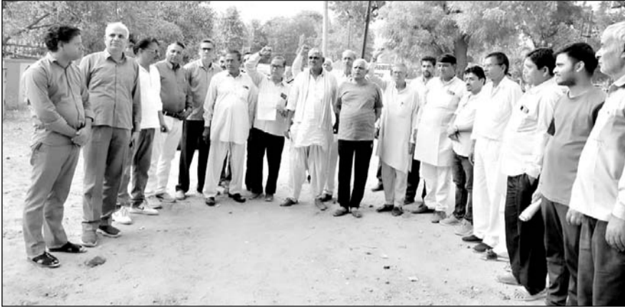
कांग्रेस कार्यकर्ताओं ने खेतड़ी में उपखंड कार्यालय के सामने एकत्रित होकर प्रदर्शन किया।