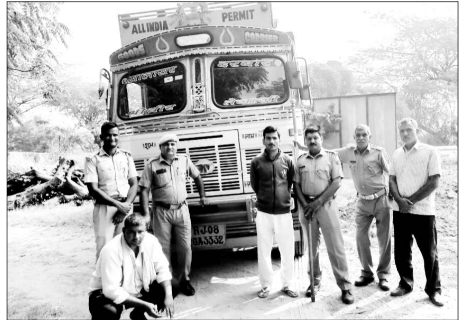
सागा गांव के पास नाकाबंदी में रोहिड़ा की लकड़ियों से भरा ट्रक जब्त का एक जने को गिरफ्तार किया।