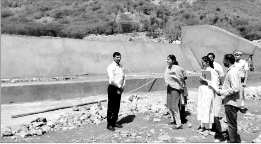
जिला कलैक्टर डॉ. आर्तिका शुक्ला अलवर में विभिन्न विकास कार्यों का निरीक्षण कर निर्देश दिये।

जिला कलैक्टर ने एनीकट निर्माण कार्यों का निरीक्षण कर नगर निगम आयुक्त को निर्देश दिये कि निर्माण कार्यों में गुणवत्ता का विशेष ध्यान रखते हुए इन्हें समयबद्धता से पूर्ण करावें, जिससे वर्षाऋतु के दौरान जल का संचयन होने के साथ भू-जल स्तर में वृद्धि हो सके। उन्होंने निर्देश दिये कि शहर में आवश्यकतानुसार स्थानों का चिह्निकरण कर जल संचयन की संरचनाओं का निर्माण