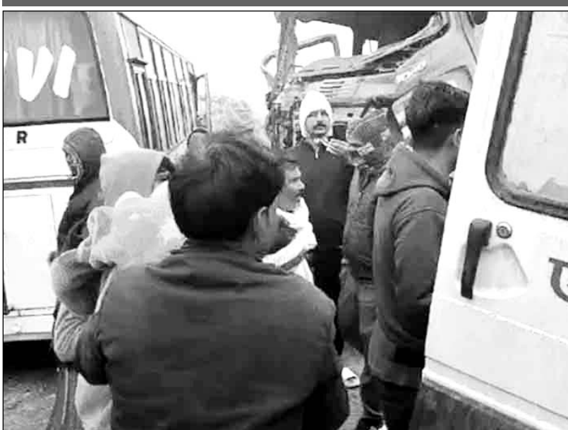
स्थानीय नागरिकों ने घायलों को बाहर निकालकर अस्पताल पहुंचाया।

पुलिस ने स्थानीय नागरिकों की सहायता से घायलों को नसीराबाद अस्पताल पहुंचाया