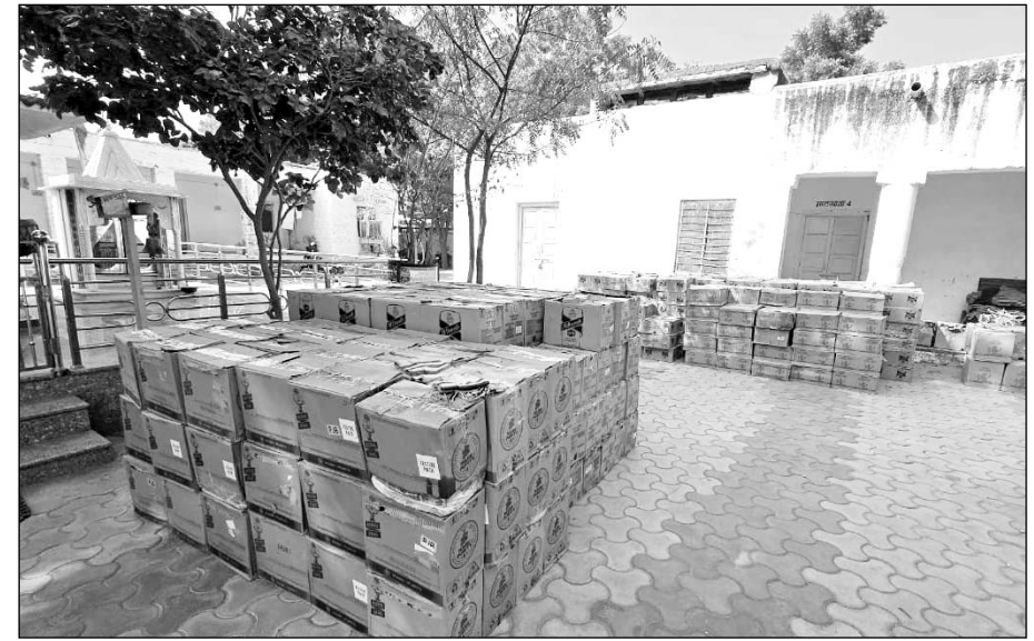
सायला पुलिस ने अवैध शराब सहित एक आरोपी को गिरफ्तार किया।

जालोर, (कास)। जालोर जिले के सायला थाना पुलिस व डीएसटी सांचौर ने रविवार को पंजाब निर्मित अवैध अंग्रेजी शराब की विभिन्न ब्रांड की 500 पेट्टी, अवैध शराब परिवहन में प्रयुक्त ट्रक जब्त किया। वहीं एक आरोपी को गिरफ्तार किया। पकड़ी गई अवैध शराब को बाजार कीमत करीब 40 लाख आंकी गई है।