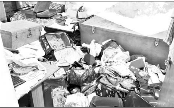
चोरी की वारदात के बाद घर में सामान बिखरा पड़ा है।

डूंगरपुर, (निर्स)। जिले के कोतवाली थानान्तर्गत डूंगरपुर शहर की पत्रकार कॉलोनी में चोरों ने एक डॉक्टर के सूने मकान को अपना निशाना बनाया है। चोरों द्वारा घर के अन्दर का सारा सामान बिखेर कर नगदी सहित जेवरात चुराकर ले जाने की आशंका जताई जा रही है। पीड़ित परिवार जयपुर गया हुआ है। परिवार के आने के बाद चोरी हुए सामान की पूरी जानकारी का पता लग पायेगा। वारदात के बाद सूचना पर पहुंची कोतवाली पुलिस मामले की जांच में जुटी है।