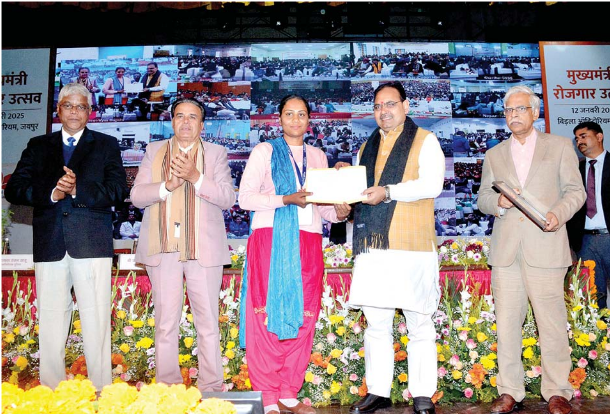
मुख्यमंत्री भजनलाल शर्मा ने बिड़ला ऑडिटोरियम में चतुर्थ मुख्यमंत्री रोजगार उत्सव एवं लोकार्पण, शिलान्यास कार्यक्रम को संबोधित किया। इस अवसर पर उन्होंने 13 हजार 500 युवाओं को नियुक्ति पत्र दिये।