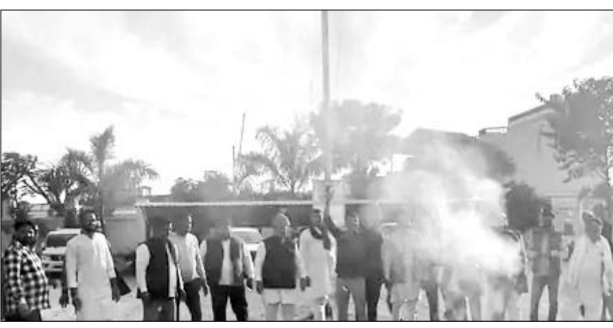
पटाखे चलाकर जीत का जश्न मनाते भाजपा कार्यकर्ता।