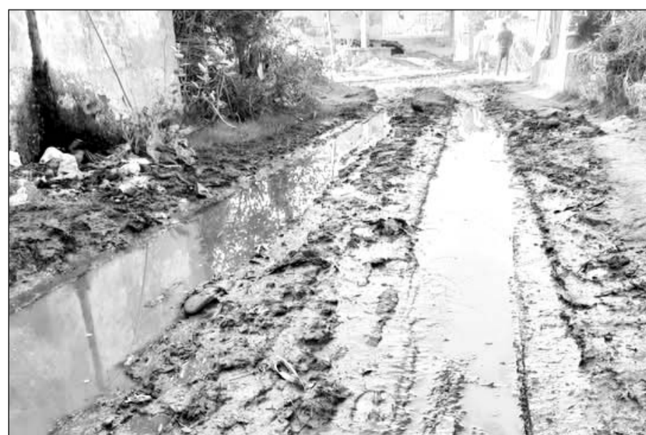
पनियाला के आम रास्तों पर जमा कीचड़ लोगों के लिये परेशानी का सबब बना हुआ है।

समस्या का सामना करना पड़ता है। आये दिन ग्रामीण इसमें गिरकर चोटिल होते रहते हैं, जिसको लेकर ग्रामीणों द्वारा कई बार नगर परिषद व जिला कलेक्टर से लेकर जनप्रतिनिधियों व स्थानीय