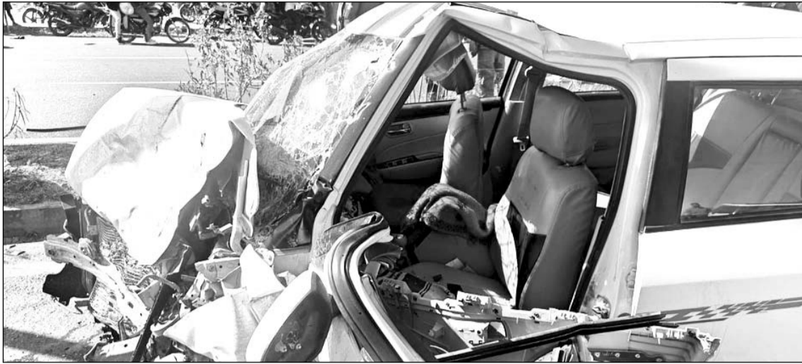
उदयपुर जिले के बडला गांव में हुये हादसे में कार क्षतिग्रस्त हो गई।

■ खेरवाड़ा में गृह प्रवेश कार्यक्रम से डूंगरपुर लौट रहा था कार सवार परिवार