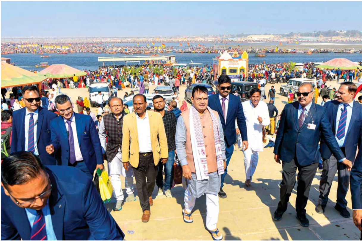
मुख्यमंत्री भजनलाल शर्मा व मंत्रिपरिषद् के सहयोगियों एवं विधायकों ने शनिवार (एकादशी) को प्रयागराज महाकुंभ में त्रिवेणी घाट संगम में स्नान किया।