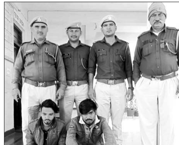
नाकाबंदी के दौरान पुलिस ने दो तस्करो को पकड़ा।

शहर एसपी ने बताया कि ऑपरेशन नश्वर अभियान के तहत रानपुर पुलिस टीम ने नाकाबंदी के दौरान कार्यवाही करते हुए अवैध मादक पदार्थ स्मैक सहित दो तस्करो को गिरफ्तार किया है। शहर एसपी ने बताया कि रानपुर के पुलिस निरीक्षक