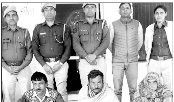
पुलिस ने मारपीट के वायरल वीडियो मामले में तीन जनों को पकड़ा।