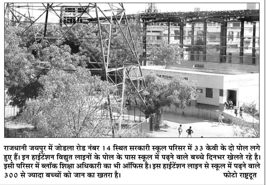
राजधानी जयपुर में जोडाला रोड नंबर 14 स्थित सरकारी स्कूल परिसर में 33 केवी के दो पोल लगे हुए हैं। इन हाईड्रेशन विद्युत लाइनों के पोल के पास स्कूल में पढ़ने वाले बच्चे दिनभर खेलते रहे हैं। इसी परिसर में ब्लॉक शिक्षा अधिकारी का भी ऑफिस है। इस हाईड्रेशन लाइन से स्कूल में पढ़ने वाले 300 से ज्यादा बच्चों को जान का खतरा है।