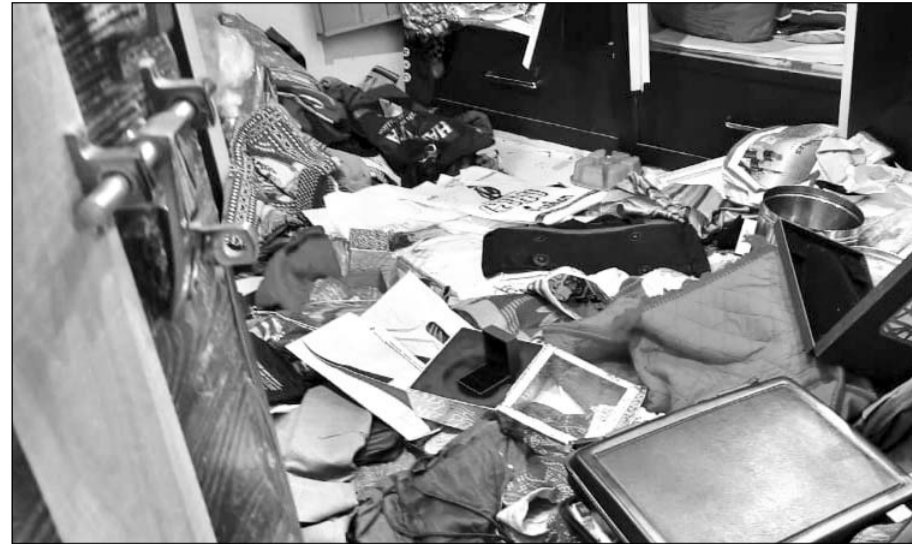
चोरी की वारदात के बाद घर में सामान बिखरा पड़ा है।

पूरा परिवार गत पांच फरवरी को कुंभ के लिए गया था, पिछे से हुई चोरी की वारदात