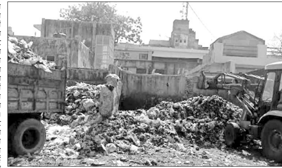
अजमेर के गंज क्षेत्र के मुख्य मार्ग पर लगा गंदगी का ढेर।

अजमेर, (निर्सं)। स्मार्ट सिटी कहलाने वाले अजमेर शहरभर में सरकारी आवासीय योजनाओं व कॉलोनियों में खाली पड़े भूखंडों सहित शहर के मुख्य मार्गों पर खाली स्थानों पर मिट्टी और निर्माण सामग्री का मलबा डाला जा रहा है। इससे न केवल आस-पड़ोस में गंदगी फैल रही है, बल्कि शहर की स्वच्छता रैंकिंग पर भी प्रतिकूल असर पड़ रहा है। अजमेर शहर की स्वच्छता रैंकिंग में गिरावट की सबसे बड़ी वजह सरकारी मशीनरी की लापरवाही और आमजन की उदासीनता व जागरूकता में कमी है। वहीं गंज क्षेत्र में बना कचरा डिपो शहर की स्वच्छता में कौट में खाज का काम कर रहा है। कमोवेश शहर भर में यही स्थिति बनी हुई है। तो वहीं आज भी शक्ति नगर वार्ड नम्बर में 54 की कई गलियों में डोर टू डोर कचरा संग्रहण करने वाला ऑटो टैपर नहीं आता है, जिसके कारण क्षेत्रवासी कचरा कॉलोनियों के खाली प्लाटों में ही डाल देते हैं, जिसके कारण गंदगी का आलम बना हुआ है।