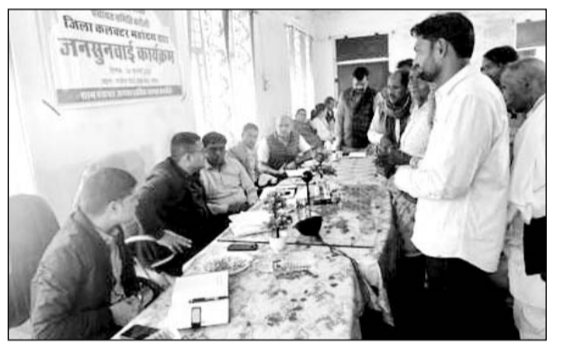
परीता में जनसुनवाई करते अधिकारी।