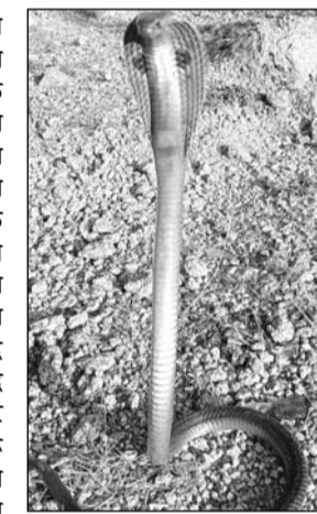
सिंह ने तुरंत अपने अनुभवों से सावधानीपूर्वक उसे पकड़ लिया।

ब्यावर, (निर्सं)। उदयपुर रोड, चुंगी नाके के पास एफसीआई गोदाम में काम कर रही महिला श्रमिक को अचानक कोबरा सांप दिखाई देते ही भयभीत होकर और डर के मारे चिल्लाई। महिला श्रमिक की आवाज सुनकर अन्य श्रमिक भी सचेत हो गए और तुरंत एक