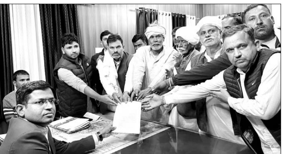
नई पंचायत गठन के लिए एसडीएम को ज्ञापन सौंपते ग्रामीण।