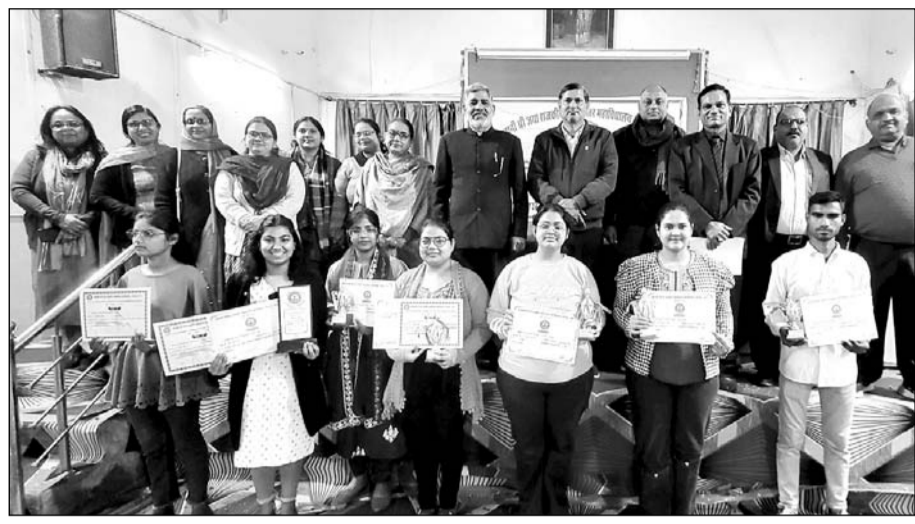
सांस्कृतिक सप्ताह के तहत साहित्यिक एवं सांस्कृतिक समिति ने दिये प्रतियोगी विजेताओं को पुरस्कार।