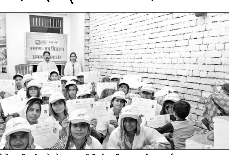
ठेई में 10 दिवसीय होममेड अगरबत्ती निर्माण प्रशिक्षण कार्यक्रम का बैच का समापन हुआ।