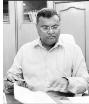
कलेक्टर रामावतार मीणा

झुंझुनूं, (निर्स)। नवनियुक्त जिला कलेक्टर रामावतार मीणा ने शनिवार को पदभार ग्रहण कर लिया है। उन्होंने जिलेवासियों को गणेश चतुर्थी की