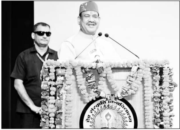
कार्यक्रम को लोकसभा अध्यक्ष ओम बिरला ने संबोधित किया।

इस अवसर पर पंडित श्रीराम शर्मा आचार्य और माता भगवती देवी को नमन करते हुए बिरला ने कहा कि उन्होंने आजीवन कलियुग के बीच एक नया सत्य युग लाने के लिए कार्य किया। संगठन की शुरुआत के दिनों का स्मरण करते हुए बिरला ने बताया कि पंडित श्रीराम शर्मा आचार्य और माता भगवती देवी के अटल संकल्प से गायत्री परिवार एक ऐसे केंद्र के रूप में विकसित हुआ जिससे लाखों लोगों के जीवन में एक नई ऊर्जा का संचार हुआ। उन्होंने ज्ञान का प्रचार-प्रसार करने और राष्ट्र को जागृत करने के यात्रा के मिशन की सराहना की। राष्ट्र निर्माण में