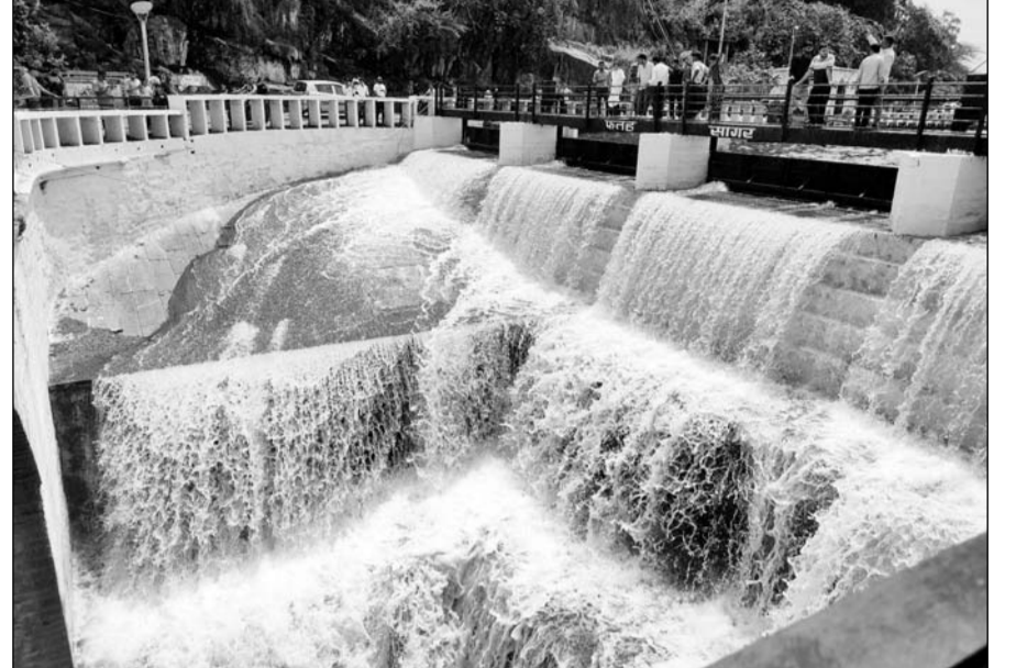
उदयपुर की फतहसागर झील छलकने पर इसके चारों गेट 6-6 इंच खोल दिए गए।