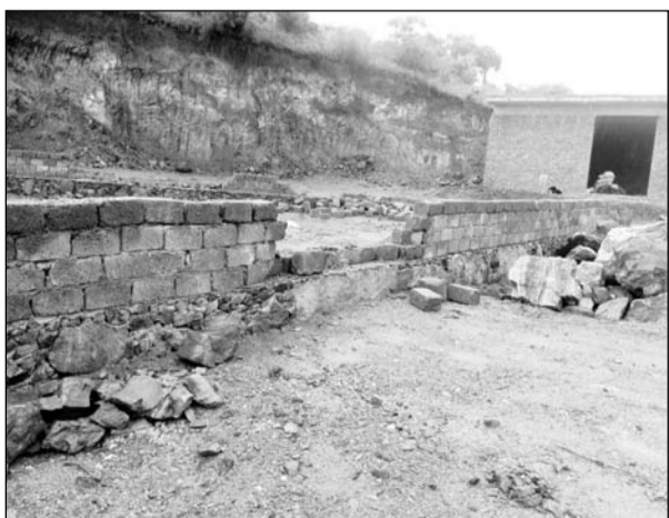
गणेश वाटिका की टूटी हुई चार दीवारी।