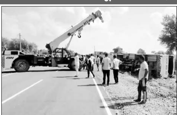
पलटी हुई राजस्थान रोडवेज बस को क्रेन की सहायता से हटवाया।

गनीमन रही कि बस 11 हजार केटी के पोल से टकराती हुई बच गई