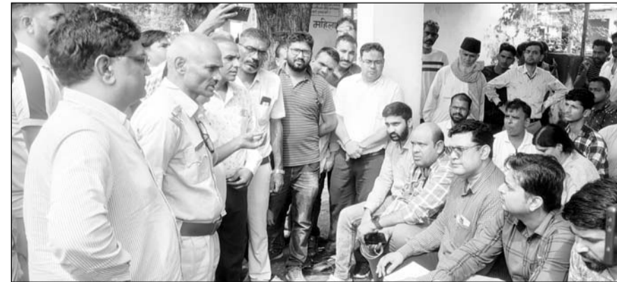
बिजयनगर के राजकीय उप जिला चिकित्सालय में प्रदर्शन करते चिकित्साकर्मियों से पुलिस और प्रशासन के अधिकारियों ने समझाइश की।