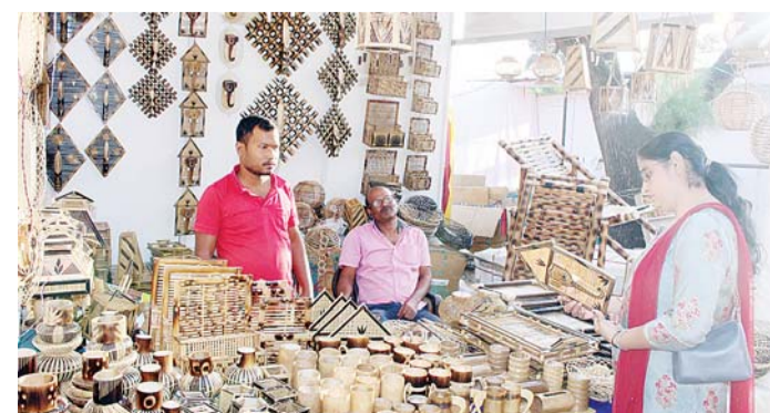
Bamboo products from Assam.

In the evenings from 6.30 pm onwards, the amphitheatre of the Kendra, Madhyavarti comes alive with the music and dance performances of folk performances of various states. In all, artistes of as many as 22 states such as Uttar Pradesh, Madhya Pradesh, Andhra Pradesh, Himachal Pradesh, Haryana, Manipur, Gujarat etc. are participating. Many diverse dance forms like Ghoomar, Bhangra, Chari, Jhoomar, Dandiya Raas, Gangaur, Lavani, among others, are being presented at the festival. During the afternoons, the Shilpgram area of the Kendra is filled with the melodious tunes of Shehnai-nagada, Teen Dhol, Kathputli, Algoza, Behrupiya, Kalbelia, etc. This year as a fun element, various questions are also ad-