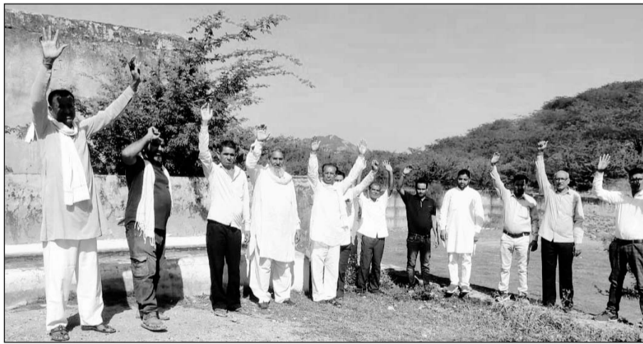
पपुरना गांव के ग्रामीणों ने तालाब पर कब्जे के विरोध में प्रदर्शन किया।

लगाया है। विरोध कर रहे ग्रामीणों ने बताया कि पपुरना से डाबला जाने वाली सड़क पर दहलासरी के नाम से ऐतिहासिक तालाब है। जिसे दहलासरी (महाजन) समाज के लोगों ने करीब चार सौ वर्ष पूर्व बनाया था। इस तालाब पर पूर्व में शिवराज के भले पर कुस्ती का आयोजन होता था तथा तारबंदी के त्योंहार पर नवविवाहित जोड़े झुला झुलने की परंपरा भी थी। तालाब के पास में सती