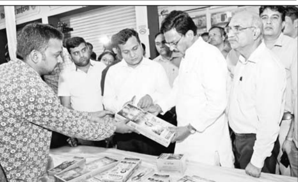
सहकारिता मंत्री उदयलाल आंजना ने पटाखों का निरीक्षण किया।

इस अवसर पर आंजना ने कहा कि सहकारिता गुणवत्ता का प्रतीक है और आमजन को बेहतर सुविधाएं उपलब्ध कराने के लिए समय-समय पर ऐसे आयोजन किए जाते हैं ताकि लोगों को गुणवत्तापूर्ण वस्तुएं एवं सुविधाएं उचित मूल्य पर प्राप्त हो सकें। उन्होंने कहा कि उपभोक्ता संघ की अपनी एक विशेष साख है और जिलों के उपभोक्ता भाण्डारों पर भी ऐसे मेले लगाए गए हैं ताकि सहकारिता के माध्यम से शुद्धता लोगों के घर तक पहुंच सके। सहकारिता मंत्री ने कहा कि मेले का मुख्य आकर्षण