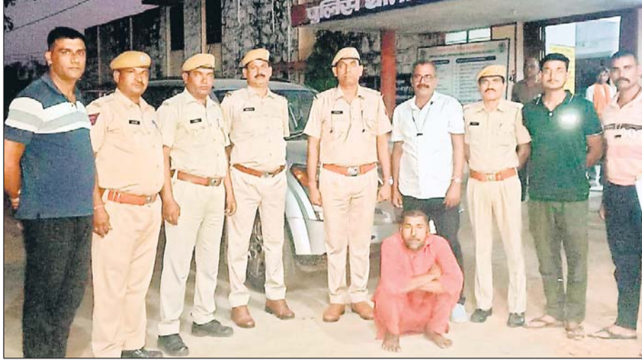
पुलिस थाना घाड़ ने अवैध डोडा-पोस्ट के साथ आरोपी को पकड़ा।