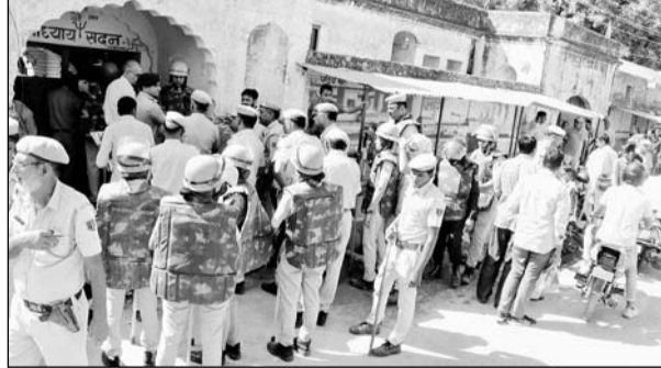
चुरू में मंत्रियों की छतरियों पर चालीस साल से चल रहे अतिक्रमण को न्यायालय के आदेश पर प्रशासन ने हटाया।

चुरू, (कास)। न्यायालय के आदेश से मंत्रियों की छतरियों में पिछले चालीस सालों काबिज किरायेदारों को जिला प्रशासन में बेदखल किया। चुरू जिला मुख्यालय पर झारिया मोरी स्थित मंत्रियों की छतरियों के नाम से स्थित दुकानदारों को व सार्वजनिक बाड़ों पर दुकान और पकान बनाकर निवास करने वाले दो दर्जन से अधिक परिवारों को नगर परिषद चुरू, पुलिस जाप्ता व