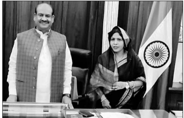
अवैध खनन के मामले को लेकर बिरला से मिली सांसद कोली।

भरतपुर लोकसभा क्षेत्र में हो रहे अवैध खनन को लेकर सांसद रंजीता कोली ने लोकसभा स्पीकर को अवगत कराया कि भरतपुर क्षेत्र में अवैध खनन रुकने का नाम नहीं ले रहा है और आए दिन घटनाएं होती रहती हैं। जिनमें मजदूरों की जानें तक चली जाती हैं। वहीं जिला पुलिस अधीक्षक श्याम सिंह की कार्यशैली को लेकर भी शिकायत की। भरतपुर के गोपालगढ़ थाना क्षेत्र में भी हो रहे अवैध खनन से गत दिनों पहाड़ गिरने से दो मजदूरों की मौत हो गई थी। वहां पहुंचे मलबे के हटवाने की मांग भी सांसद ने लोकसभा स्पीकर