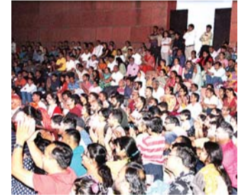
A full house at the cultural performances of Lokrang.

Adding to the vibrant and glittering hues of the festive season the annual cultural festival of Jajpur's art and culture center, Jawahar Kala Kendra (JKK) - 'Lokrang' is showcasing the folk art, craft and culture of India at its absolute best. Now in its 25th edition, the 11-day Lokrang which began on 10 October, is witnessing myriad dance and music performances as well as a rich display of handicrafts of several artists on a daily basis. It is noteworthy that a whopping 3000 artistes from as many as 22 states of the country are performing across 11 days. Around 170 artisans, who are award-winning ones, are also showcasing their hand-