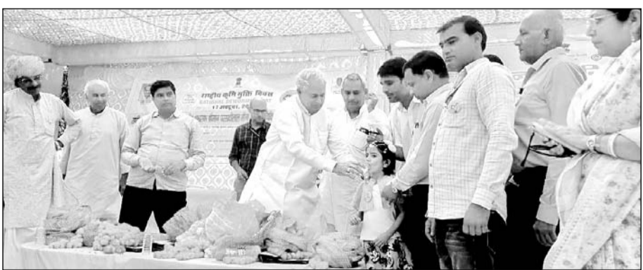
लालसोट के बगड़ी ग्राम स्थित सामुदायिक स्वास्थ्य केंद्र से चिकित्सा एवं स्वास्थ्य मंत्री परसादी लाल मीणा ( बीच में ) ने राष्ट्रीय कृमि मुक्ति दिवस का बालक को दवा पिलाकर राज्य स्तरीय शुभारंभ किया।

लालसोट, (निर्स)। उपखंड क्षेत्र के बगड़ी ग्राम स्थित सामुदायिक स्वास्थ्य केंद्र से चिकित्सा एवं स्वास्थ्य मंत्री परसादी लाल मीणा द्वारा राष्ट्रीय कृमि मुक्ति दिवस का बालक को दवा पिलाकर राज्य स्तरीय शुभारंभ कर कार्यक्रम का आगाज किया गया। इस दौरान चिकित्सा मंत्री मीणा द्वारा पाच करोड़ लागत से बनने वाले बगड़ी सामुदायिक स्वास्थ्य केंद्र सहित विभिन्न ग्राम पंचायतों में बनने वाले प्रति 41 लाख लागत से बनने वाले नए उप स्वास्थ्य केंद्र भवनों के भवन निर्माण की आधारशिला रखकर शिलान्यास किया। मीणा ने बताया कि कृमि संक्रमण से बच्चों में खून की कमी हो जाती है और वे कुपोषण का शिकार हो जाते हैं। इस कारण वे हमेशा थका महसूस करते हैं जो कि संवर्धन शक्ति को घटाकर विकास में बाधक होता है। इसलिए 1 से 19 साल तक के सभी बच्चों व किशोर किशोरियों को कृमि नाशक दवा अवश्य