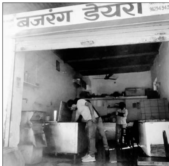
किलोग्राम सहित 549 किलो नकली घी पाया गया।

फैक्ट्री में नकली घी बनाने के लिए रिफाइंड, सोयाबीन तेल के तीन टोन, एक टोन वनस्पति, 42 खाली टोन, प्लेवर्क की 500 मिलीलीटर की बोतल, गैस बॉट, स्टील की टंकी, पैकिंग मशीन, खाली थैलियां एवं रेपर आदि सामान पाया गया। इसके अलावा टीम को मौके पर सरस ब्रांड का आधा टोन एवं कृष्णा ब्रांड का 1 लीटर के 160 व आधा लीटर के 110 पैकेट, 1 लीटर के 234 पैकेट एवं 1 टोन 15