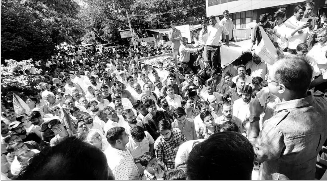
सांगानेर क्षेत्र की 400 कॉलोनियों के हजारों लोगों ने सोमवार को ग्रेटर निगम मुख्यालय पर विरोध प्रदर्शन किया।