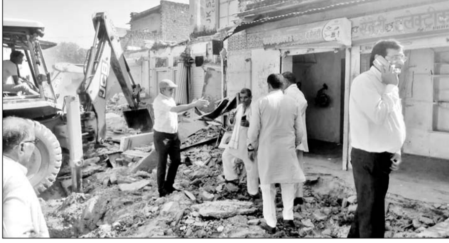
पावटा में प्रशासन की मौजूदगी में अतिक्रमण हटवाया।

पावटा, (निर्स)। पावटा पंचायत समिति की ग्राम पंचायत मंडा में बस स्टैंड की भूमि पर सोमवार को अतिक्रमण हटाने की कार्यवाही की गई। राजस्व व पुलिस की मौजूदगी में बस स्टैंड पर बने टॉन शेड व पक्के निर्माण को हटाया गया। 12 बजे से शुरू हुई अतिक्रमण हटाने की कार्यवाही के दौरान कुछ लोगों ने विरोध दर्ज कराया गया, लेकिन अमले की सख्ती के आगे उनकी एक नहीं चली।