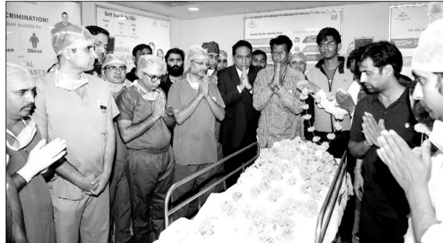
गीतांजली मैडिकल कॉलेज एवं हॉस्पिटल में हुआ केडेवेरिक अंगदान।

डॉक्टरों की टीम द्वारा परिवार वालों को अंगदान करने की सलाह दी गयी। परिवार वालों ने मिलकर अंगदान करने का निर्णय लिया। गीतांजली हॉस्पिटल की टीम के साथ समन्वय बनाया गया। गीतांजली हॉस्पिटल में ऑर्गन ट्रांसप्लान्टेशन की