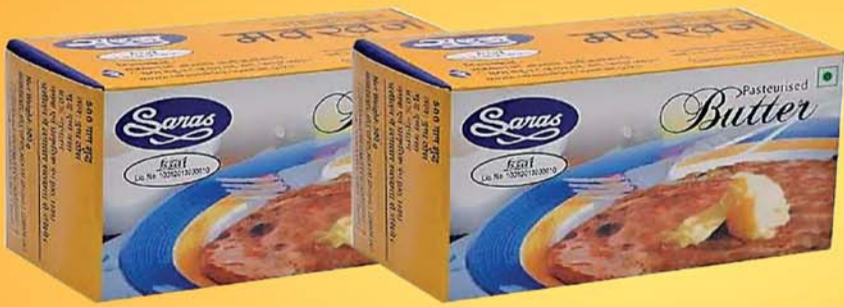
बटर - 100 ग्राम, 500 ग्राम व्हाइट बटर - 15 कि.ग्रा. के स्लेब्स में उपलब्ध