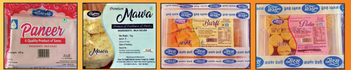
पनीर 200 ग्राम एवं 1 कि.ग्रा. फीका मावा 200 ग्राम एवं 1 कि.ग्रा. बर्फी 250 ग्राम एवं 500 ग्राम पेड़ा 250 ग्राम एवं 500 ग्राम पैकिंग में उपलब्ध