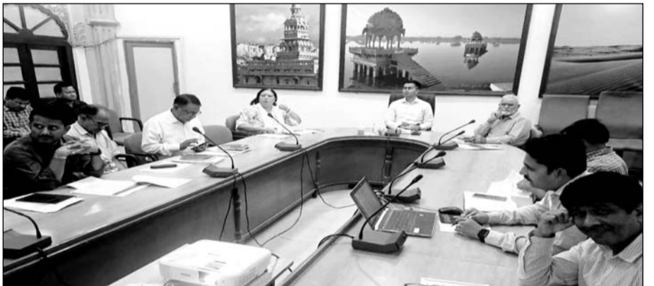
जैसलमेर में जिला कलेक्टर प्रतापसिंह ने अधिकारियों की साप्ताहिक समीक्षा बैठक ली।

जैसलमेर, (नि.सं.)। जिला कलेक्टर प्रतापसिंह ने मुख्यमंत्री बजट घोषणा में भूमि आवंटन के प्रकरणों की विस्तार से समीक्षा की एवं कहा कि आधिकारिक घोषणाओं में भूमि आवंटन कर दी गई है लेकिन अभी भी जिस विभाग ने बजट घोषणा में भूमि आवंटन नहीं करवाई है वे तत्काल ही भूमि आवंटन करवा दें। जिला कलेक्टर सिंह ने सोमवार को जिला कलेक्टरी सभागार में विभागीय गतिविधियों की साप्ताहिक समीक्षा बैठक के दौरान यह निर्देश दिए कि सम्पर्क पोर्टल में दर्ज प्रकरणों के