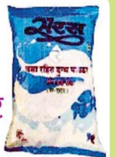
1. स्कोमड मिल्क पाउडर 3 ग्राम, 5 ग्राम, 8 ग्राम, 500 ग्राम, 25 कि.ग्रा. पैकिंग 2. डेयरी व्हाइटनर - 400, 1 कि.ग्रा., 25 कि.ग्रा. पैकिंग 3. हॉल मिल्क पाउडर - 25 कि.ग्रा. पैकिंग 4. बेबी फूड पाउडर - 500 ग्राम, 1 कि.ग्रा. टिन पैकिंग