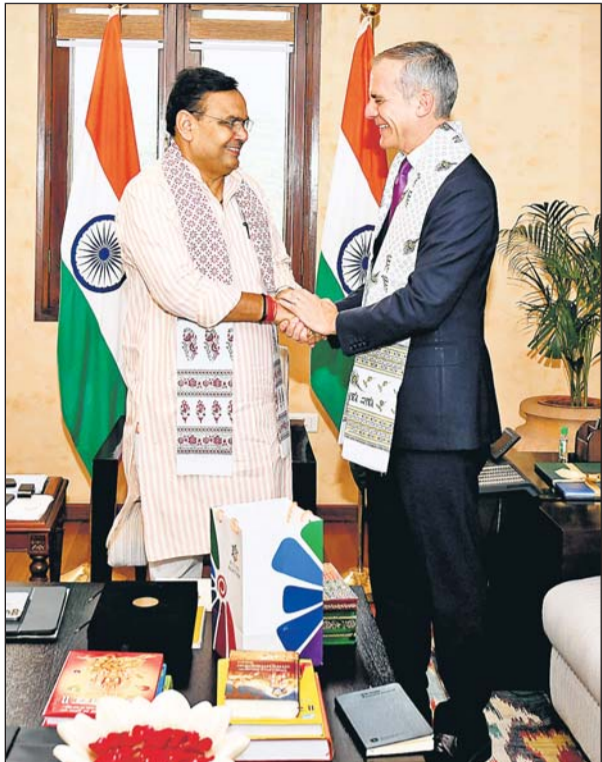
मुख्यमंत्री भजनलाल शर्मा ने सोमवार को मुख्यमंत्री कार्यालय में, भारत में अमेरिकी राजदूत एरिक गासेंटी से मुलाकात की तथा उन्हें एवं अमेरिकी निवेशकों को राजदूत राजस्थान ग्लोबल इन्वेस्टमेंट समिट में आमंत्रित किया।

मुख्यमंत्री ने राज्य में जलवायु, सतत विकास, ग्रीन टेक्नोलॉजी, स्वास्थ्य सेवा और चिकित्सा अनुसंधान, पर्यटन सहित विभिन्न क्षेत्रों में अमेरिकी साझेदारी एवं सहयोग पर जोर दिया। शर्मा ने राजस्थान में अमेरिकी विश्वविद्यालयों के कैम्पस खोलने, जी.सी.सी. एवं डेटा सेक्टर के क्षेत्र में भी काम करने के लिए उन्हें आमंत्रित किया। अमेरिकी राजदूत ने