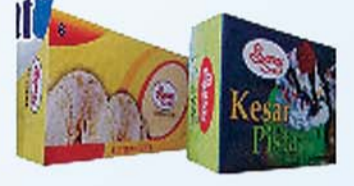
आईसक्रीम त्रिक फेमिली पैक वनीला, केसर पिस्ता, स्ट्रॉबेरी, बटर स्कोव फ्लेवर्स