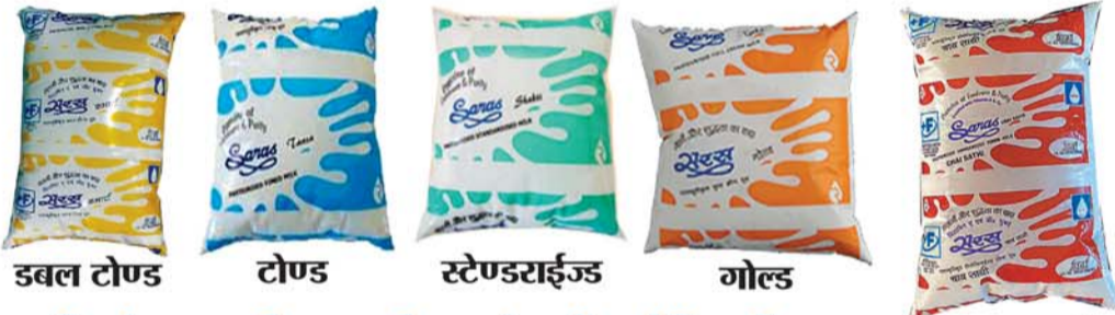
डबल टोण्ड 200 मि.ली., 1/2 लीटर, 1 लीटर एवं 6 लीटर पैकिंग में उपलब्ध टोण्ड 200 मि.ली., 1/2 लीटर, 1 लीटर एवं 6 लीटर पैकिंग में उपलब्ध स्टेण्डराईज्ड 200 मि.ली., 1/2 लीटर, 1 लीटर एवं 6 लीटर पैकिंग में उपलब्ध गोल्ड 200 मि.ली., 1/2 लीटर, 1 लीटर एवं 6 लीटर पैकिंग में उपलब्ध चाय साथी 200 मि.ली., 1/2 लीटर, 1 लीटर एवं 6 लीटर पैकिंग में उपलब्ध