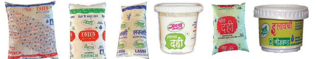
साद छाछ 500 मि.ली. नमकीन छाछ 200 मि.ली. लस्सी 200 मि.ली. दही (कप) 200 ग्राम दही (पाउच) 500 ग्राम श्री खण्ड 100 ग्राम / 500 ग्राम पैकिंग में उपलब्ध