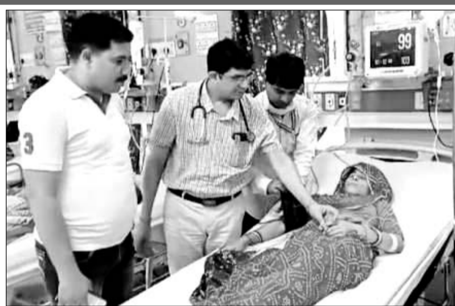
सांप के काटने से अचेत महिला को अस्पताल में भर्ती कराया।

मांची गांव में लगातार हो रही सर्पदंश की घटनाओं को देखते हुए क्षेत्रीय वन अधिकारी ने बताया कि गांव में सांपों की अधिकता की सूचना पर चार कार्मिकों की टीम गठित की गई और करीब आधा दर्जन से अधिक सांपों को पड़कर सुरक्षित जंगल में छोड़ा गया। यही नहीं करौली जिला पुलिस अधीक्षक वृजेश ज्योति उपाध्याय के निवास पर रिकवार को लोन में एक लंबा सांप निकला, जिससे अफरा-तफरी सी मच गई। पास ही