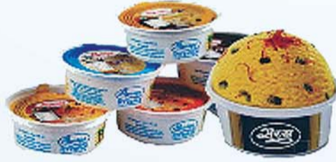
बटर स्कोव, केसर पिस्ता, काजू द्राक्ष, चॉकलेट, वनीला, स्ट्रॉबेरी फ्लेवर्स