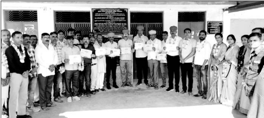
जालोर में शिक्षक संघ राष्ट्रीय के शैक्षिक अधिवेशन के पोस्टर का विमोचन हुआ।