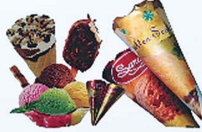
कोन आईसक्रीम, बटर स्कोव, चॉकलेट, वनीला, स्ट्रॉबेरी फ्लेवर्स