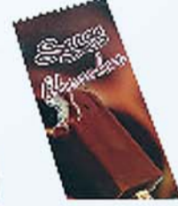
कैडी, चॉकलेट, मैंगो, अरिंज, रोज