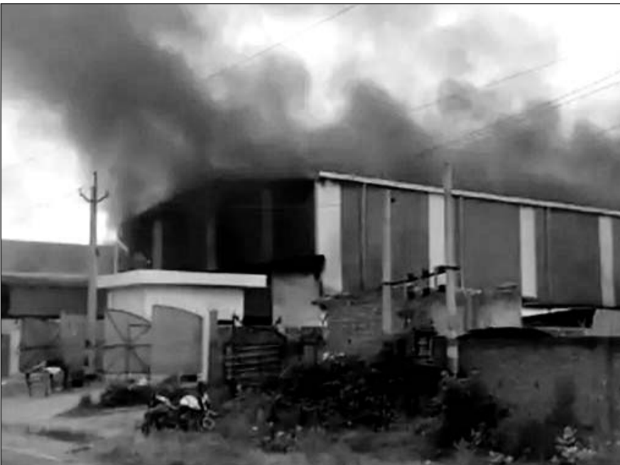
भिवाड़ी के पथरेड़ी औद्योगिक क्षेत्र में अवैध पटाखा बनाने वाली एक फैक्टरी में आग लग गई।