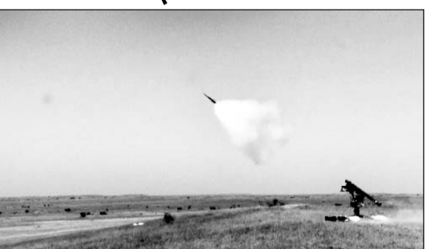
भारतीय सेना ने कम दूरी की एयर डिफेंस सिस्टम मिसाइल का सफल उड़ान परीक्षण किया।

मिसाइल के सफल उड़ान परीक्षण की रक्षामंत्री राजनाथसिंह ने भारतीय सेना को बधाई देते हुए कहा कि आधुनिक तकनीकी से लैस नई मिसाइल सशस्त्र बलों को हवाई खतरे के खिलाफ और अधिक तकनीकी बढ़ावा देगी। रक्षा मंत्रालय ने ट्वीट करते हुए बताया कि डीआरडीओ ने पोकरण से चौथी पीढ़ी की तकनीकी रूप से उन्नत हिट-टू-किल क्षमता की लघु हथियार प्रणाली के तीन उड़ान परीक्षण सफलतापूर्वक किए हैं। यह