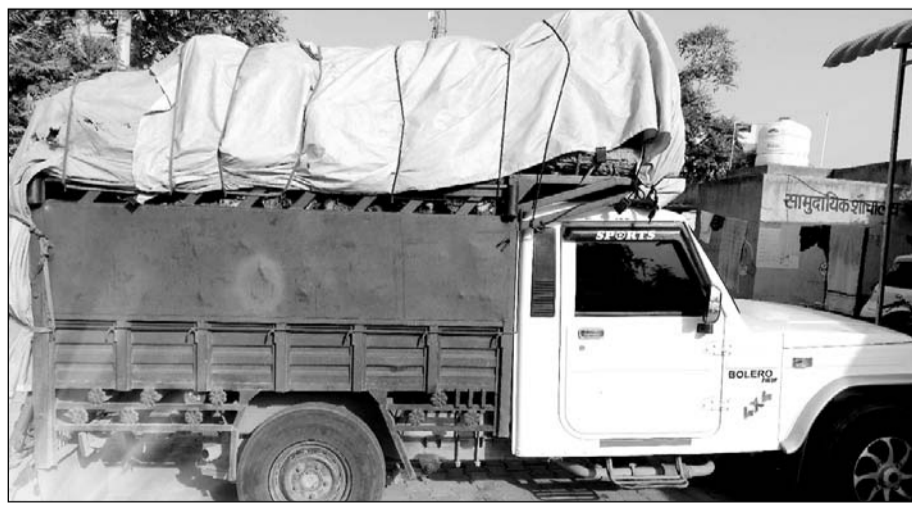
पचेरीकलां पुलिस ने अवैध लकड़ियों से भरी पिकअप को जब्त किया।

पर विशेष अभियान चला कर कार्रवाई की जा रही है। इसी दौरान पुलिस की टीम को सूचना मिली कि एक पीक अप में अवैध रूप से लकड़ियों भरकर हरियाणा की ओर ले जाए जा रही है। जिस पर पुलिस की ओर से थाना क्षेत्र के सडकों में हरियाणा जाने वाली पिकअप को नाकाबंदी की गई। नाकाबंदी के दौरान एक एक पिकअप गाड़ी आती हुई दिखाई दी, जिसको रुकवा कर तलाशी ली गई तो उसमें अवैधरूप से