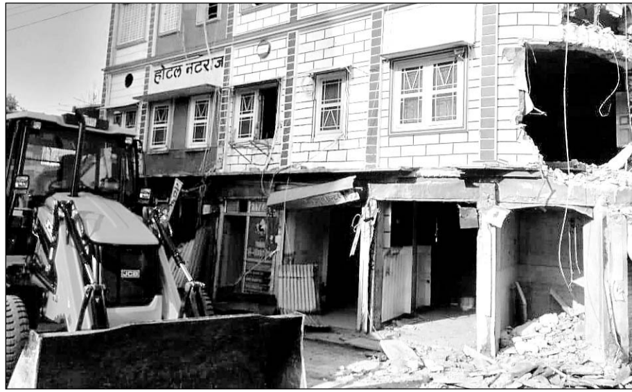
सीकर में कल्याण सर्किल के पास स्थित होटल नटराज के आगे के हिस्से को सड़क पर अतिक्रमण बताते हुए नीचे गिरा दिया।

बात है शहर के कल्याण सर्किल के पास स्थित होटल नटराज की। जिसके आगे के हिस्से को सड़क पर अतिक्रमण बताते हुए सार्वजनिक निर्माण विभाग, नगर परिषद ने पुलिस बल की सहायता से प्रशासनिक अधिकारियों की मौजूदगी में नीचे गिरा दिया। कार्रवाई रविवार को छुट्टी के दिन अलसुबह की गई। इस दौरान प्रशासन का अमला पूरी सरकारी मशीनरी के साथ मौके पर पहुंचा और तोड़फोड़ की कार्रवाई शुरू करनी चाही तो, होटल मालिक और दुकानदारों ने विरोध भी जताया। उन्होंने प्रशासनिक अधिकारियों को अपने दस्तावेज भी दिखाए। लेकिन अधिकारियों ने एक नहीं सुनी और देखते ही देखते होटल के आगे के हिस्से और नीचे बनी दुकानों को तोड़