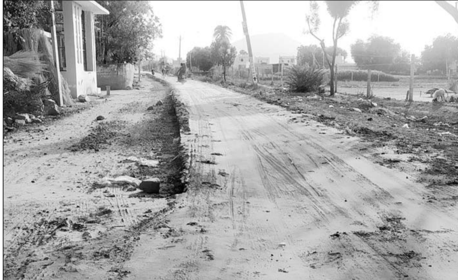
संवेदक द्वारा अधूरे सड़क मार्ग कार्य को छोड़ देने से लोग परेशान हो रहे हैं।

पावटा से कुनेड मार्ग तक दो किमी सड़क मार्ग पर सड़क निर्माण की अवधि के चार से पांच माह बाद निर्माण कार्य शुरू हुआ था, लेकिन सड़क निर्माण की अवधि समाप्त होने के पांच माह बाद भी अभी तक पूरा होने का नाम नहीं ले रहा है। विभागीय अधिकारियों द्वारा ध्यान नहीं दिया जाने की वजह से निर्माण अटकता ही जा रहा है। संवेदक द्वारा अधूरे सड़क मार्ग को छोड़ देने से लोग खराब सड़क को झेल रहे हैं। इस मार्ग से जो भी गुजरता वह