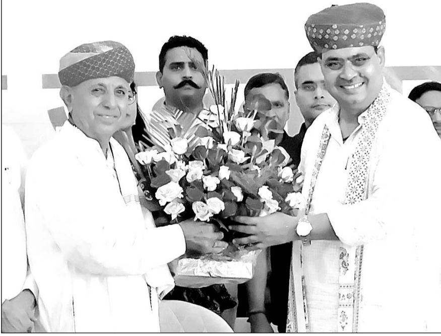
सीएम भजनलाल शर्मा ने केंद्रीय मंत्री भागीरथ चौधरी को जन्मदिन की शुभकामनाएं दीं।

समारोह को संबोधित करते हुये उन्होंने कहा कि किसानों के पानी की समस्या को लेकर उदयपुर से बीसलपुर बांध में पानी लाने के लिये विशेष योजना का काम शुरू हो गया है। उन्होंने अजमेर लोकसभा क्षेत्र से भाजपा की जीत के लिये आभार व्यक्त किया। केंद्रीय कृषि राज्य मंत्री भागीरथ चौधरी व आर के मार्बल ग्रुप चेयरमैन अशोक