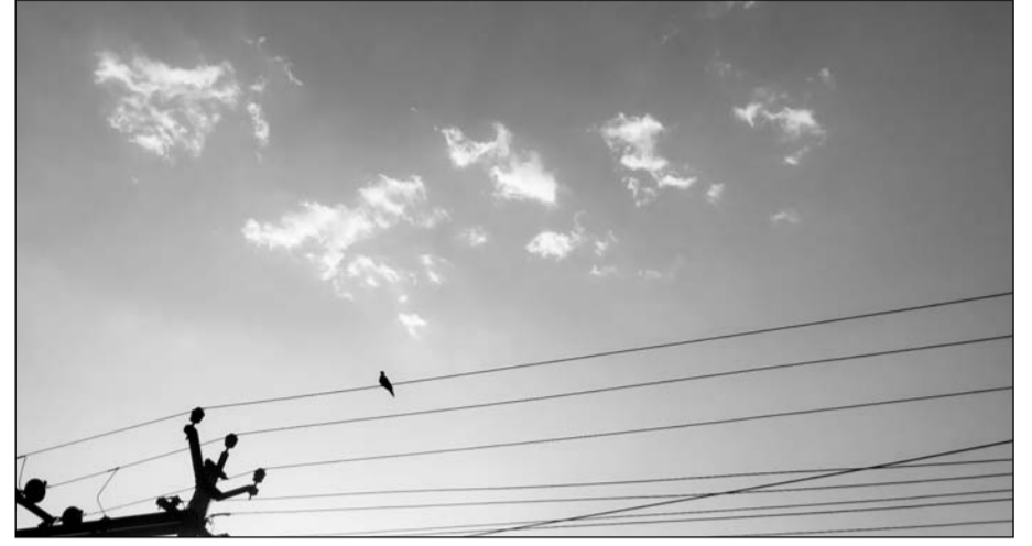
चूरू में शाम ढलने के बाद आसमान में हल्के बादलों की आवाजाही शुरू हुई।

प्री-मानसून ने नहीं दी दस्तक, गर्मी के कारण दिन में बाजारों में पसरा सन्नाटा