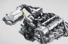
सुपर पावरफुल इंजन के साथ सुपर परफॉर्मंस