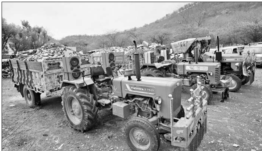
काछोला पुलिस ने अवैध खनन का ग्रेवल पत्थर परिवहन करने के मामले में ट्रैक्टर-ट्रॉली जब्त किये।

जस्सूजी का खेड़ा पंचायत क्षेत्र मिमरल के बगतपुरा के ग्रामीणों ने आरोप लगाया कि सरथला इलाके में लगी दो ग्राइंडर को फैक्ट्रियों में अवैध खनन के मिमरल को ग्राइंडिंग कर कई राज्यों में भेजा जा रहा है। फैक्ट्री संचालक और खनन माफिया की प्रशासन से सांट-गांट के कवायद लम्बे समय से सरकारी भूमि में पड़े पैमाने पर अवैध खनन का सिलसिला बदनूर जारी है। पिछले दिनों भी ग्रामीणों की शिकायत पर खजुरी (जहाजपुर) के तहसीलदार ने ग्रेवल मिट्टी परिवहन करते खनन माफिया के एक डम्पर को जब्त कर गोधपुरिया से जब्त किया