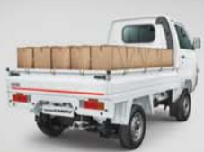
सुपर हैंडलिंग और स्थिरता