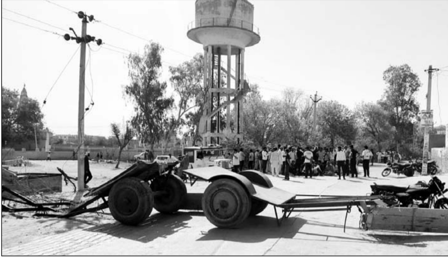
बिजली व पानी की समस्याओं को लेकर सिद्धमुख में ग्रामीण धरने पर बैठे।

सादुलपुर, (निर्स)। भीषण गर्मी में बिजली व पानी की किल्लत से परेशान ग्रामीणों का गुस्सा रविवार सुबह आठ बजे ही फूट पड़ा, जिसके चलते गुस्साए ग्रामीणों ने राजगढ़-भादरा मार्ग पर जाम कर दिया। इस दौरान ग्रामीणों ने राजकीय विद्यालय व शनिदेव मंदिर के पास सड़क को जाम कर जकार विरोध प्रदर्शन किया तथा शनिदेव मंदिर के पास मुख्य सड़क पर टेंट लगा कर धरना-प्रदर्शन शुरू कर दिया।