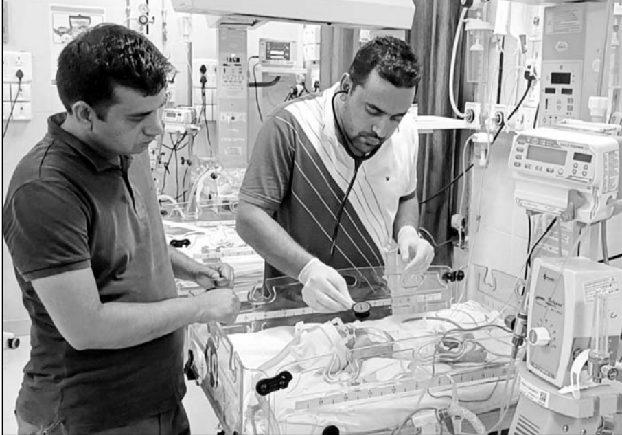
बीडीके अस्पताल के चिकित्सकों ने नवजात बच्चे को बचाने की कोशिश की।

झुंझुनू, (निर्स)। राजकीय जिला बीडीके अस्पताल में शनिवार रात को पालना गृह में छोड़ कर गए नवजात की आखिरकार जान नहीं बचाई जा सकी। बीडीके अस्पताल के चिकित्सकों ने सीपीआर देकर बच्चे को बचाने की कोशिश की लेकिन करीब छह घंटे बाद ही बच्चे की जान चली गई। बच्चे का रिविwar को मेडिकल बोर्ड से पोस्टमार्टम कराकर राजकीय शिशु गृह, पुलिस और नगर परिषद के सहयोग से मुक्ति धाम में दफनाकर अंतिम संस्कार किया गया।