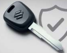
सुपर सुरक्षित, इंजन इमोबिलाइजर के साथ और 18+ सुरक्षा विशेषताएं