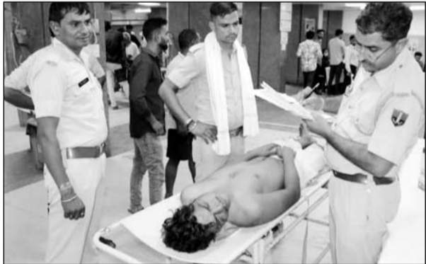
पुलिस ने अस्पताल में घायल युवक के बयान लिये।

अजमेर, (कास)। रामगंज थाना क्षेत्र के खानपुरा में रहने वाले एक युवक का वैन और बाइक पर सवार होकर आए बदमाशों ने अपहरण कर मारपीट की और जौंगमंडल क्षेत्र में अधमरा सड़क किनारे पटक कर फरार होने का मामला सामने आया है। परिजन ने मामले की शिकायत थाने में दर्ज कराई है। पुलिस ने युवक को अस्पताल पहुंचाया, जहां उपचार जारी है। युवक दो माह पहले जेल से छूट कर बाहर आया था। पुलिस ने मामला दर्ज कर जांच शुरू कर दी है।