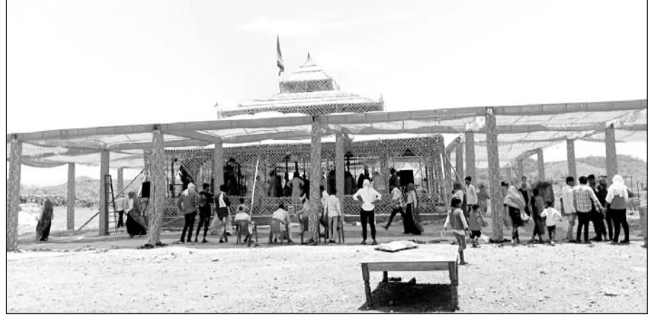
बाबा दादेश्वर महाराज मंदिर परिसर में समापन समारोह का आयोजन किया गया।

■ श्रद्धालुओं ने महायज्ञ में आहुति देकर की खुशहाली की कामना