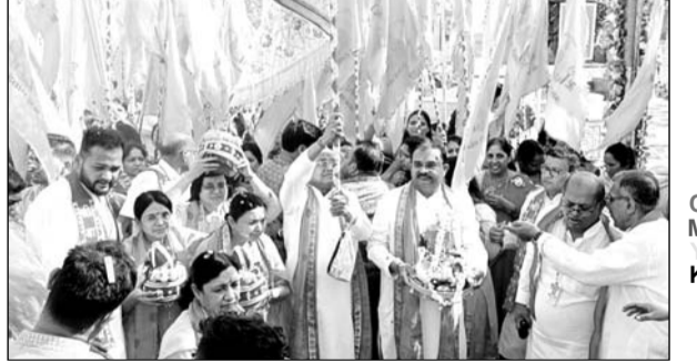
शोभायात्रा में 400 महिलाएं हाथ में ध्वजा लेकर जयकारे लगाते हुए चल रही थी।

झुंझुनू, (निर्स)। श्री पंचदेव मंदिर में आयोजित बाबा गंगाराम गंगा दशहरा महोत्सव विभिन्न धार्मिक कार्यक्रमों के साथ रविवार को धूमधाम एवं श्रद्धापूर्वक मनाया गया। पंचदेव मंदिर में इस अवसर पर भजन संध्या, छप्पन भोग एवं दर्शन पूजन के कार्यक्रमों का आयोजन हुआ। कोलकाता के कारीगरों ने मंदिर का आकर्षक शृंगार किया। फूलों से सुसज्जित बाबा की प्रतिमा सबका मन मोह रही थी।