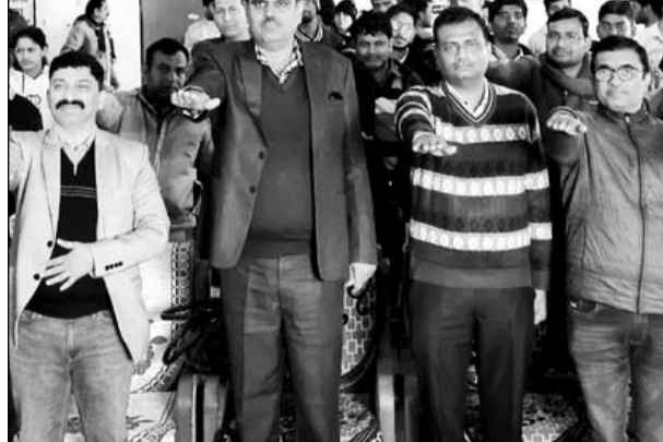
ई.सी.बी. में सड़क सुरक्षा विषय पर आयोजित कार्यशाला में यातायात नियमों की पालना की शपथ दिलाई।