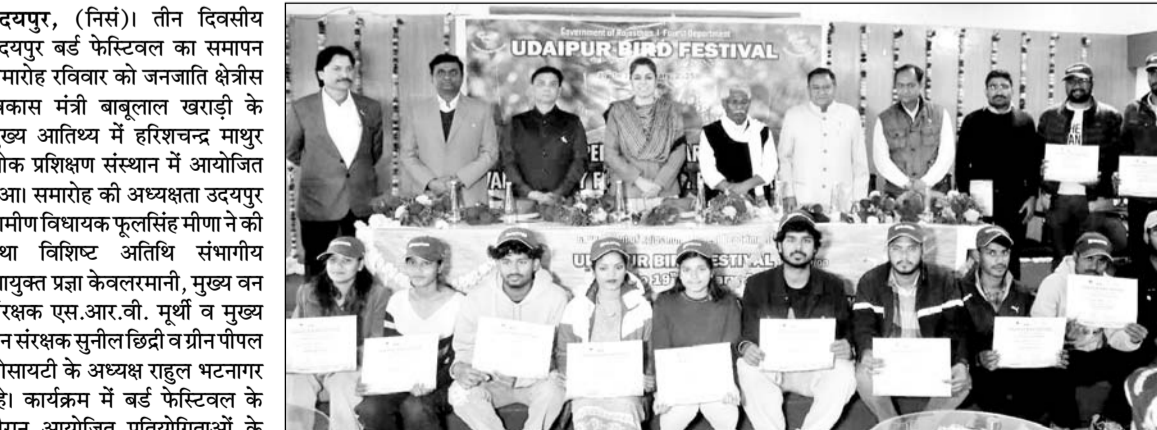
बर्ड फेस्टिवल में विभिन्न प्रतियोगिताओं के विजेताओं को अतिथियों ने सम्मानित किया।

उदयपुर बर्ड फेस्टिवल का समापन, विभिन्न प्रतियोगिताओं के विजेताओं को पुरस्कृत किया