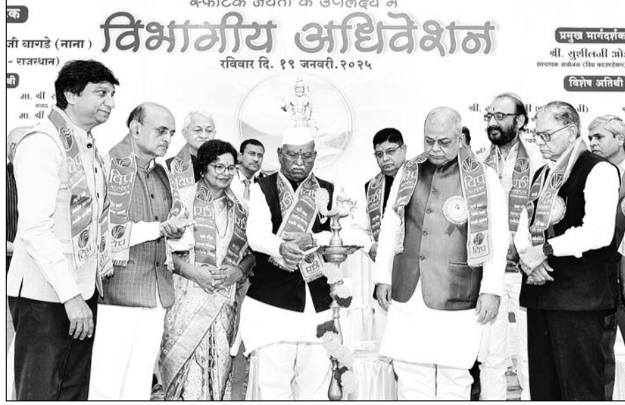
राज्यपाल हरिभाऊ वागडे ने रविवार को छत्रपति संभाजी नगर में विप्र फाउंडेशन, विभागीय अधिवेशन का उद्घाटन किया।

जयपुर (कासं)। राज्यपाल हरिभाऊ वागडे ने रविवार को छत्रपति संभाजी नगर में विप्र फाउंडेशन, विभागीय अधिवेशन का उद्घाटन किया। उन्होंने इस दौरान कहा कि जो समाज महिला सशक्तिकरण, समाज सेवा और सामाजिक समरसता के लिए कार्य करता है, वही निरंतर आगे बढ़ता है। उन्होंने कहा कि विप्र सिर्फ समाज ही नहीं बल्कि भारत की संस्कृति है। जो ब्रह्म यानी अंतिम सत्य को जानता है,