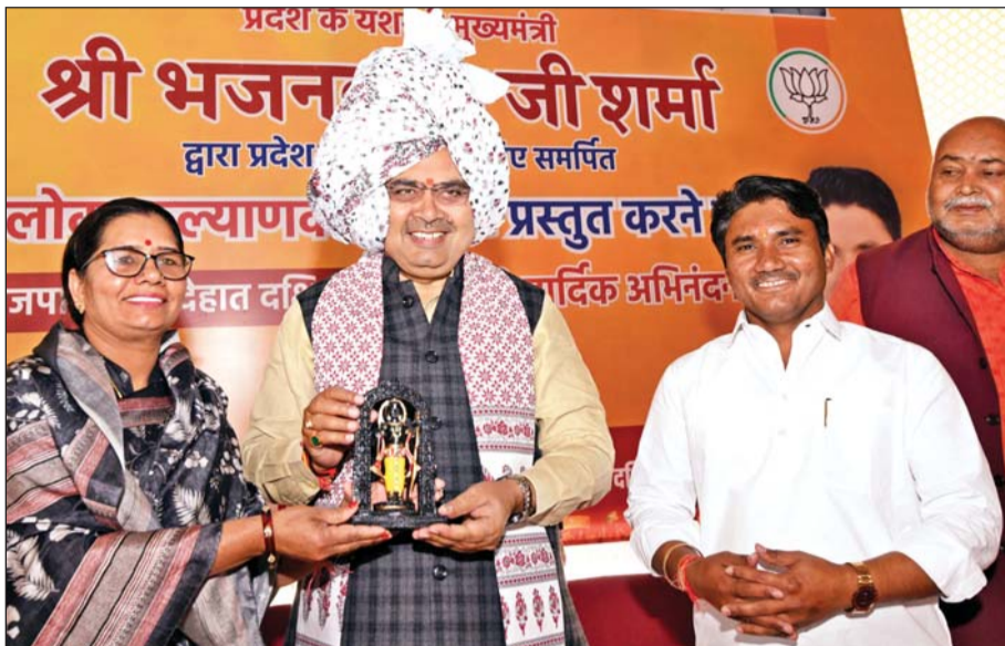
जयपुर देहात (दक्षिण) की ओर से आए प्रतिनिधिमंडल ने बजटीय घोषणाओं के लिए मुख्यमंत्री भजनलाल शर्मा का स्वागत किया। इस अवसर पर आमजन ने मुख्यमंत्री को स्मृति चिन्ह भेंट कर सम्मानित किया।

मुख्यमंत्री भजनलाल ने कहा कि जयपुर के विस्तार के साथ, आस-पास के इलाकों में सुख-सुविधाओं के विस्तार के लिये बजट में अनेक प्रावधान किये गये हैं।