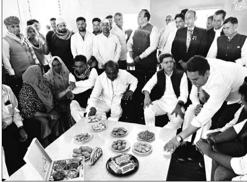
टोंक में राजमिडवे होटल पर कांग्रेसजनों ने बुधवार को पूर्व उपमुख्यमंत्री एवं वर्तमान टोंक विधायक सचिन पायलट का भव्य स्वागत किया।

टोंका पूर्व उपमुख्यमंत्री एवं वर्तमान टोंक विधायक सचिन पायलट अल्प प्रवास पर टोंक आये तथा कांग्रेसी कार्यकर्ताओं से मिलने के बाद यहां उन्होंने प्रेस से मिलकर बताया कि टोंक में जो प्रोजेक्ट शुरू किये गये थे उनको लेकर उन्होंने अधिकारियों की बैठक ली तथा अधिकारियों को निर्देश दिये हैं। विशेष रूप से नगर परिषद से जुड़े वे सभी कार्य जो कांग्रेसकाल में शुरू थे वे सभी पूरे किये जायेंगे। जिले में मीठे पानी को लेकर कन्ट्रोलेन्सी प्लान बनाये गये हैं, जो एक-दो महिने में ही पूरे हो जायेंगे। घनातलाई प्रोजेक्ट के बारे में उन्होंने कहा कि उसके गन्दे पानी की निकासी कर, उसका सौन्दर्यकरण का कार्य भी होना है, जियके लिए मैं दो करोड़ की राशि पूर्व में दे चुका हूं।