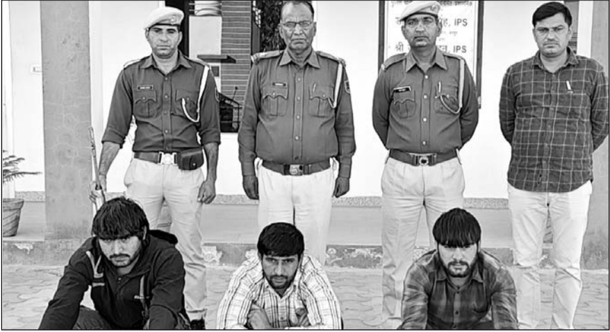
उप कारागृह राजगढ़ पर पत्थरबाजी कर राजकार्य में बांधा पहुंचाने वाले तीन और आरोपियों को पकड़ा।