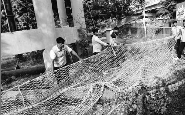
पानी की टंकी पर चढ़े दो बरोजगारों को सुरक्षित उतारने की कवायद में जुटे आपदा प्रबंधन के कर्मचारी।