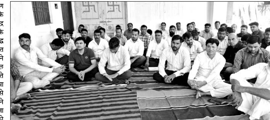
अजमेर के उबरा का देवरा में गुर्जर समाज के पंच पटेलों की बैठक हुई।