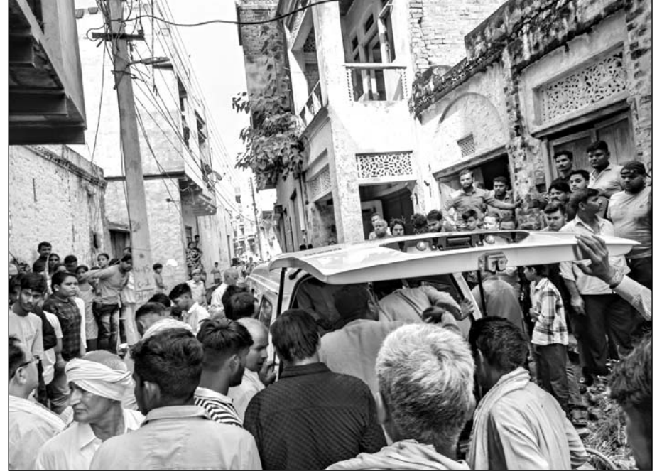
कामां में मामी-भांजे ने खुदकुशी करने के बाद लोगों की भीड़ एकत्रित हो गई।

कामां (निस)। डीग जिले के कामां थाना इलाके में मामी भांजे का शव पंखे के कुंडे से लटका मिला। जब लोगों को घटना का पता लगा तो, उन्होंने पुलिस को सूचना दी। जिसके बाद पुलिस मौके पर पहुंची। पुलिस ने शव को नीचे उतारा। वहीं एफएसएल की टीम ने तथ्य जुटाए। उसके बाद शवों को पोस्टमार्टम के लिए ले जाया गया।