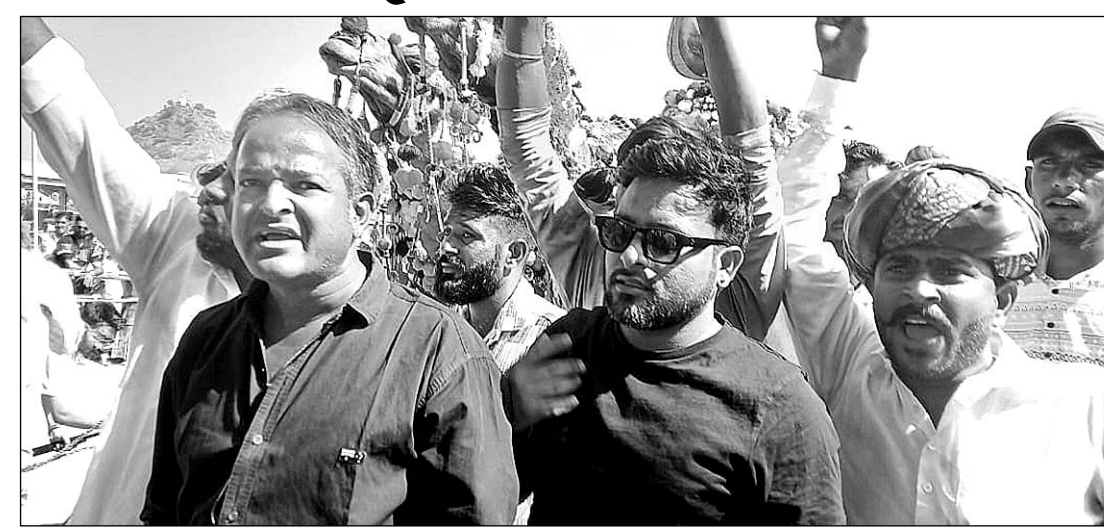
पुष्कर मेले में काफी संख्या में देशी व विदेशी पर्यटकों का आना जारी है।

पुष्कर 10 नवंबर। पुष्कर के सालाना मेले में राजस्थान सहित देश के विभिन्न राज्यों से श्रद्धालु पहुंच रहे हैं वहीं सात समुन्द्र पार से विदेशी मेहमानों के आने से ब्रह्मजी की पावन नगरी पूर्व पश्चिम संस्कृति की स्थली में तब्दील हो गई है। सैलानियों को मेले में आ रहे ठामाँग महिला पुरुष श्रद्धालुओं के साथ ऊट व घोड़े चोड़ियों करतब लुभा रहे हैं। पशुओं की मंडी में पशुपालक खरीद फरोख्त में मशगूल है।