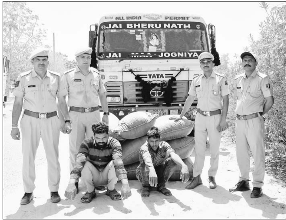
पुलिस ने डोडा-पोस्ट की तस्करी करते हुये दो जनों को डोडा-पोस्ट सहित गिरफ्तार किया।

ट्रेलर में सीमेंट के कट्टों के नीचे नौ कट्टों में 1 क्विंटल 71 किलो अवैध डोडा-पोस्ट छिलका पकड़ा