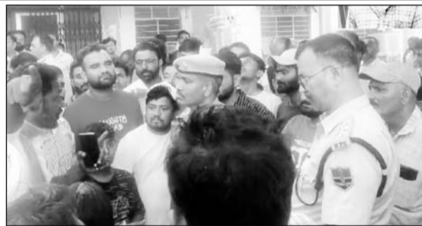
मृतक के परिजनों ने अधीक्षण अभियंता कार्यालय का घेराव किया।

जानकारी के अनुसार शहर के महारावल स्कूल के पास पोल पर फाल्ट दूर करते समय अचानक सप्लाई चालू