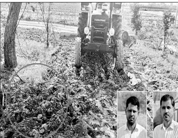
भादवा वाली गांव के खेत में पड़े बिजली का तार हटाने के लिए ट्रैक्टर से एक भाई नीचे उतरा तो करंट की चपेट में आ गए।

थाना चूनावढ़ की मौत हो गई। घटना के सूचना मिलने पर चूनावढ़ पुलिस पोस्टमार्टम करवाकर शव परिजनों को थाना के एएसओ राजीव रूयल से सौंप दिया। घटना का पता चलते ही गांव पुलिस जाब्ले के साथ मौके पहुंचे और घटना स्थल का मौका मुआयना कर शवों को जिला अस्पताल की मोर्चरी में