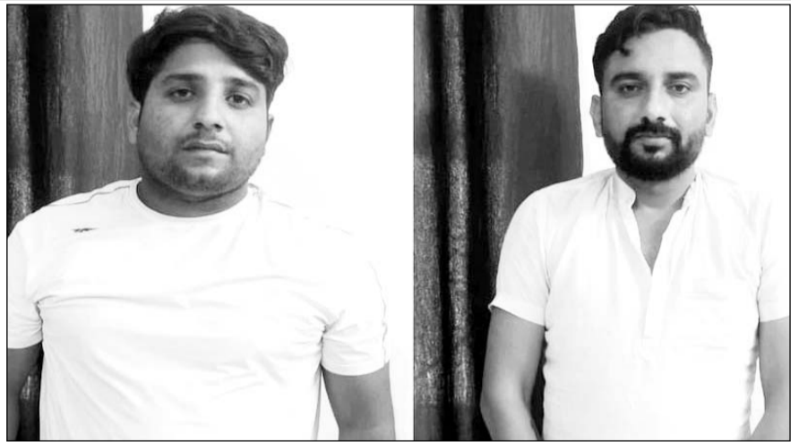
पुलिस द्वारा पकड़े गये दोनों बदमाश।