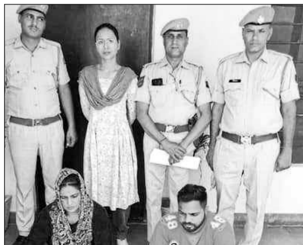
हनुमानगढ़ सदर थाना पुलिस ने मोबाइल पर अश्लील वीडियो कॉलिंग के माध्यम से लोगों को ब्लैकमेल करने वाले गिरोह को दबोचा।