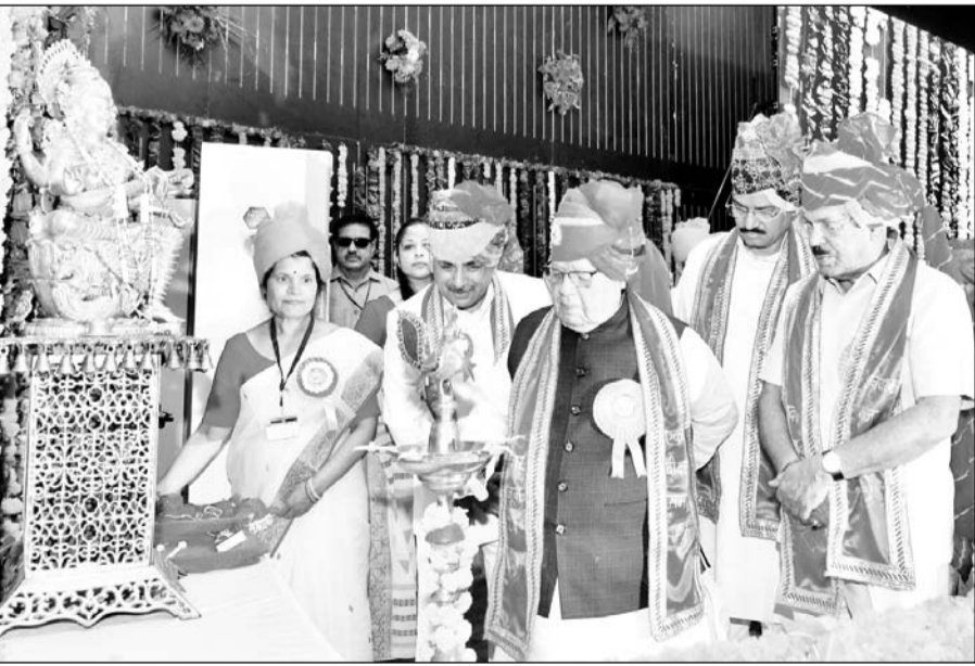
राज्यपाल एवं कुलाधिपति कलराज मिश्र, विधानसभा अध्यक्ष वासुदेव देवनानी, उपमुख्यमंत्री प्रेमचन्द बैरवा एवं जल संसाधन मंत्री सुरेश सिंह रावत ने दीप प्रज्ज्वलित कर कार्यक्रम की शुरुआत की।

कार्यक्रम की अध्यक्षता करते हुए राज्यपाल एवं कुलाधिपति कलराज मिश्र ने कहा कि दीक्षांत विद्यार्थियों के लिए नव जीवन में प्रवेश का उत्सव है। यह वह अवसर है जब विद्यार्थी अर्जित शिक्षा का उपयोग राष्ट्र और समाज के विकास में करने के लिए तैयार होता है। उन्होंने कहा कि शिक्षा की सार्थकता इसमें नहीं है कि उससे हम कोई पद, नौकरी या अन्य किसी तरह की भौतिक सफलता प्राप्त कर लें। शिक्षा की सार्थकता इसमें है कि हम रूढ़ियों से मुक्त होने की ओर अग्रसर हों। उन्होंने महर्षि दयानंद सरस्वती के जीवन पर चर्चा की। उन्होंने कहा कि यह बहुत महत्वपूर्ण है कि देश की नई शिक्षा नीति पूरी तरह से विद्यार्थी केन्द्रित है। यह प्राचीन भारतीय ज्ञान के आलोक में ऐसे पाठ्यक्रमों के निर्माण पर जोर देती है जिससे विद्यार्थी हमारी संस्कृति से जुड़े एवं जीवन मूल्यों में आधुनिक विकास की ओर अग्रसर हो सके। इस नीति में कौशल विकास पर विशेष जोर दिया गया है। उन्होंने कहा कि उभरती डिजिटलीकृत दुनिया में नए आविष्कारों