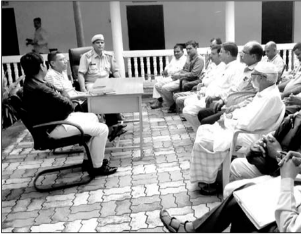
आसींद पुलिस थाने में बारावफात व गणेश प्रतिमा विसर्जन त्योहार को लेकर सीएलजी की बैठक हुई।

बैठक में निम्नलिखित बिंदुओं पर चर्चा की गई : त्योहार के दौरान सुरक्षा के लिए अतिरिक्त पुलिस बल तैनात करना, शांति और सुरक्षा के लिए निगरानी रखना, त्योहार के दौरान यातायात के लिए विशेष व्यवस्थाएं करना व त्योहार के दौरान सामुदायिक सौहार्द बनाए रखने के लिए आवश्यक कदम उठाना पर चर्चा की गई। बैठक में सभी अधिकारियों ने अपने-अपने सुझाव दिए और त्योहार के दौरान