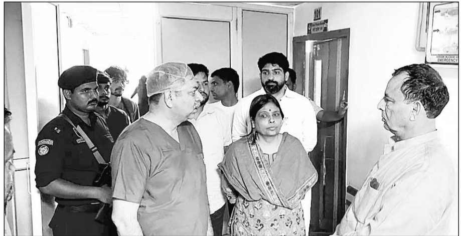
भाजपा हरियाणा प्रभारी एवं भाजपा राजस्थान पूर्व प्रदेश अध्यक्ष डॉ. सतीश पूनिया का मंगलवार देर रात को रोहतक (हरियाणा) में अपेंडिक्स का सफल ऑपरेशन हुआ।

■ भाजपा केंद्रीय नेतृत्व से लेकर हरियाणा एवं राजस्थान प्रदेश नेतृत्व ने सतीश पूनिया के शीघ्र स्वस्थ होने की कामना की