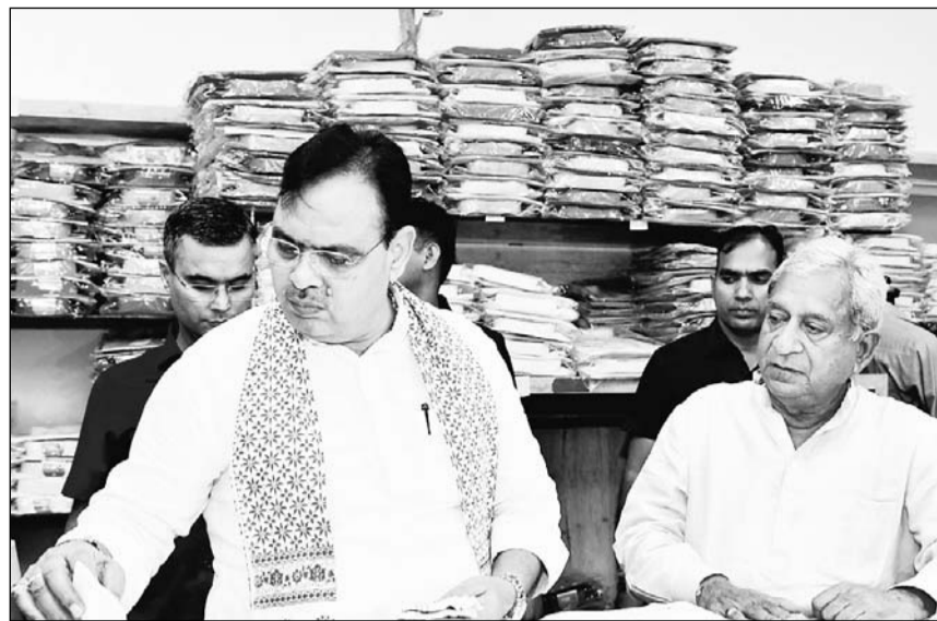
मुख्यमंत्री भजनलाल शर्मा ने बुधवार को राजस्थान खादी एवं ग्रामोद्योग बोर्ड परिसर स्थित खादी प्रदर्शनी का अवलोकन किया।

जयपुर। गांधी जयंती के अवसर पर मुख्यमंत्री भजनलाल शर्मा ने बुधवार को राजस्थान खादी एवं ग्रामोद्योग बोर्ड परिसर स्थित खादी प्रदर्शनी का अवलोकन किया।