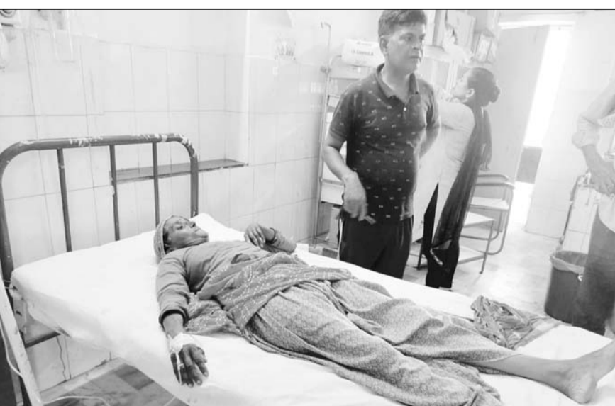
महिला को प्राथमिक उपचार के बाद जयपुर एसएमएस अस्पताल रेफर किया।