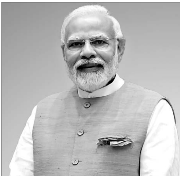
प्रधानमंत्री नरेन्द्र मोदी

आज देश के हर सेक्टर में नारी शक्ति मिसाल बन रही है